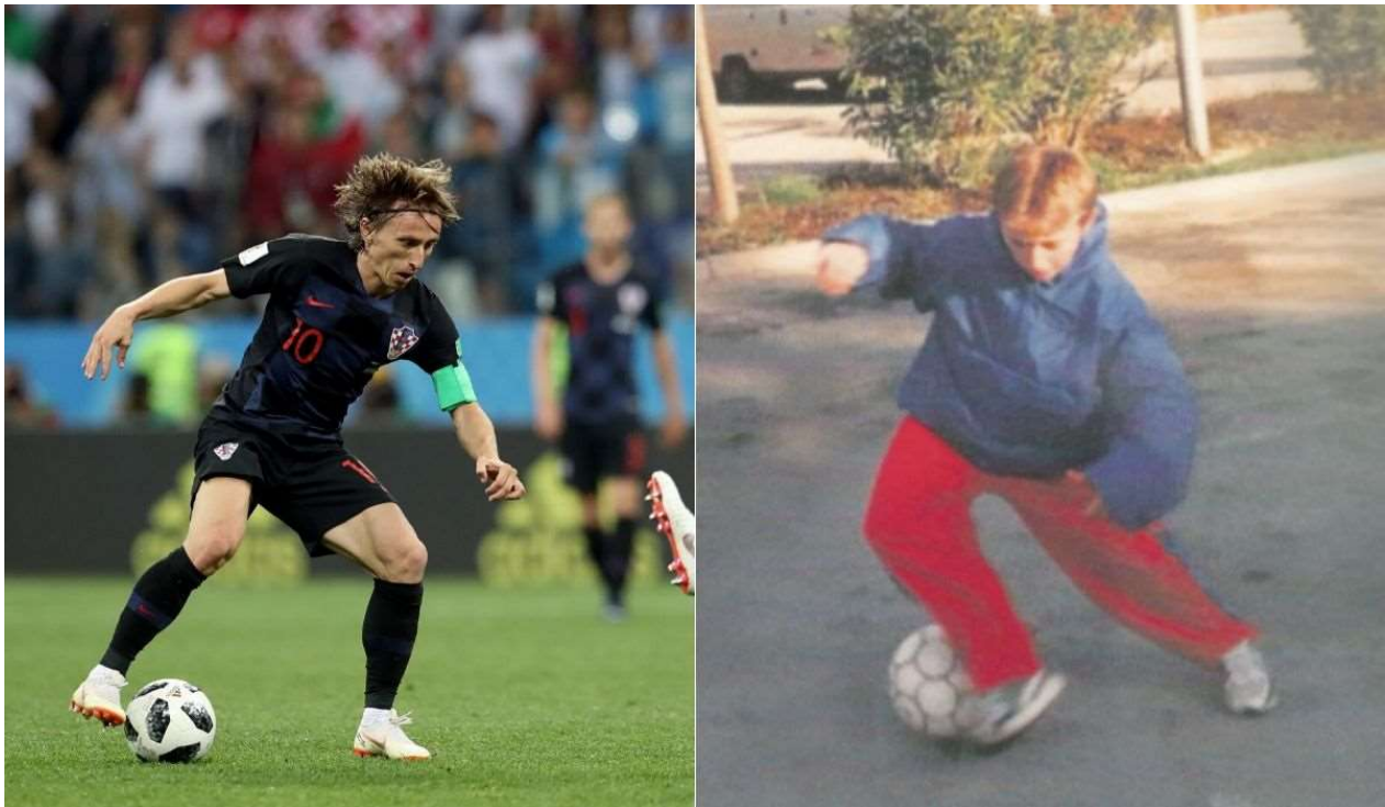
Slika 2. Luka Modrić na parkiralištu hotela Kolovare u godinama izbjeglištva (64) i Luka Modrić na utakmici protiv Argentine 2018.

Da bi, zbog istinitosti tvrdnji navedenih u tekstu, a koje se kroz prethodnu fotografiju mogu dokazati, vidjeli vjerne elemente Modrićevog života, ovakav sastav autobiografije s fotografijama kod čitatelja može dovesti osjećaj spektakularnosti. Djetinjstvo je u Modrićevom i Džekinom slučaju, što će se vidjeti u nastavku rada, bilo iz samog centra ratnih zbivanja dok je Zlatan Ibrahimović, prema svom pripovijedanju u autobiografiji, imao druge tipove egzistencijalnih problema koji su se izražavali kroz problematično ponašanje i teško stanje u obitelji.