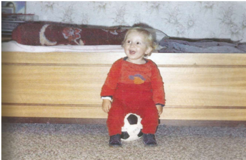
Slika 1. Modrić s nogometnom loptom 1986. godine (64)

Na kraju dijela autobiografije o djetinjstvu nalazi se 14 različitih fotografija Luke Modrića kojima se postiže određena emocija kod čitatelja s obzirom na to da je prikazan u izrazito siromašnom ruhu i kroz težak život koji je tada prolazio. Fotografski zapisi važni su u autobiografijama jer čitateljima daju predodžbu o nečijem životu iz prošlosti.