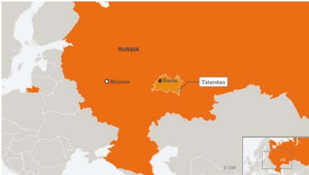
Slika 3. Geografska karta Tatarstana