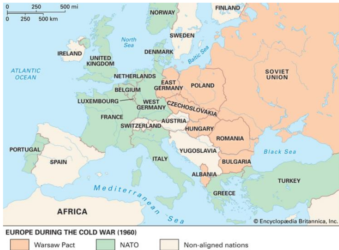
Slika 1. Karta svijeta s podjelom na članice NATO saveza i Varšavskog pakta 1960. godine

Izvor: https://www.britannica.com/event/Warsaw-Pact Pristupljeno 15. kolovoza 2022. godine