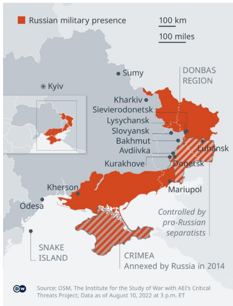
Slika 8. Ukrajina u kolovozu 2022. godine