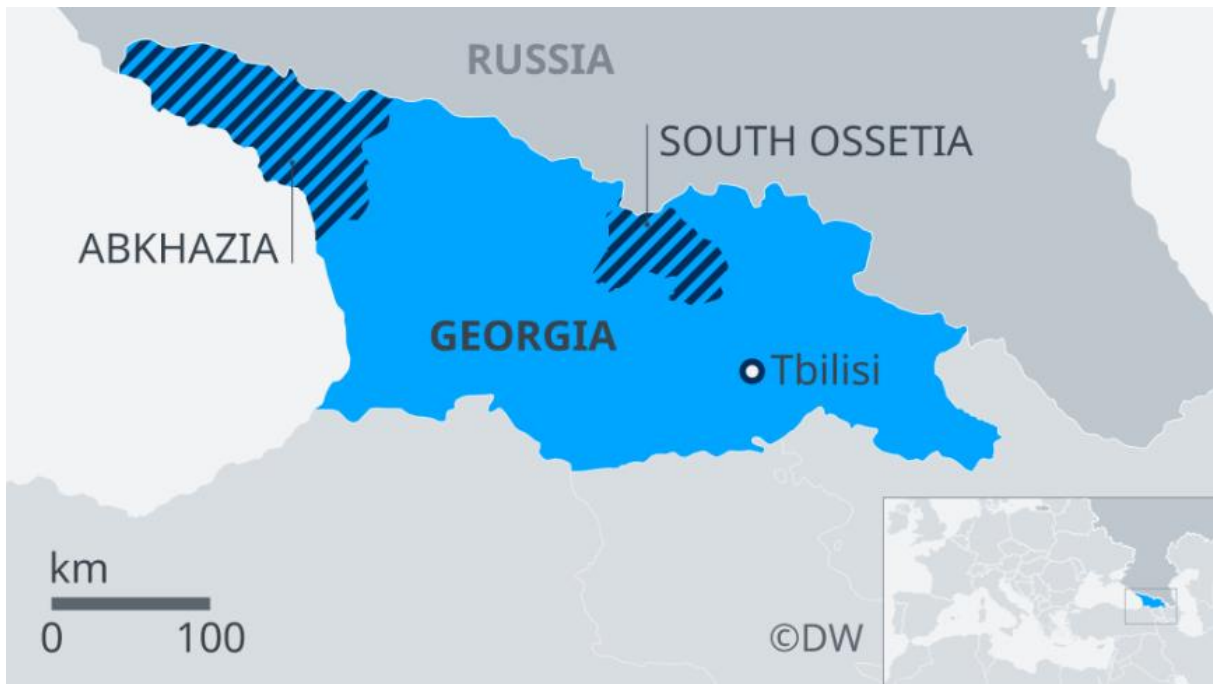
Slika 5. Geografska karta Gruzije