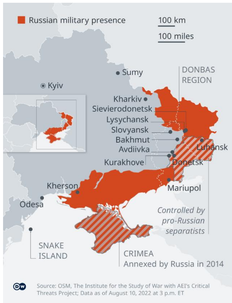
Slika 8. Ukrajina u kolovozu 2022. godine

Izvor: https://www.dw.com/en/has-russias-carpet-bombing-of-ukraine-been-halted/a-62732182 Pristupljeno 15. kolovoza 2022. godine