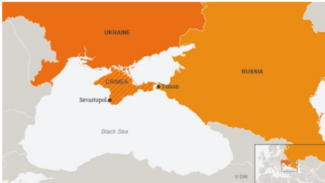
Slika 7. Geografska karta Krima