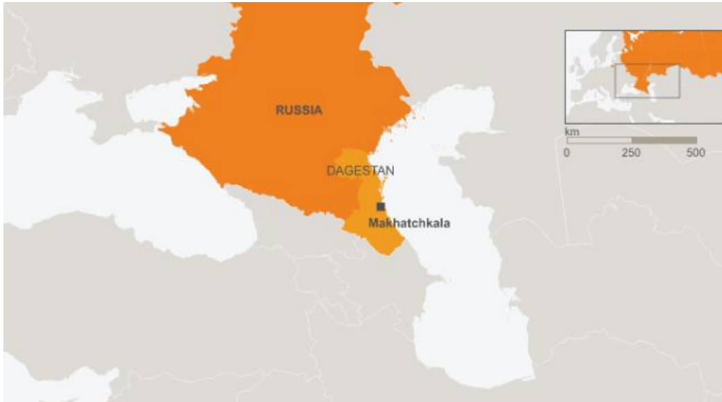
Slika 4. Geografska karta Dagestana

Federacije 2006. godine zabilježeno je nepoštivanje Tatarske autonomije u vidu rusifikacije, kada Ruska Federacija nameće ćirilicu kao službeno pismo (Notholt, 2008: 7.21). Godine 2009. ukida se obvezni obrazovni program učenja materinjskog jezika (Dinç, 2022: 192).