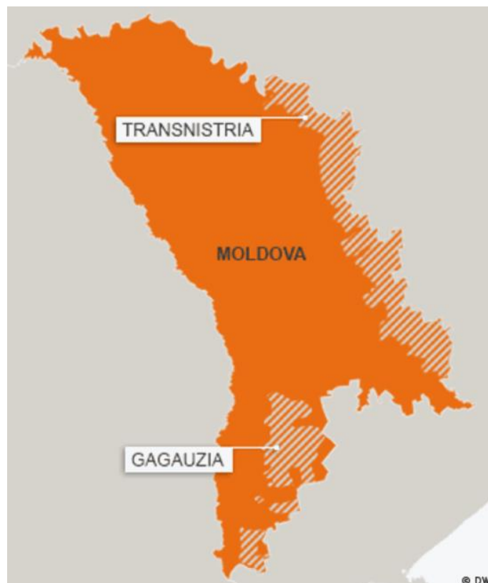
Slika 6. Geografska karta Moldavije