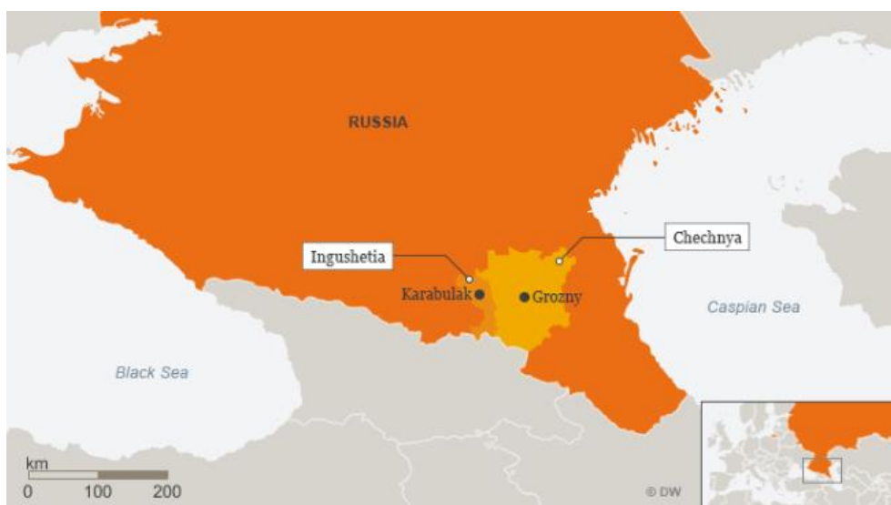
Slika 2. Geografska karta Čečenije