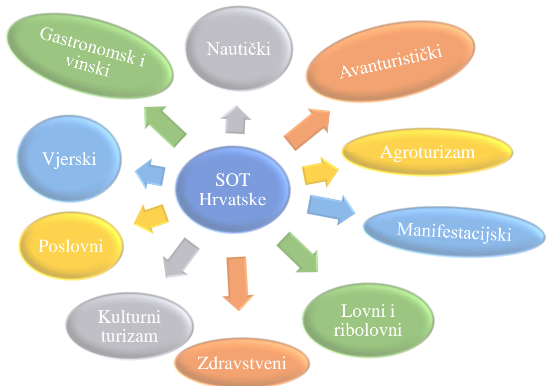
Slika 1. Neki od najvažnijih selektivnih oblika turizma u Republici Hrvatskoj