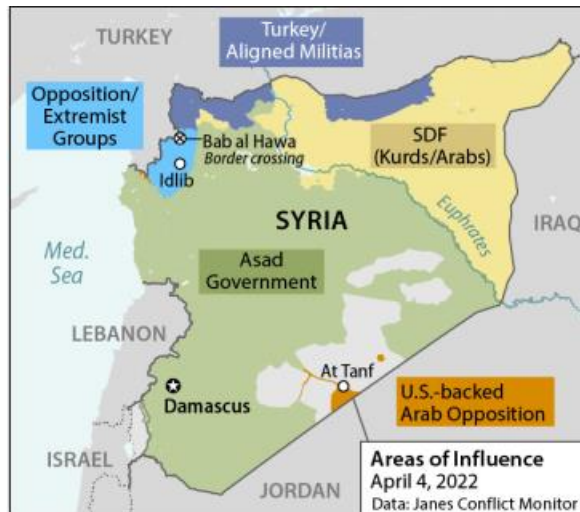
Slika 1. Sirija: područja utjecaja