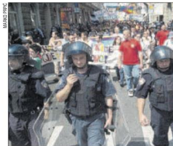
Lanjski Zagreb Pride pratile su jake snage osiguranja

U Večernjem listu također je uočen diskurs prijetnje, što je vidljivo i iz naslova članka koji glasi „Braniteljske i vjerske udruge: Stop izopačenosti! (Večernji list, 7.7.2002.). Povorka ponosa opisana je kao vrsta javne promocije izopačenosti koja se održava u glavnom gradu Hrvatske. Takav događaj, za braniteljske, vjerske i obiteljske udruge, narušava temeljna tradicijska načela hrvatskog društva i vrijednosti braka i obitelji.