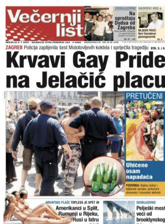
Slika 13. Naslovnica Večernjeg lista, 8. srpnja 2007. godine