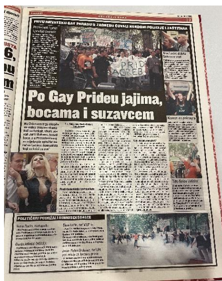
Slika 8. Jutarnji list 30. lipnja 2002. godine