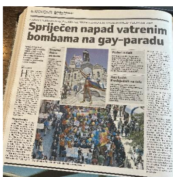
Slika 12. Slobodna Dalmacija, 8. srpnja 2007. godine