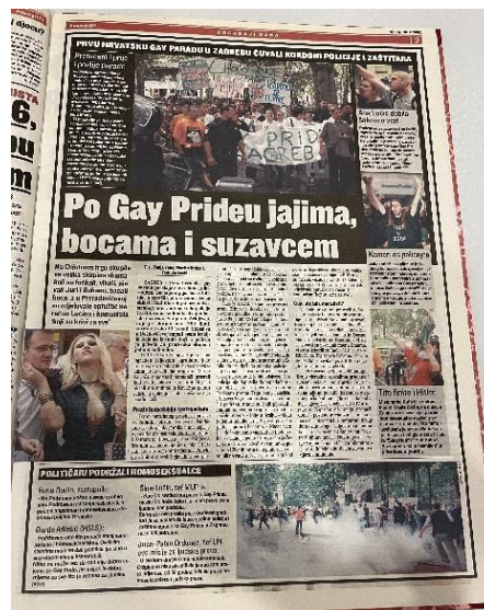
Slika 8. Jutarnji list 30. lipnja 2002. godine