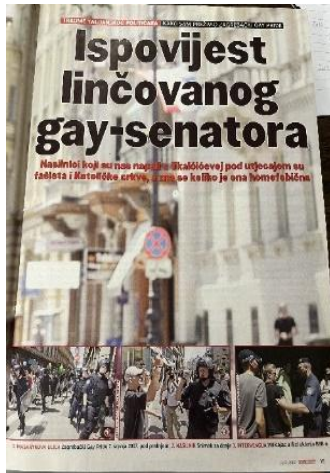
Slika 16. Globus, 13. srpnja 2007. godine