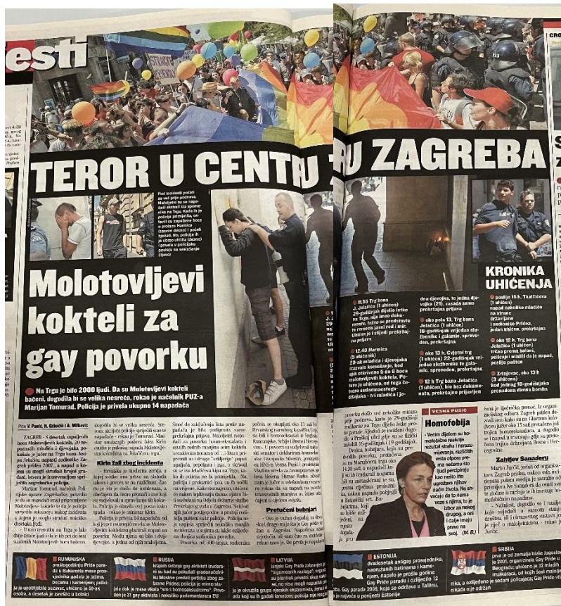
Slika 15. Jutarnji list, 8. srpnja 2007. godine