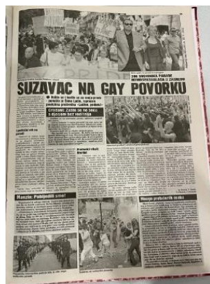
Slika 6. Večernji list, 30. lipnja 2002. godine