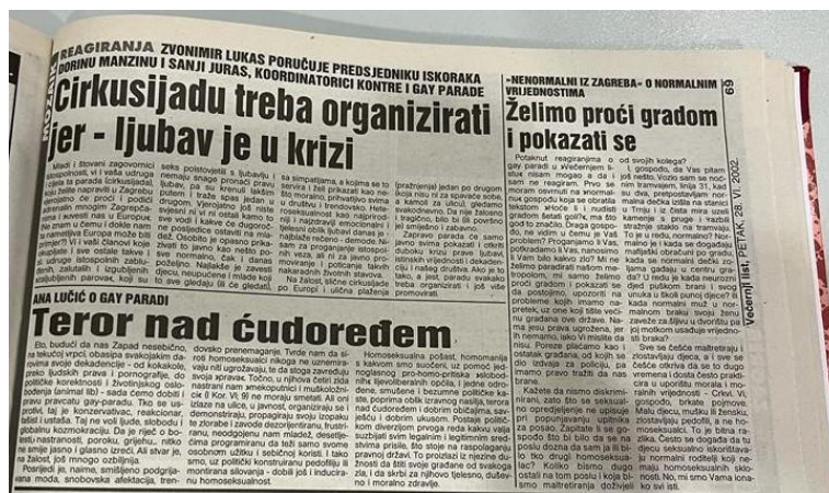
Slika 3. Večernji list 28. lipnja 2002.

Diskurs MI - normalni / ONI – nakazni pronađen je u tri članka, od toga 2 u Večernjem listu i 1 u Jutarnjem listu. Ovaj diskurs prisutan je u izjavama komentatora rubrike Mozaik (Večernji list), političke aktivistkinje te šefa Sindikata policije, koji su javno iznijeli negativne komentare i osudili LGBT zajednicu.