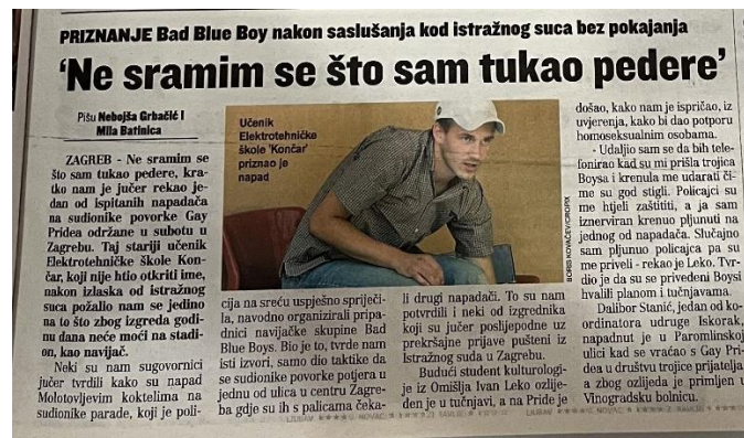
Slika 19. Jutarnji list, 9. srpnja 2007. godine

Godine 2007. ponovno je zabilježena upotreba riječi peder u Jutarnjem listu. Naime, nakon najnasilnije povorke ponosa u Zagrebu, privedeno je nekoliko osoba, a Jutarnji list prenio je komentar učenika srednje škole koji je izjavio kako se ne srami što je tukao „pedere“. U političkom tjedniku Globus koji je objavio članak na pune dvije stranice s naslovom „Marš homoseksualaca: Idemo na Zagreb!“, homoseksualci su imenovani „pederima i tetkicama“ (Globus, 28.6.2007.). Na portalu Jutarnji.hr nakon prve povorke ponosa u Splitu objavljen je članak iz kojeg doznajemo kako su protivnici povorke LGBT zajednicu nazivali „nakazama i pederima“ (jutarnji.hr 11.06.2011.)