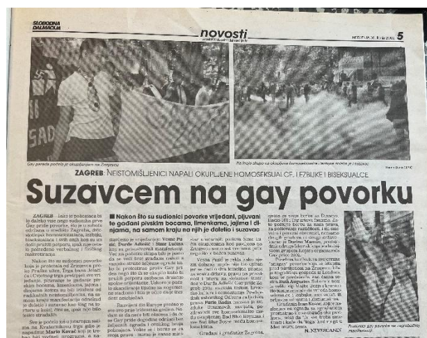
Slika 10. Slobodna Dalmacija, 30. lipnja 2002. godine