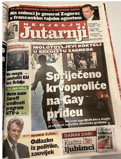
Slika 14. Naslovnica Jutarnjeg lista, 8. srpnja 2007. godine