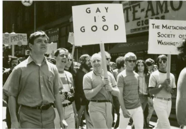
Slika 1. Prva parada ponosa u New Yorku, 27. lipnja 1970.