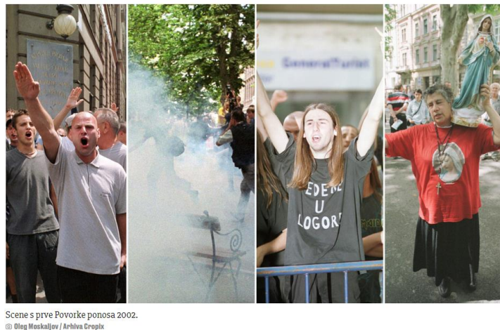
Slika 2. Scene s prve hrvatske Povorke ponosa 2002.

Na portalu Jutarnji.hr 8. lipnja 2019. obavljen je članak s naslovom „EVO KAKO JE IZGLEDALA POVORKA PONOSA PRIJE 18 GODINA Degutantno vrijeđanje, nacistički pozdravi, suzavac... Scene kakve ne možete zamisliti“ te fotogalerija iz 2002. godine. Fotografije prikazuju skupinu mladih muškaraca koji pokazuju nacistički pozdrav, bacanje suzavaca, muškarca s natpisom na majici „Pedere u logore“ te gospođu s likom Djevice Marije na majici te kipom i krunicom oko vrata (jutarnji.hr, 2019).