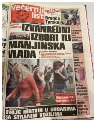
Slika 5. Večernji list, 30. lipnja 2002. godine