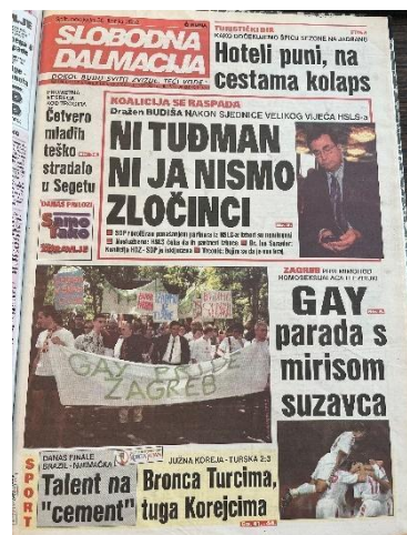
Slika 9. Slobodna Dalmacija, 30. lipnja 2002. godine

paradu“ (Jutarnji list, 30.6.2002.). Novinari su izvijestili kako je prva povorka ponosa održana „na rubu incidenta zbog uvreda, pljuvanja te bacanja jaja protivnika skupa na trisotinjak sudionika parade“ (Jutarnji list, 30.6.2002.). Slični naslovi objavljeni su i u dnevnom listu Slobodna Dalmacija. Naslov iz 2002. godine glasi „Gay parada s mirisom suzavca“ (Slobodna Dalmacija, 30.6.2002.), dok je 2007. objavljena naslovnica „Spriječen napad na gay-paradu“ i tekst s naslovom „Spriječen napad vatrenim bombama na gay-paradu“ (Slobodna Dalmacija, 8.7.2007.).