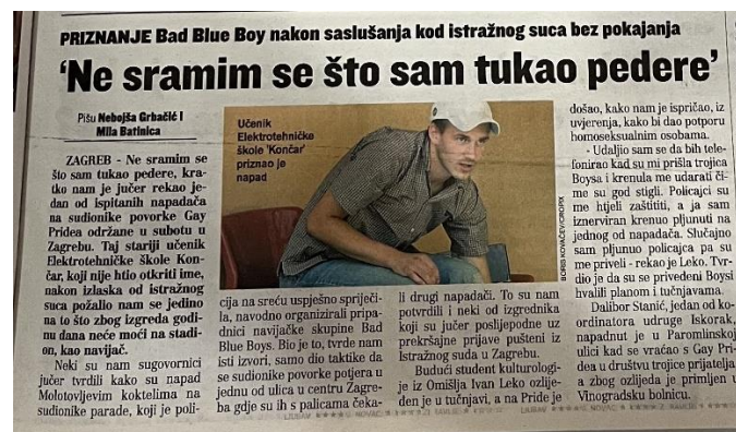
Slika 19. Jutarnji list, 9. srpnja 2007. godine

Godine 2007. ponovno je zabilježena upotreba riječi peder u Jutarnjem listu. Naime, nakon najnasilnije povorke ponosa u Zagrebu, privedeno je nekoliko osoba, a Jutarnji list prenio je komentar učenika srednje škole koji je izjavio kako se ne srami što je tukao „pedere“. U političkom tjedniku Globus koji je objavio članak na pune dvije stranice s naslovom „Marš homoseksualaca: Idemo na Zagreb!“, homoseksualci su imenovani „pederima i tetkicama“ (Globus, 28.6.2007.). Na portalu Jutarnji.hr nakon prve povorke ponosa u Splitu objavljen je članak iz kojeg doznajemo kako su protivnici povorke LGBT zajednicu nazivali „nakazama i pederima“ (jutarnji.hr 11.06.2011.)