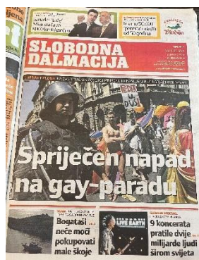
Slika 11. Slobodna Dalmacija, 8. srpnja 2007. godine