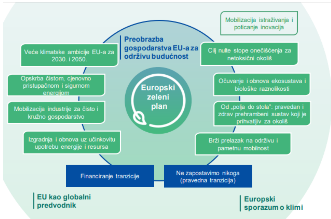
Slika 2. Ciljevi Europskog zelenog plana (COM/2019/640 final).