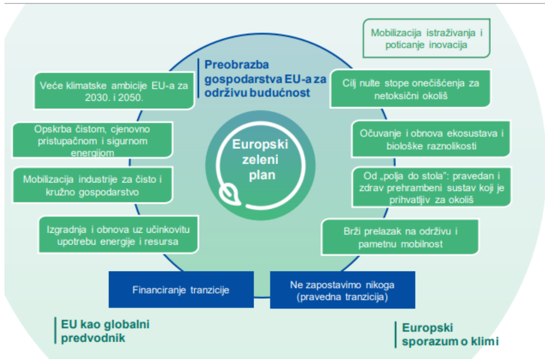
Slika 2. Ciljevi Europskog zelenog plana (COM/2019/640 final).