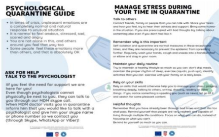
Slika 6 - Prikaz letka izradenog u sklopu projekta „SP – Prevencija bolesti, promidžba i zaštita zdravlja, psihološka podrška, pristup i pomoć u zdravstvenoj skrbi za tražitelje međunarodne zaštite“