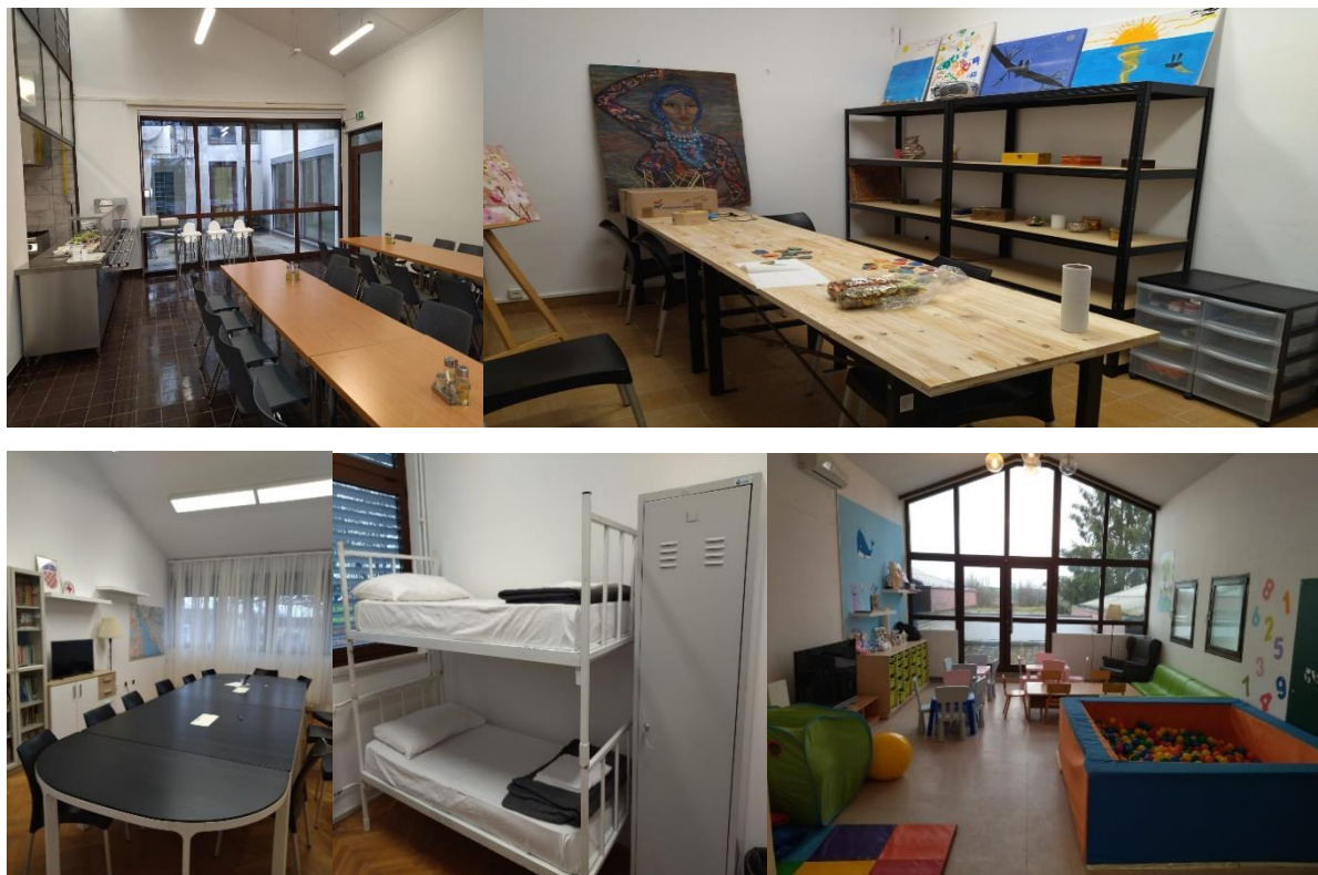
Fotografija 2. Prihvatište u Kutini

Taj je objekt otvorio novu percepciju sustava i stvorio mogućnost njegova razvoja.