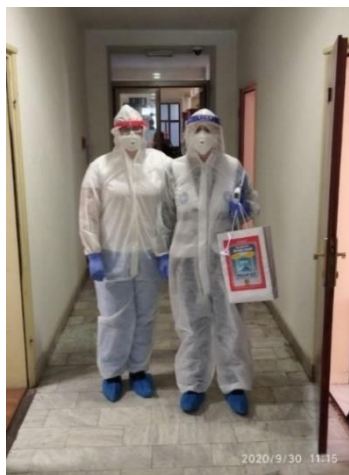
Fotografija 3: Priprema za karantenu Tablica 4. Prikaz statistike vezane uz COVID-19

Osim toga, bilo je nužno, kroz koordinaciju s liječnikom, organizirati prihvata novih tražitelja i njihov pravovremeni otpust nakon karantene.