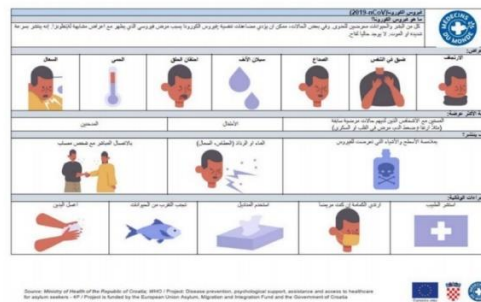
Slika 5 - Prikaz letka izradenog u sklopu projekta „Prevencija bolesti, psihološka podrška, pristup i pomoć u zdravstvenoj skrbi za tražitelje međunarodne zaštite – 4P“

Osim toga, bilo je nužno, kroz koordinaciju s liječnikom, organizirati prihvata novih tražitelja i njihov pravovremeni otpust nakon karantene.