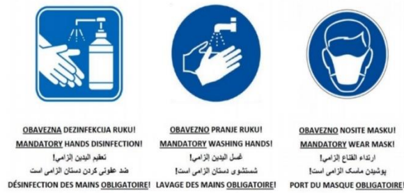
Slika 3 - Prikaz oznaka i uputa za poštivanje epidemioloških mjera