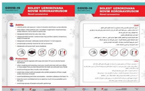
Slika 4 - Prikaz letaka u svrhu informiranja tražitelja međunarodne zaštite u prihvatilištima o bolesti uzrokovanoj COVID-19