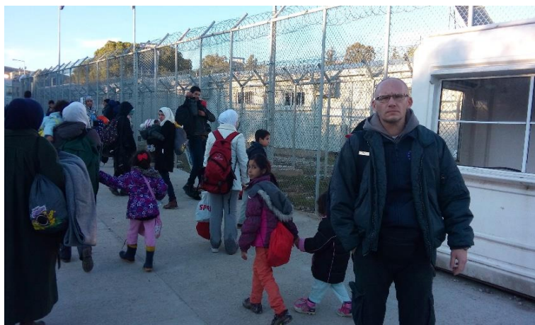
Fotografija 1: Otok Lesbos u Grčkoj, Kamp Moria, siječanj 2016.

Postupci na granici i sigurne treće zemlje za povratak osoba koje neće imati uvjete za ulazak u EU još su teme oko kojih se pregovara. Čak ni moguće usvajanje odredbi neće olakšati situaciju niti dovoljno ubrzati postupke. Sustavi na vanjskim granicama EU pod snažnim su pritiskom, a zbog sekundarnih migracija tražitelja države u unutrašnjosti EU pod velikim su smještajnim opterećenjem. Kako bi se to spriječilo predlaže se uvođenje restriktivnih postupaka na granici, a o ozbiljnoj namjeri svjedoče osigurana rekordna novčana sredstva u EU fondovima s ciljem izgradnje i jačanja infrastrukture na vanjskim granicama EU, jačanju kapaciteta, opreme i ljudstva. Ponovno se postavlja i pitanje odnosa između odgovornosti i solidarnosti među državama, bez jasnih i jednoznačnih kriterija, pa je izazova više od ponuđenih rješenja.