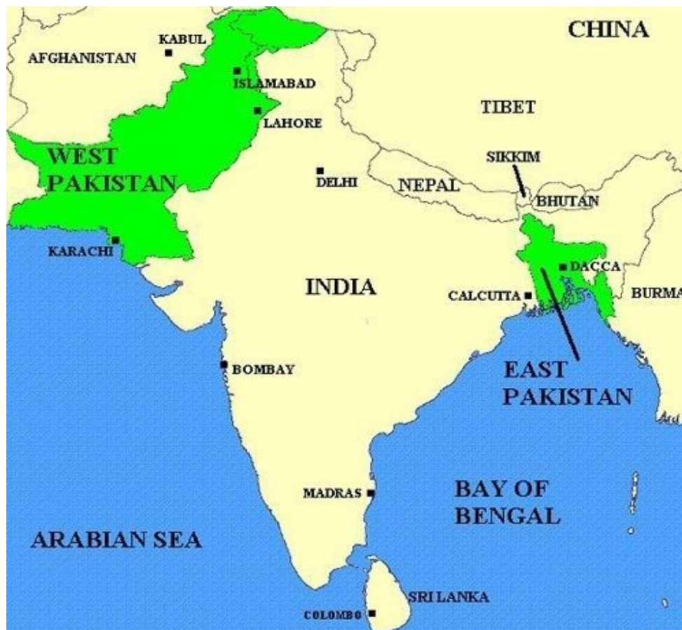
Slika 3. Zapadni i Istočni Pakistan (Šćepanović, 2017)

Raspadom Britanske Indije te stjecanjem neovisnosti 1947., Pakistan se dijelio na istočni i zapadni (vidi Slika 3.). Pakistan je tada brojao oko 130 milijuna ljudi, od kojih je čak 75 milijuna živjelo u Istočnom Pakistanu. U Istočnom Pakistanu većina stanovništva govorila je bengalski jezik te bila bengalske narodnosti. Iako se njime uglavnom služilo stanovništvo Zapadnog Pakistana, pakistanska vlada pokušala je nametnuti Urdu kao jedini službeni jezik u cijelom Pakistanu. Dakako, Bengalci su vodili konstantnu borbu za ravnopravnost bengalskog jezika. Također, gospodarska neuravnoteženost bila je poprilično naglašena, gdje je Istočni Pakistan bio izvozno jača regija države, ali većina prihoda je odlazilo u Zapadni Pakistan. Stalna eksploatacija dobara, pokušaj nametanja jezika, ali i dominacija zapadno-pakistanskih kadrova u vodećim vojnim i političkim strukturama vlasti doveli su do jačanja pokreta i želje za odcjepljenjem Istočnog Pakistana (Škrabalo, 1997).