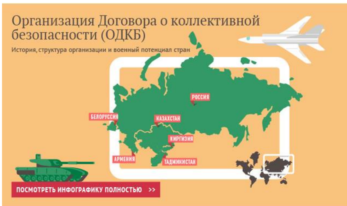
Slika 2: Države članice Organizacije Sporazuma o kolektivnoj sigurnosti (ODKB)

odnosu na europski model integracija pa, ako uspoređujemo NATO i ODKB, dolazimo do sličnog zaključka. Na čelu ODKB-a također se nalazi glavni tajnik, postoji Parlamentarna skupština s godišnjim rotirajućim predsjedništvom, dok se Sporazumom o kolektivnoj sigurnosti određuju obveze država potpisnica o nepristupanju drugim vojnim savezima i pristanku svih članica u slučaju da treća zemlja želi otvoriti vojnu bazu u nekoj od članica. Također postoji i članak 4. koji obrazlaže da napad na jednu članicu ujedno predstavlja čin agresije na cijeli savez te su države članice 2009. osnovale Zajedničke snage za brzo djelovanje (Karimov, 2021)