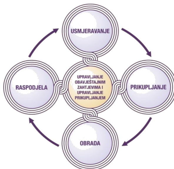
Slika 1 Obavještajni ciklus (ZDP-20, 2013: 30)

U fazi prikupljanja obavještajni senzori prikupljaju podatke i informacije koje će se pretočiti u krajnji obavještajni proizvod. Može se reći kako je faza prikupljanja ključni, ali ujedno i najkompliciraniji proces koji je usmjeren na prikupljanje podataka bili oni u realnom vremenu ili su se već dogodili. (Korać, 2010: 79-97) Proces prikupljanja također obuhvaća upravljanje aktivnostima poput razvoja smjernica prikupljanja koji će osigurati optimalno korištenje resursa, a na temelju identificiranih obavještajnih zahtjeva za informacijama senzori će dobiti posebne zadatke za prikupljanje informacija.