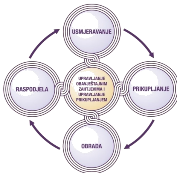
Slika 1 Obavještajni ciklus (ZDP-20, 2013: 30)

U fazi prikupljanja obavještajni senzori prikupljaju podatke i informacije koje će se pretočiti u krajnji obavještajni proizvod. Može se reći kako je faza prikupljanja ključni, ali ujedno i najkompliciraniji proces koji je usmjeren na prikupljanje podataka bili oni u realnom vremenu ili su se već dogodili. (Korać, 2010: 79-97) Proces prikupljanja također obuhvaća upravljanje aktivnostima poput razvoja smjernica prikupljanja koji će osigurati optimalno korištenje resursa, a na temelju identificiranih obavještajnih zahtjeva za informacijama senzori će dobiti posebne zadatke za prikupljanje informacija.