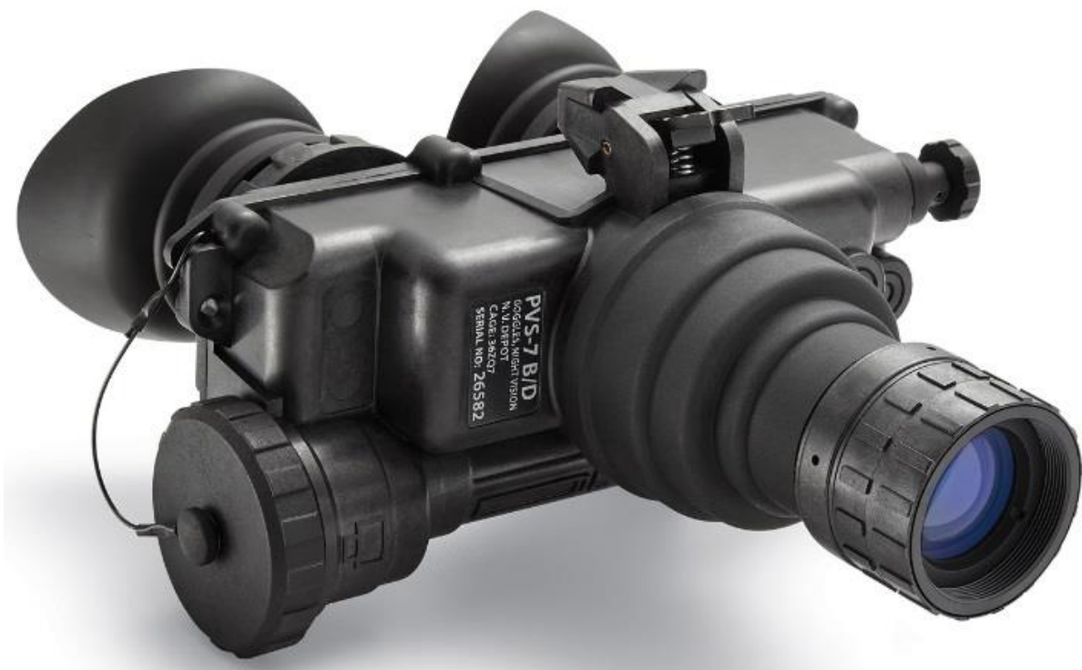
Slika 6. AN/PVS-7

AN/PVS-7 su naočale za noćno gledanje (u daljnjem tekstu: naočale) tipa monokular razvijen u Sjedinjenim Američkim Državama. On je bio standardna oprema za vojnike SAD-a tijekom različitih vojnih sukoba, uključujući operacije u Iraku i Afganistanu, ali i isto tako tijekom operacija u Somaliji. AN/PVS-7 pruža korisniku sposobnost da vidi u uvjetima slabog osvjetljenja, koristeći se prirodnim svjetlom poput mjesečine ili zvijezda, kao i infracrvenim osvjetljenjem.