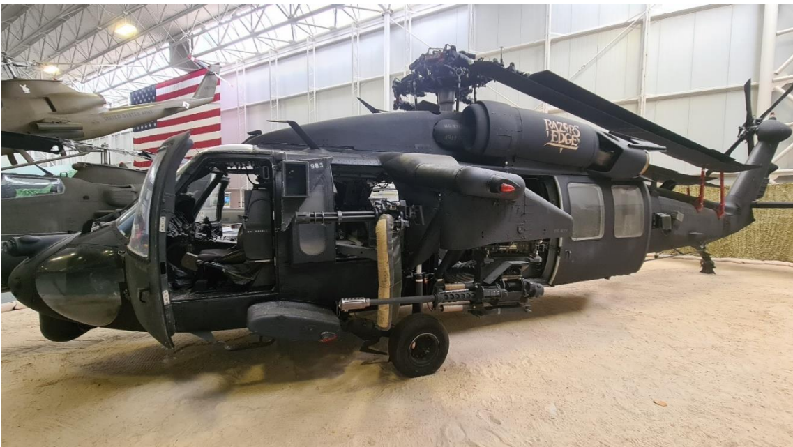
Slika 3. “Super 68” RAZOR’S EDGE - SN. 90-26288