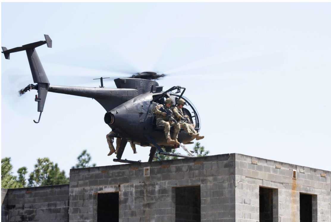
Slika 5. MH-6 Little bird

Naoružanje i oprema - iako primarno dizajniran za prijevoz vojnika, MH-6 može biti opremljen s raznim vrstama naoružanja za samozaštitu ili podršku tijekom specijalnih operacija.