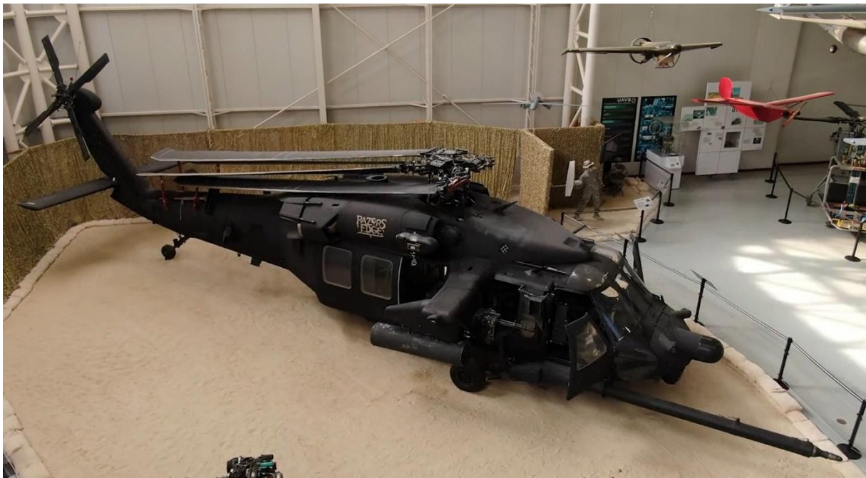
Slika 4. “Super 68” RAZOR’S EDGE - SN. 90-26288