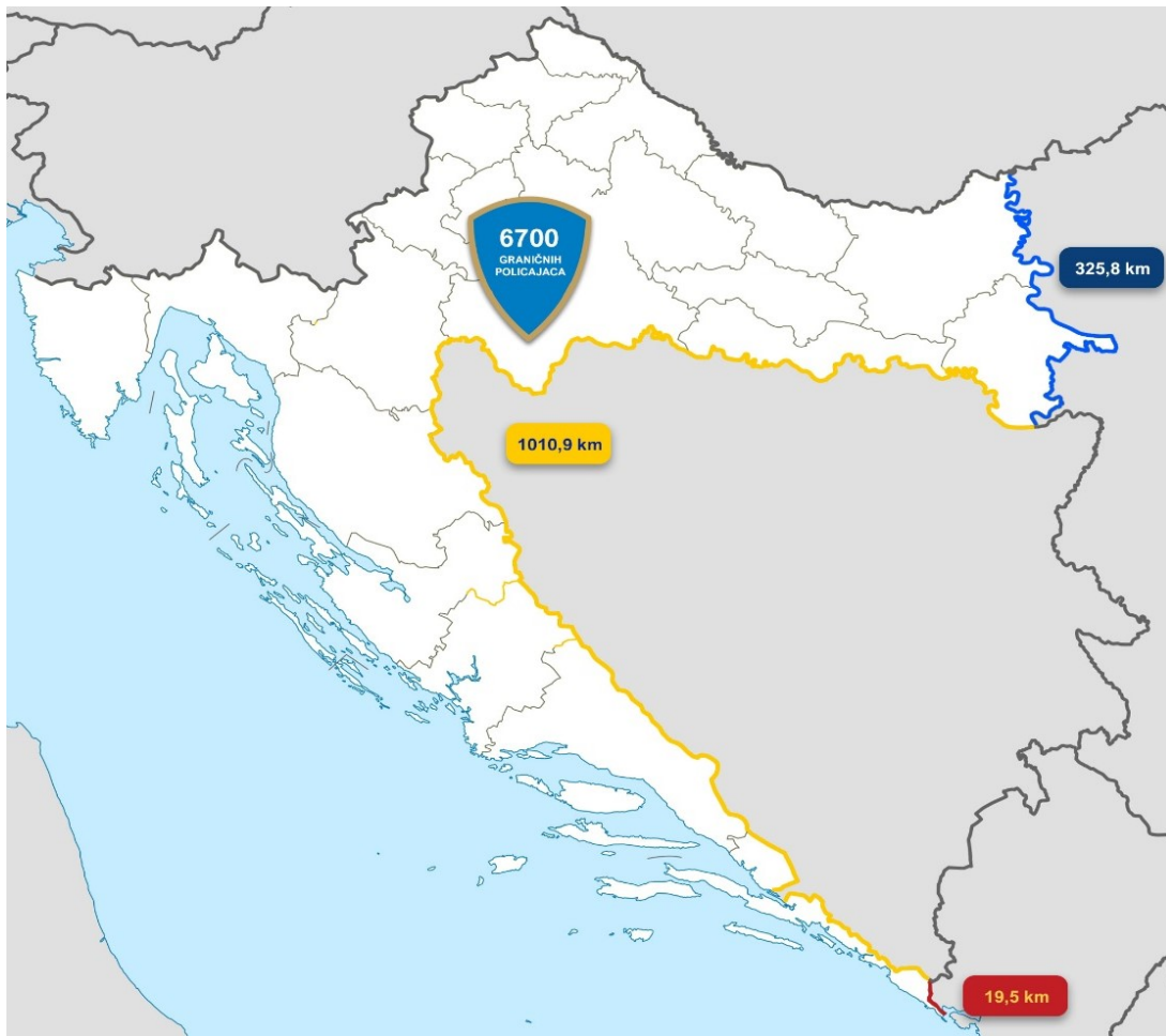
Slika 2. Vanjske granice Republike Hrvatske i broj granične policije