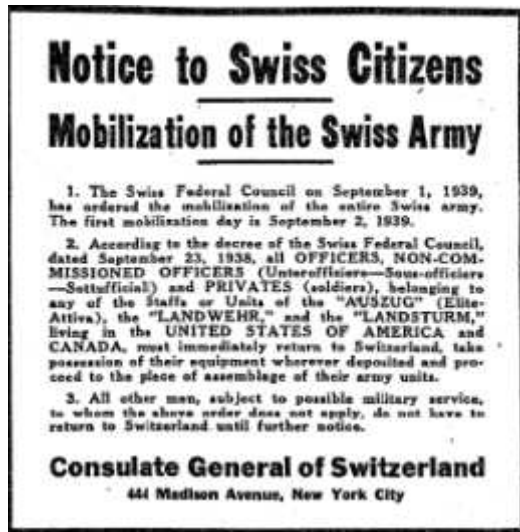
Slika 2. Poziv švicarskim državljanima na mobilizaciju u švicarsku vojsku