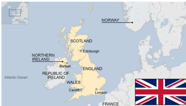
Slika 3. Politički zemljovid Republike Irske i Sjeverne Irske u odnosu na susjedne zemlje i UK