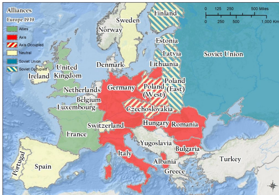
Slika 1. Politički zemljovid Europe na početku Drugog svjetskog rata