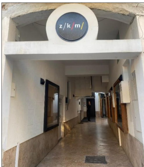
Slika 6. Današnje Zagrebačko kazalište mladih