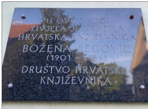
Slika 10: Spomen ploča na kući B. Begović