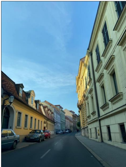
Slika 8. Jurjevska ulica