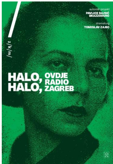
Slika 10. Plakat za predstavu 2022. godine

„Tko sam ja? Onaj, što bolno stenje u tamnim sobama, nemirno luta po gradskom asfaltu, što se vječno buni i bori, kida i lomi u sumnji i prkosu, što stisnuta srca želi bunu i boj?“ (pjesma Tko sam?, 1929.)