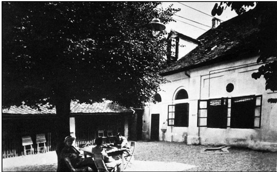
Slika 4. Prvi Radio Zagreb na adresi Markov trg 9

Stalni pritisak okoline i teški radni uvjeti na radijskoj stanici gdje je obavljala više poslova istovremeno značajno pogoršavaju Boženino zdravstveno stanje. Zbog kontinuiranog stresa na poslu razvija kroničnu bolest želuca što je prisiljava da napusti mjesto radijske spikerice. Ulogu prepušta kolegi, spikeru Hrvoju Macanoviću, vjerujući da će on uspjeti nastaviti tamo gdje je ona stala.