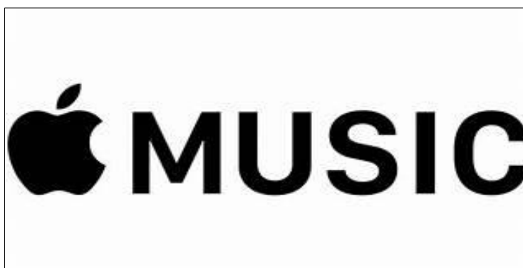
Slika 5: Logotip Apple music servisa