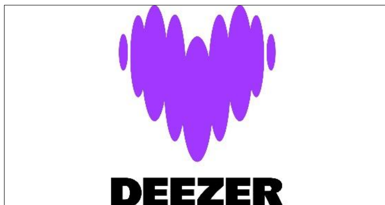
Slika 1: Logotip Deezer-a