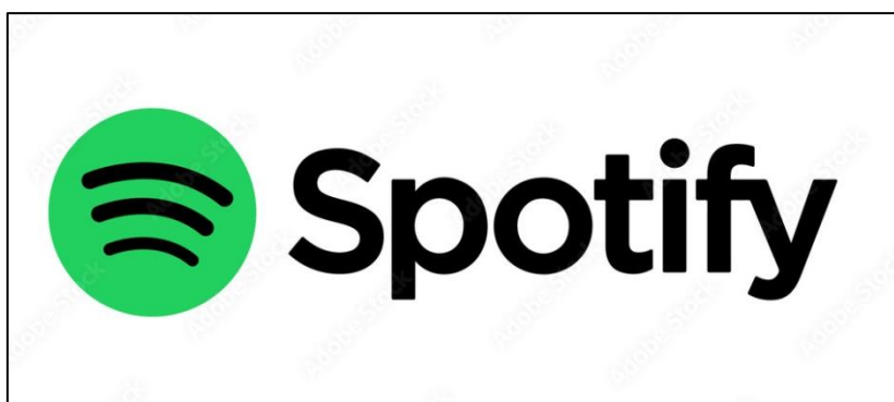
Slika 4: Logotip Spotify servisa