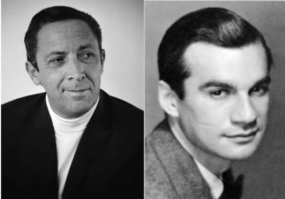
Slika 1.: Tvorci Batmana, Bob Kane i Bill Finger