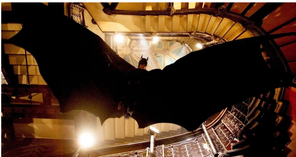
Slika 4.: Batman u letu