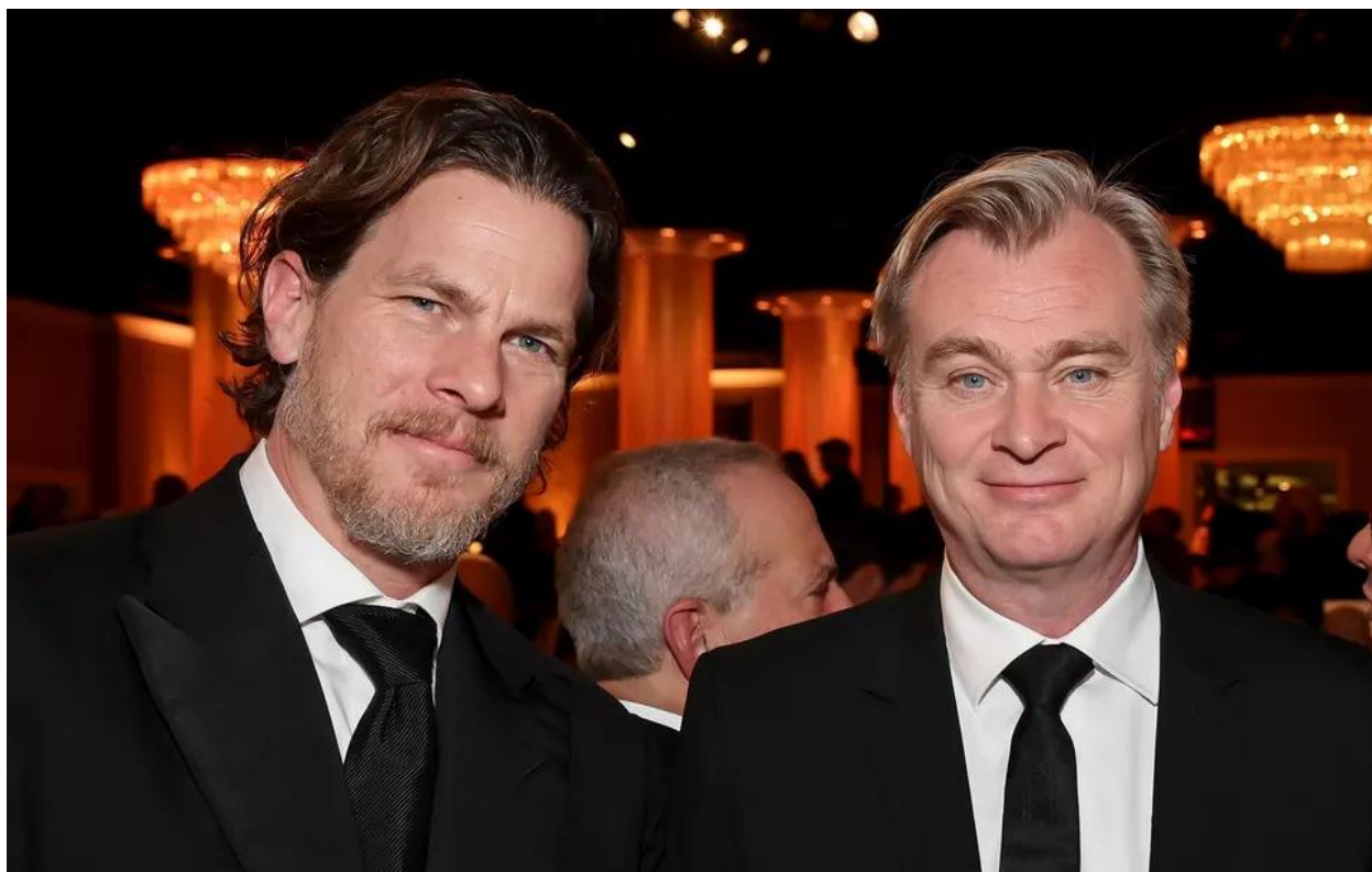
Slika 20.: Braća Jonathan i Christopher Nolan