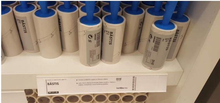
Slika 4b-imenovanje proizvoda