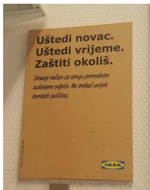
Slika 3- ekološki savjeti