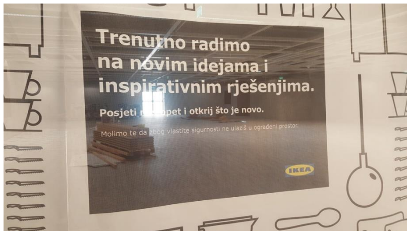
Slika 1- neformalno obraćanje kupcima