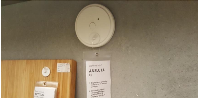
Slika 4a- imenovanje proizvoda