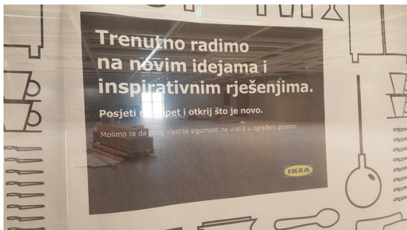
Slika 1- neformalno obraćanje kupcima