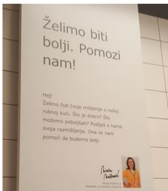
Slika 2- korištenje riječi "Hej"