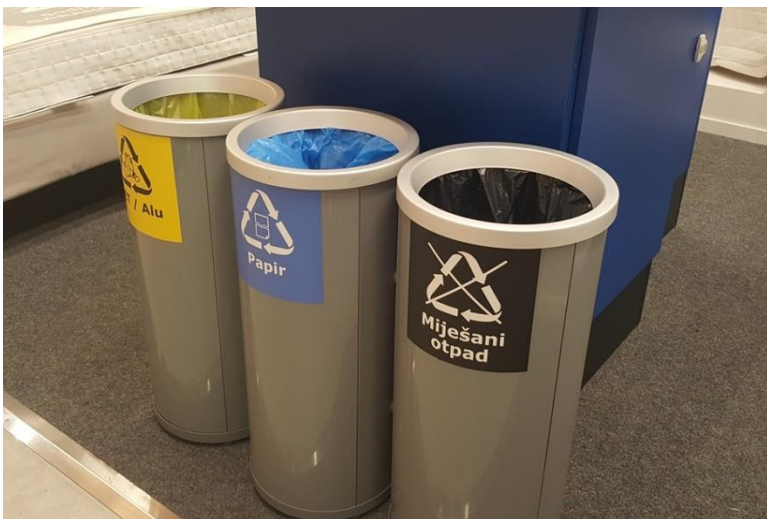
Slika 5- koševi za razvrstavanje otpada