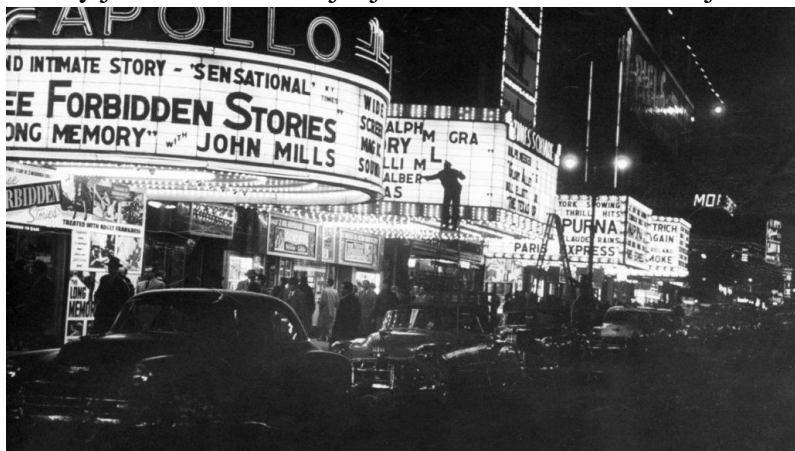
Slika 3 Broadway

„Počevši sa The Red Millom , brodvejske predstave su instalirale eklektične znakove izvan kazališta. S obzirom da su obojene žarulje gorjele prebrzo, koristili su bijela svijetla što je Broadwayu priskrbilo nadimak The