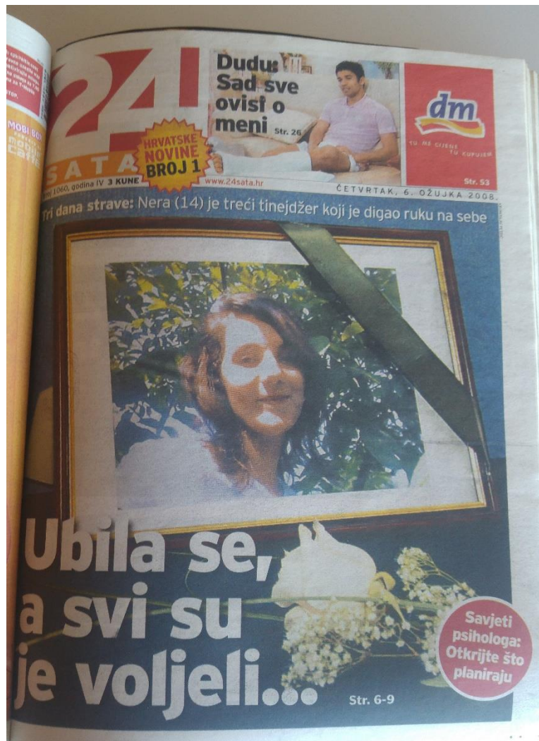
Fotografija 1. Naslovnica 24 sata (06.03.2008.) koja na senzacionalistički način prikazuje smrt maloljetnice, prikazujući i fotografiju njezinog lica, pri čemu njezin identitet nije zaštićen