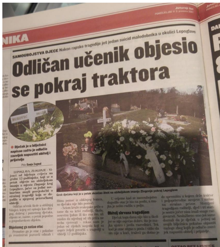
Fotografija 3. Tekst iz JL (03.12.2007.) u sklopu kojeg je fotografija groba žrtve s jasno istaknutim imenom i prezimenom