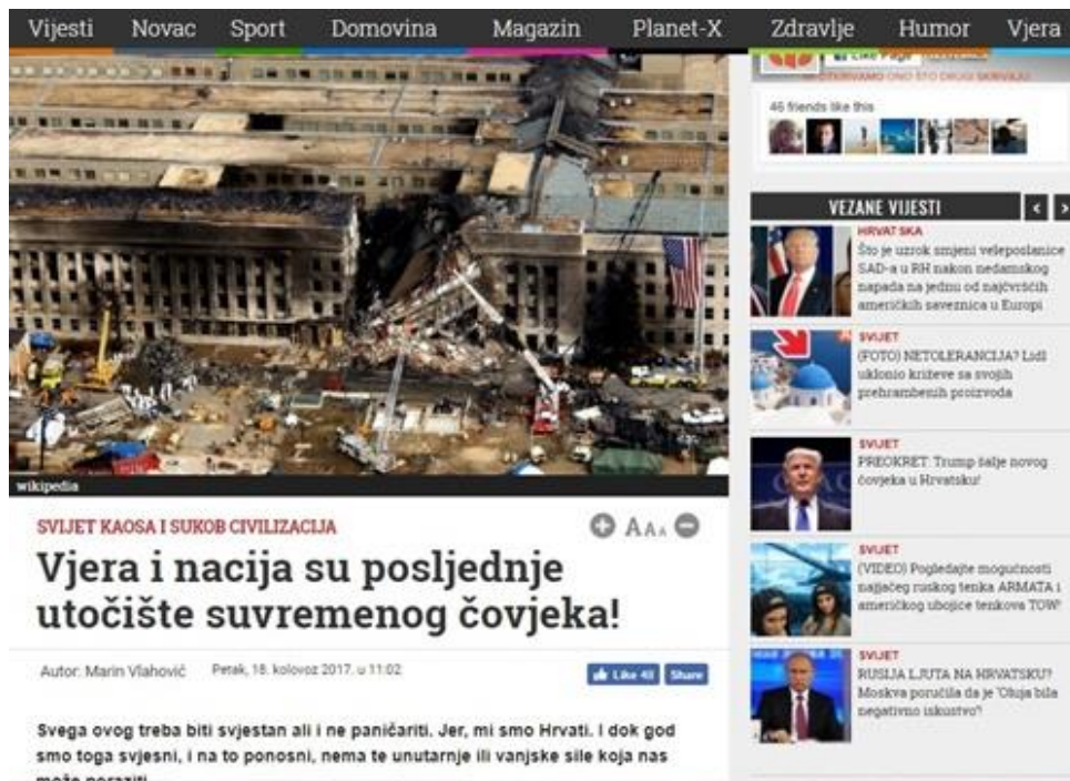
Slika 13: Vjera i nacija su posljednje utočište suvremenog čovjeka!

Veličanje vjere i domoljublja nije ono što je problematično ili sporno u ovom tekstu, već ranije upotrebljeni naziv „parazit“ (v. Slika 6 ) „Visok postotak vjernika, snažna uloga Crkve i jaka te glasna domoljubna Hrvatska koja je stasala i izgradila se na temeljima domovinskog i oslobodilačkog rata. To su jedina prava jamstva našeg opstanka. Ipak, ono što nas treba zabrinuti jest prodor parazita i socijalističkog taloga u sve strukture države.“, autor socijaldemokrate i očito sve koji nisu zagovornici istih životnih načela kao on, naziva „parazitima“ i upozorava čitatelje da ih „protivnici žele poraziti“ (v. Slika 13 )