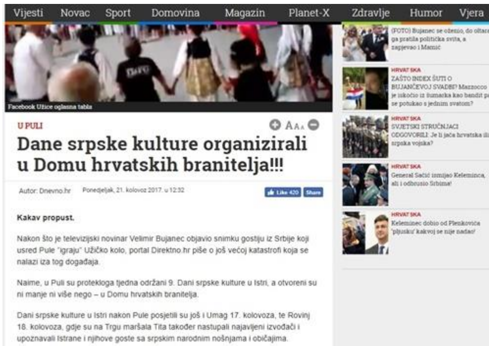
Slika 12: Dani srpske kulture

Ovaj netolerantni tekst pod naslovom „Dane srpske kulture organizirali u Domu hrvatskih branitelja!!!“, počinje riječima „Kakav propust.“. Naglašavanjem interpunkcijskih znakova na kraju naslova, Dnevno.hr aludira na skandaloznu vijest, a početkom teksta izjašnjava svoj stav prema srpskoj nacionalnoj manjini nazivajući Dane srpske kulture u Istri „katastrofom“. Srpska nacionalna manjina, kao uostalom i sve druge manjine imaju pravo na održavanje svojih tradicija i događaja određene Ustavnim zakonom o pravima nacionalnih manjina: „Republika Hrvatska osigurava ostvarivanje posebnih prava i sloboda pripadnika nacionalnih manjina koja oni uživaju pojedinačno ili zajedno s drugim osobama koje pripadaju istoj nacionalnoj manjini, a kada je to određeno ovim Ustavnim zakonom ili posebnim zakonom, zajedno s pripadnicima drugih nacionalnih manjina, naročito: 1. Služenje svojim jezikom i pismom, privatno i u javnoj upotrebi, te u službenoj upotrebi; 2. Odgoj i obrazovanje na jeziku i pismu s kojim se služe; 3. Uporabu svojih znamenja i simbola; 4. Kulturna autonomija održavanje, razvojem i iskazivanjem vlastite kulture, te očivanja i zaštite