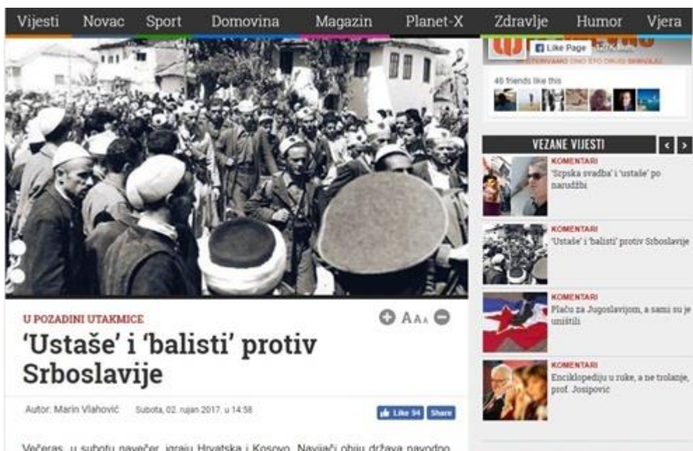
Slika 4: „Ustaše“ i „balisti“ protiv Srboslavije

Ako uzmemo u obzir kontekst i da se iza nogometne utakmice između Hrvatske i Kosova u ovom slučaju uzeo i povijesni i politički kontekst obje države, naslov je itekako diskriminacijski. Autor u tekstu navodi povijesne situacije spominjajući projekt „Velike Srbije“ kao „višestoljetni zločinački projekt“. Također, navodi: „Kad nas vide na terenu oni koji nisu prestali sanjati Veliku Srbiju, mogu samo komentirati, gle ustaše i balisti. Da, „ustaše“ i „balisti“ igrali su protiv „Srboslavije“ a kako je ta tekma završila, ne trebamo valjda ponavljati...“, aludirajući na rat, borbu, mržnju i ubijanje.