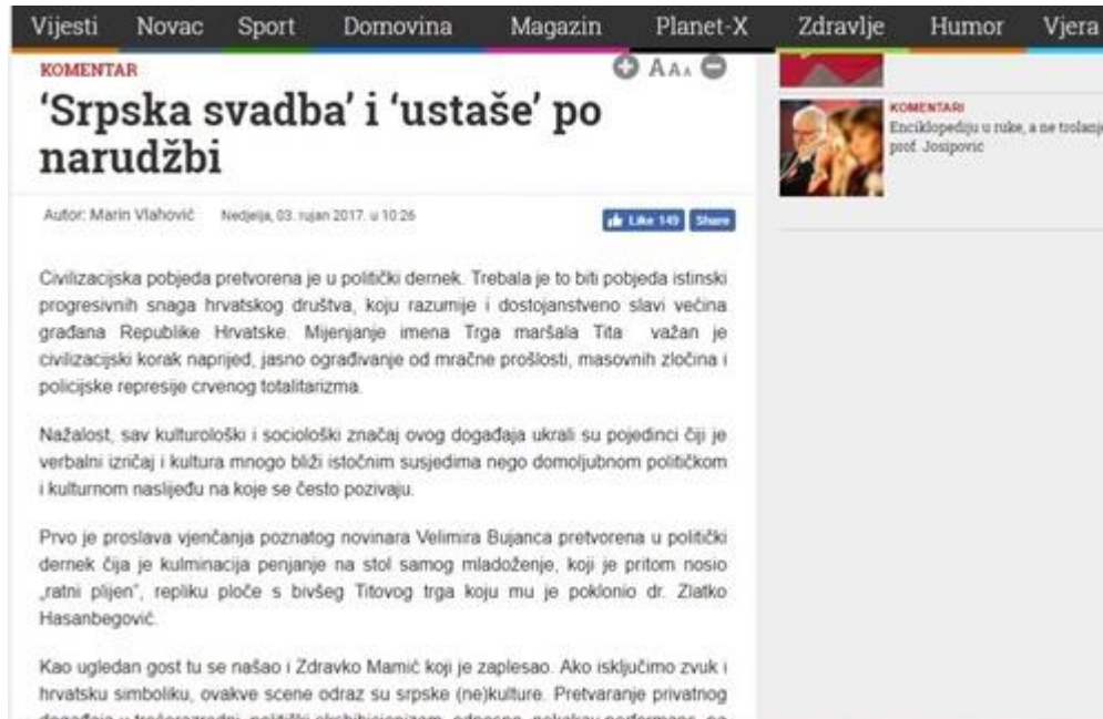
Slika 1: „Srpska svadba“ i „ustaše“ po narudžbi

Već sam naslov ovog komentara i kontekst u kojem je upotrebljen izraz „srpska svadba“ i „ustaše“ aludira na diskriminaciju. Trenutno aktualno mijenjanje ulične ploče Trga maršala Tita glavna je tema većine tekstova zadnjih nekoliko dana na portalu Dnevno.hr. Komentar da je taj potez „civilizacijski korak naprijed“ i „ograđivanje od policijske represije crvenog totalitarizma“ jasan je primjer netolerantnog govora davajući pritom aluziju da je društvo do sada bilo necivilizirano jer je imalo naziv trga po predsjedniku nekadašnje Jugoslavije. U nastavku teksta, autor navodi kako su scene slavlja i plesa svadbe, „ako isključimo zvuk i hrvatsku simboliku, odraz srpske (ne)kulture“, zapravo divljaštvo navodi kao karakteristiku srpske (ne)kulture. Iako bi u komentaru, kao novinarskom žanru, trebalo analitički objasniti tezu iza koje autor stoji, u ovom slučaju su samo nabrojane