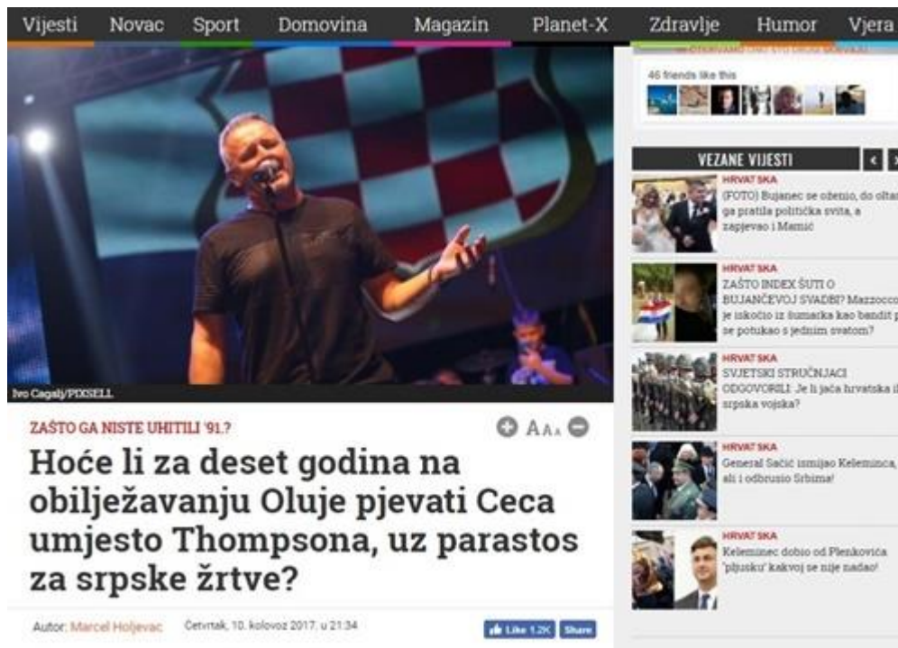
Slika 15: Zašto ga niste uhitili '91.?

Autor u svom komentaru na portalu Dnevno.hr, pod naslovom „Hoće li za deset godina na obilježavanju Oluje pjevati Ceca umjesto Thompsona, uz parastos za srpske žrtve?“, piše o Thompsonovom koncertu nakon kojeg se traže jesu li posjetitelji koncerta upotrebljavali ustaški poklič „Za dom spremni!“. Navodi kako „Dakle pjesma, koja je u ratu smetala četnicima, hrabrila Hrvate, danas smeta... pa, samo četnicima. Samo se sada prozvaše „antifašistima“, po istoj logici po kojoj su 1944. od četnika isto tako preko noći postali antifašisti- partizani.“, nazivajući pritom antifašiste- četnicima.