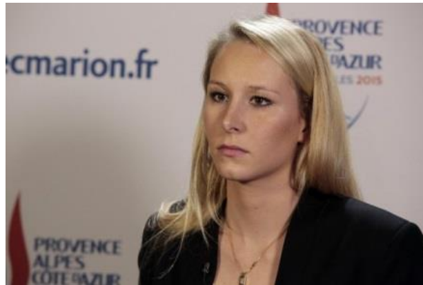
Slika 4. Marion Jeanne Caroline Maréchal-Le Pen