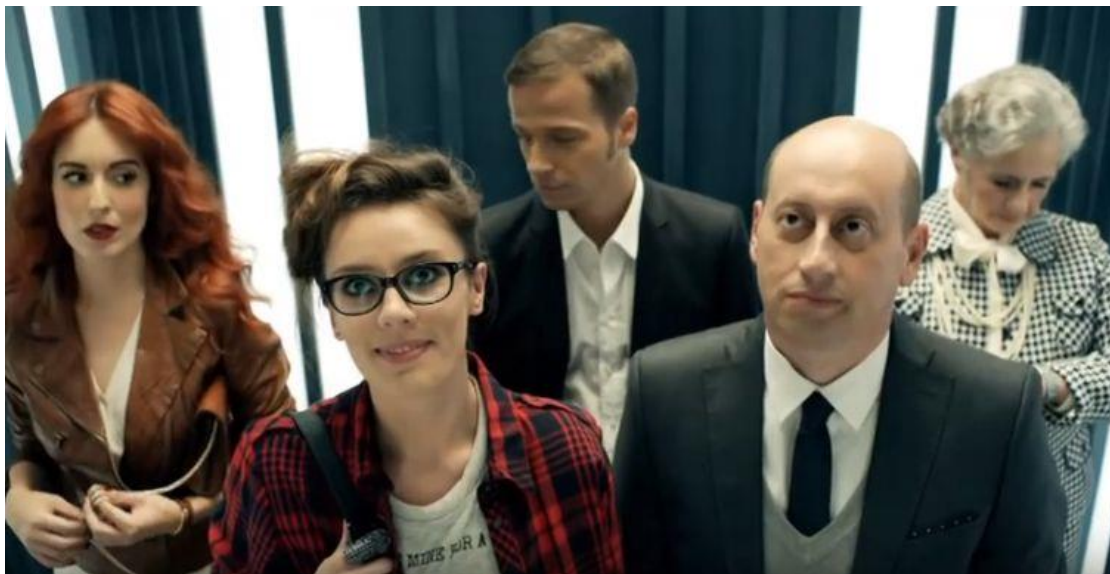
Slika 3: Prikaz oglasa bez obraćanja u kameru