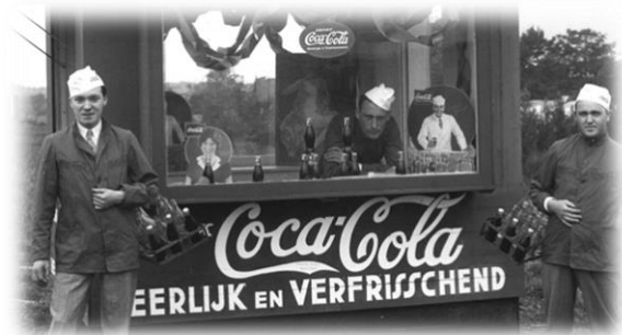
Slika 6: Kiosk u Amsterdamu 1928. godine

Pozitivne strane ovakve vrste promocije vlastitog poduzeća i proizvoda uspješno je iskoristila Coca-Cola. Davne 1928. godine Kompanija je prvi put sponzorirala Olimpijske igre u Amsterdamu. Ovaj događaj imao je veliki značaj za tvrtku jer je prvi put predstavila svoj proizvod Nizozemskim potrošačima. Danas je poznato da Coca-Cola predstavlja