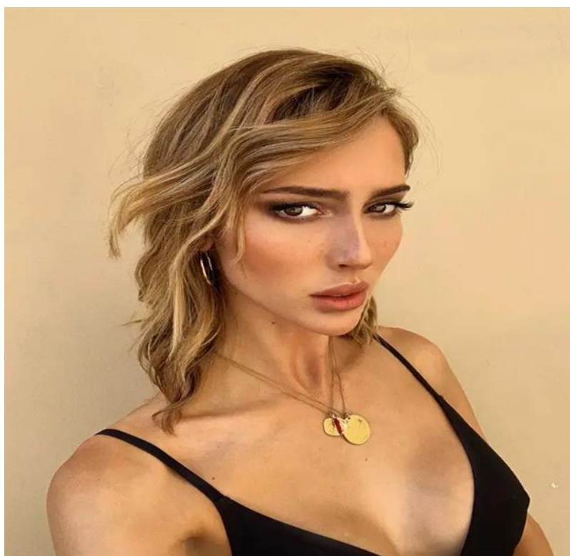
Slika 3. Transrodni model Teddy Quinlivan