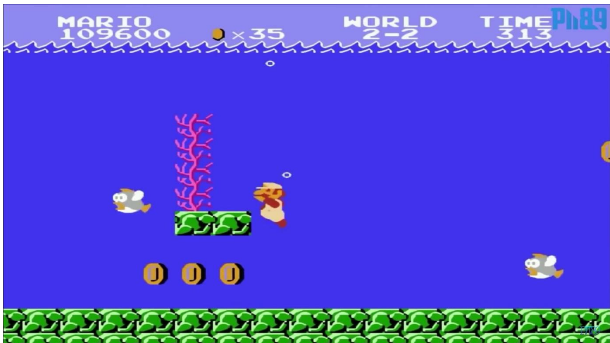
Fotografija 2. isječak iz videoigrice Super Mario Bors, primjer 2D grafike (Pii89, 2014).