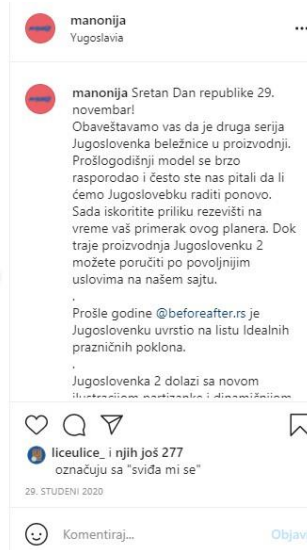
Slika 4.: Manonija - Jugoslovenka