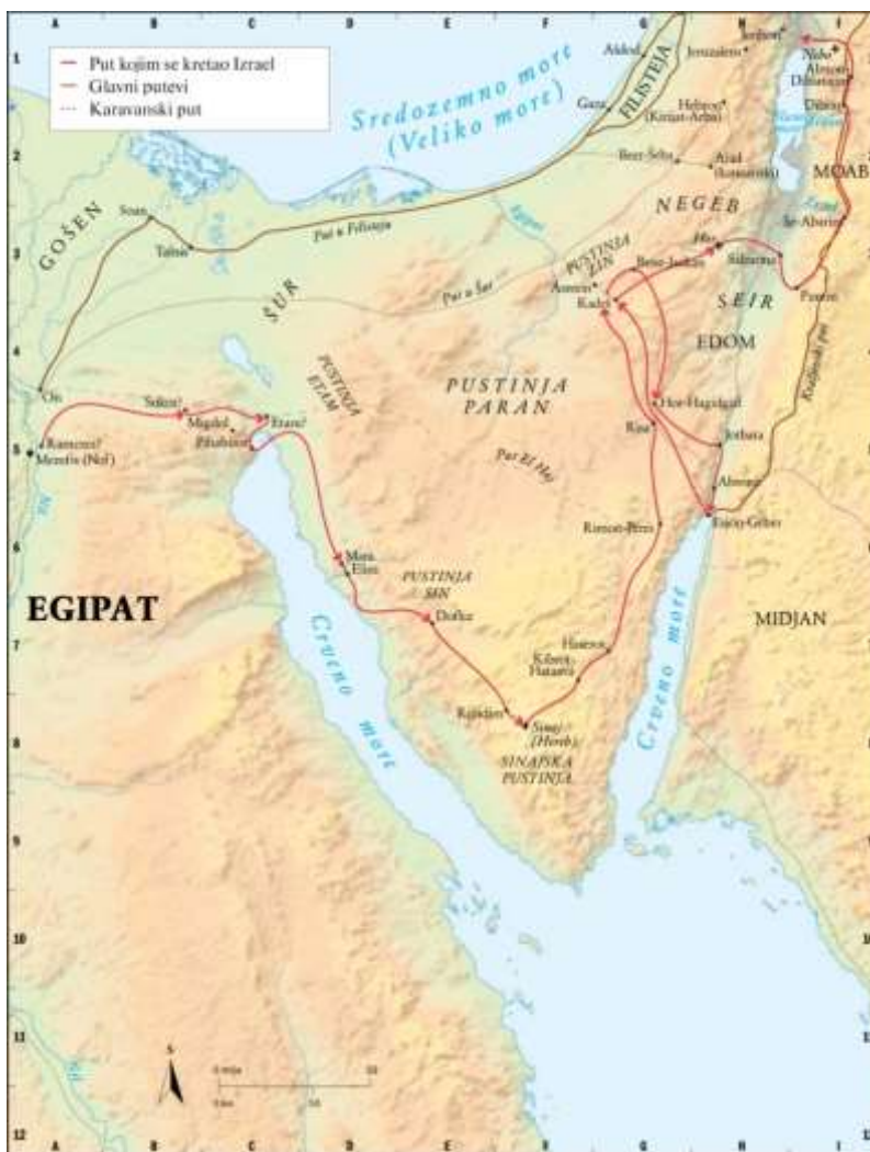
Slika 1. Izlazak Židova iz egipatskog ropstva