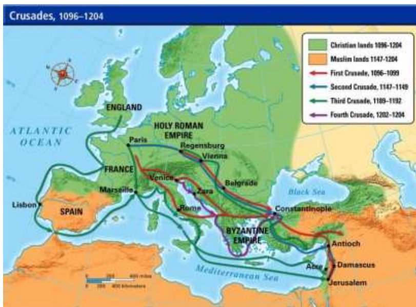
Slika 2. Pregled križarskih ratova