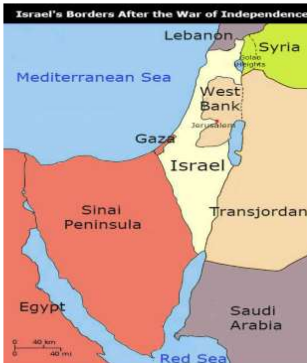
Slika 5. Granice Izraela nakon rata za neovisnost