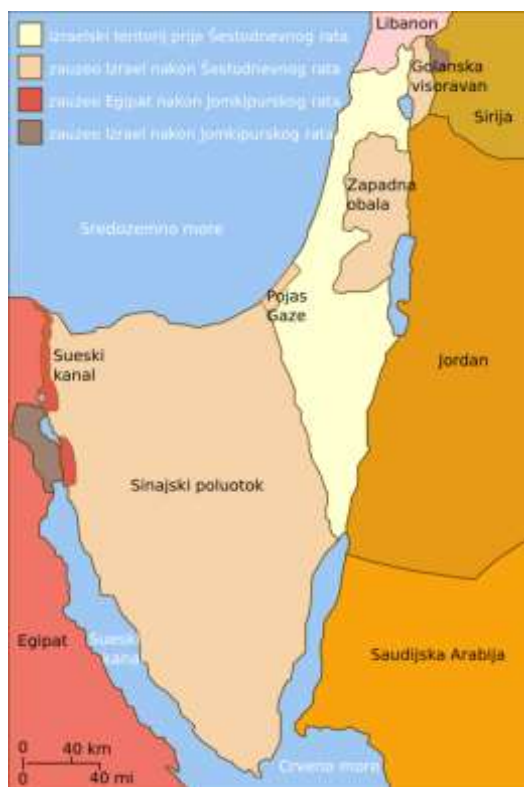
Slika 7. Pregled osvojenih područja Izraela i Egipta nakon Jomkipurskog rata