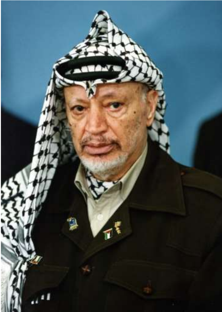
Slika 9. Portret Jasera Arafata