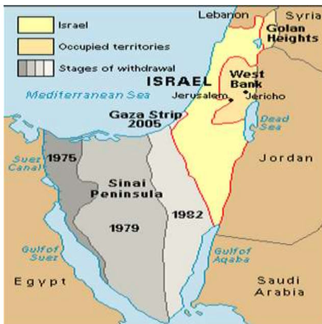
Slika 8. Prikaz povlačenja Izraelske vojske po fazama nakon Camp Davida 1979. godine