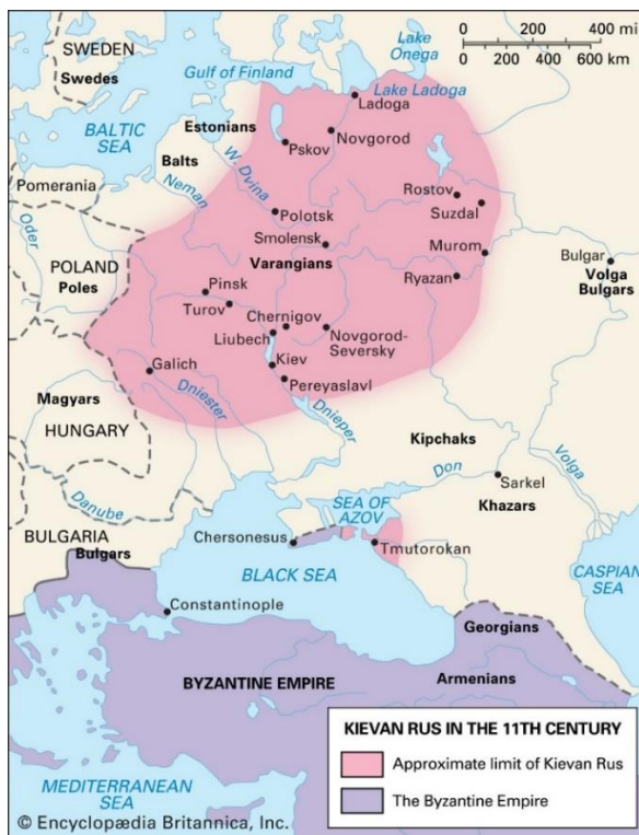
Slika 1: Teritorij Kijevske Rusi u 11. stoljeću

Povezanost Rusije i Ukrajine seže unatrag do srednjovjekovne Kijevske Rusi koja je bila prvi politički entitet na teritoriju Istočnih Slavena (Keppeler, 2014: 112). Kijevska Rus' je doživjela svoj vrhunac početkom i sredinom 11. stoljeća (Britannica.com, 2022a). Na Slici 1 može se vidjeti upravo teritorij Kijevske Rusi u 11. stoljeću. Ona se prostirala istovremeno na teritoriju suvremene Ukrajine i Ruske Federacije.