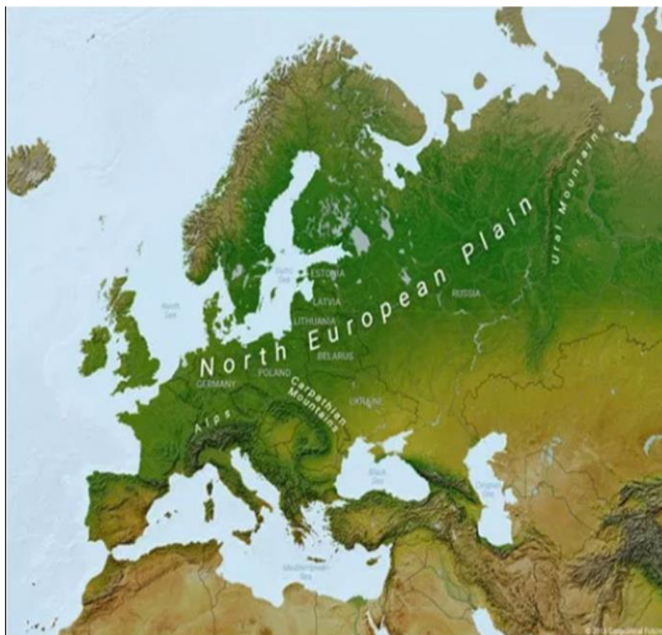
Slika 5: Prikaz Sjevernoeuropske nizine na karti