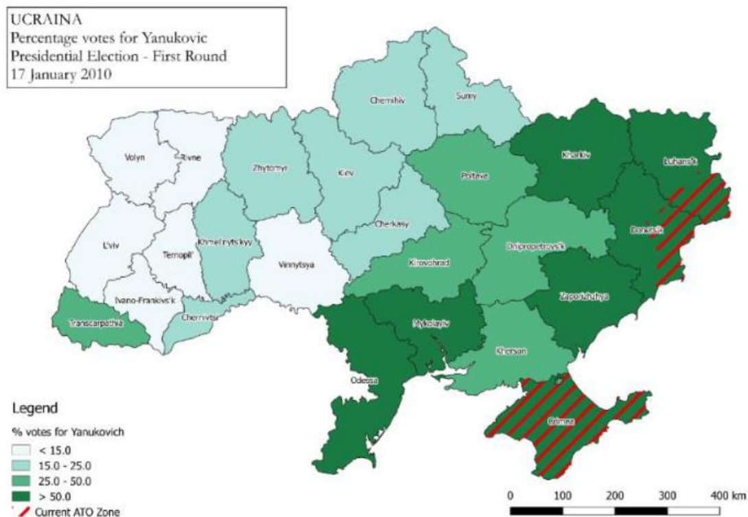
Slika 3: Postotak glasova za Janukoviča u prvom krugu predsjedničkih izbora 2010.