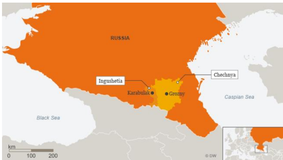
Slika 2. Geografska karta Čečenije

Izvor: https://www.dw.com/en/protests-in-ingushetia-alarm-moscow/a-45870230 Pristupljeno 18. kolovoza 2022. godine