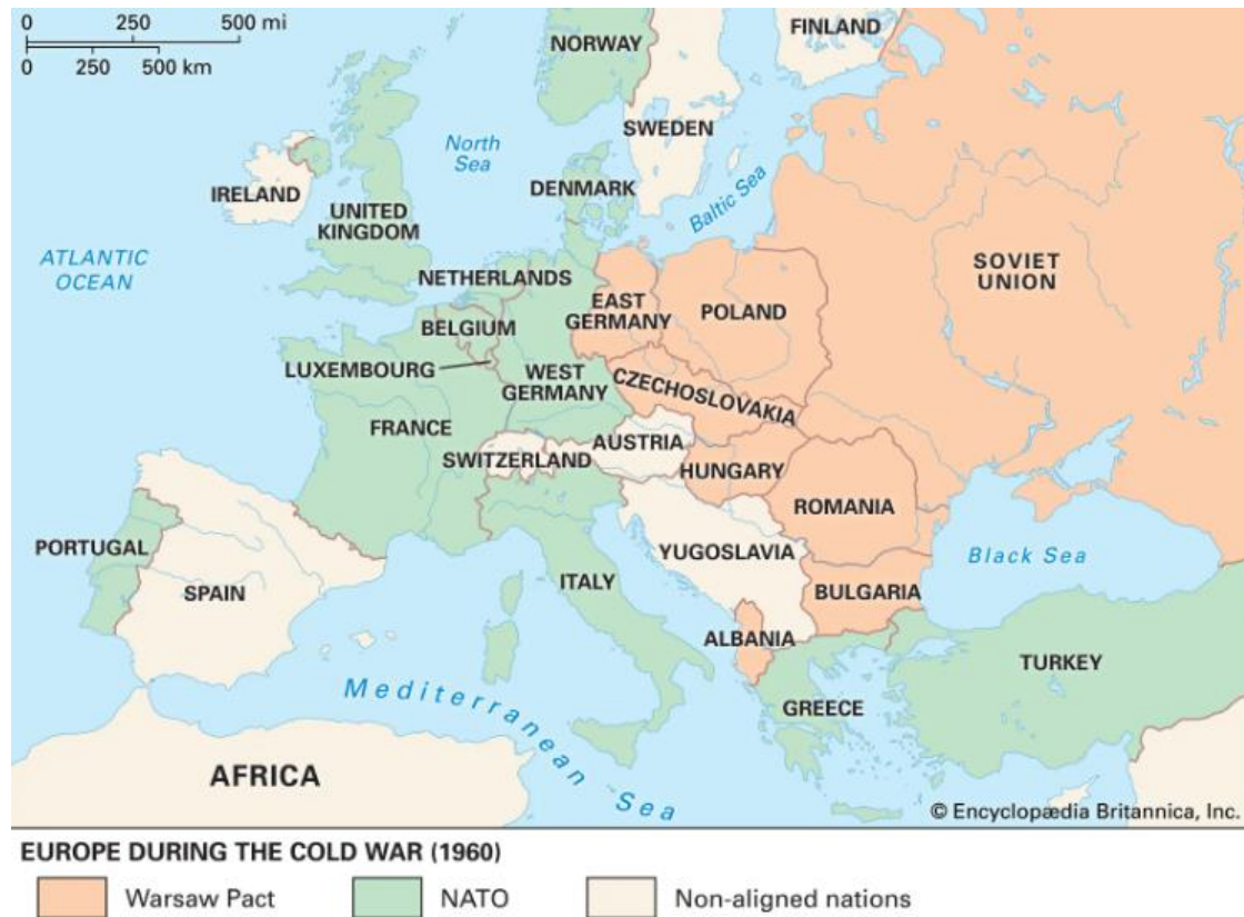
Slika 1. Karta svijeta s podjelom na članice NATO saveza i Varšavskog pakta 1960. godine