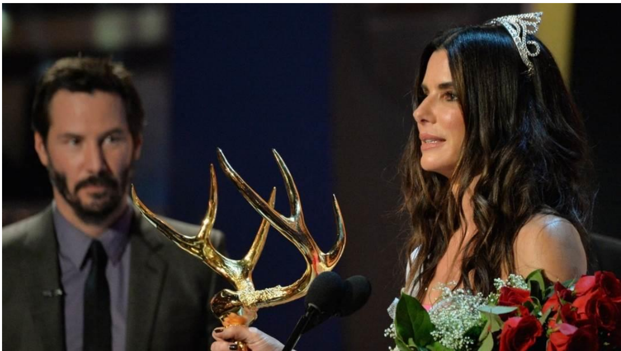
Slika 6: Glumac Keanu Reeves gleda glumicu Sandru Bullock

U drugim slučajevima mogu se vidjeti fotografije na kojima se žena gleda u doslovnom smislu. Primjer je Slika 6 s glumicom Sandrom Bullock na pozornici koja ne gleda u objektiv, a s drugog kraja se vidi glumčev pogled usmjeren prema njoj. Istovremeno se čini da se ona gleda s dvije strane, s jedne je glumac na fotografiji, a s druge je čitatelj članka, odnosno onaj koji promatra fotografiju.