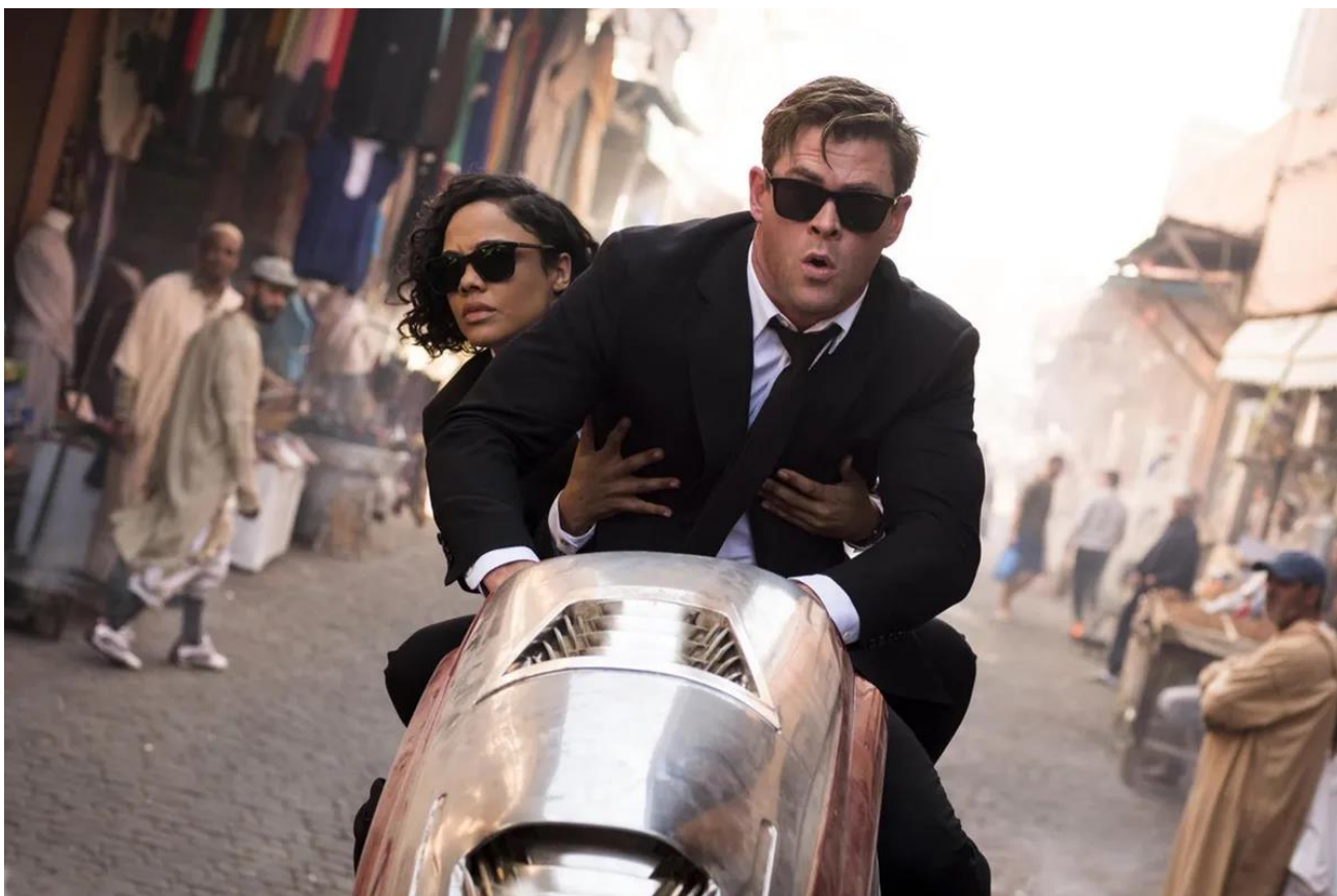
Slika 8: Muškarac i žena na motoru