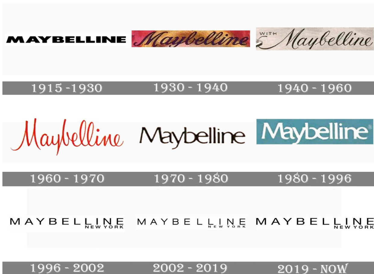
Slika 5: Razvoj logotipa brenda Maybelline