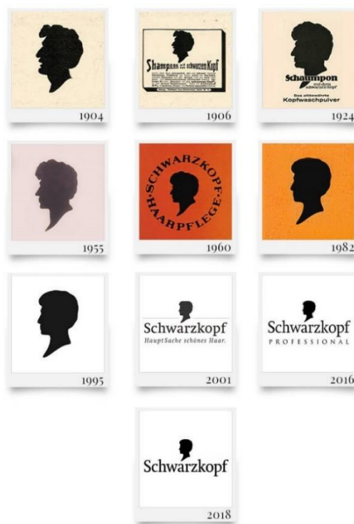
Slika 3: Razvoj logotipa brenda Schwarzkopf