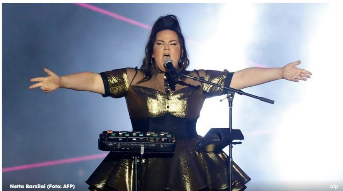
Slika 11: Primjer ironije

Piše I.M., 18.05.2019 @ 13:13 ♦ CELEBRITY