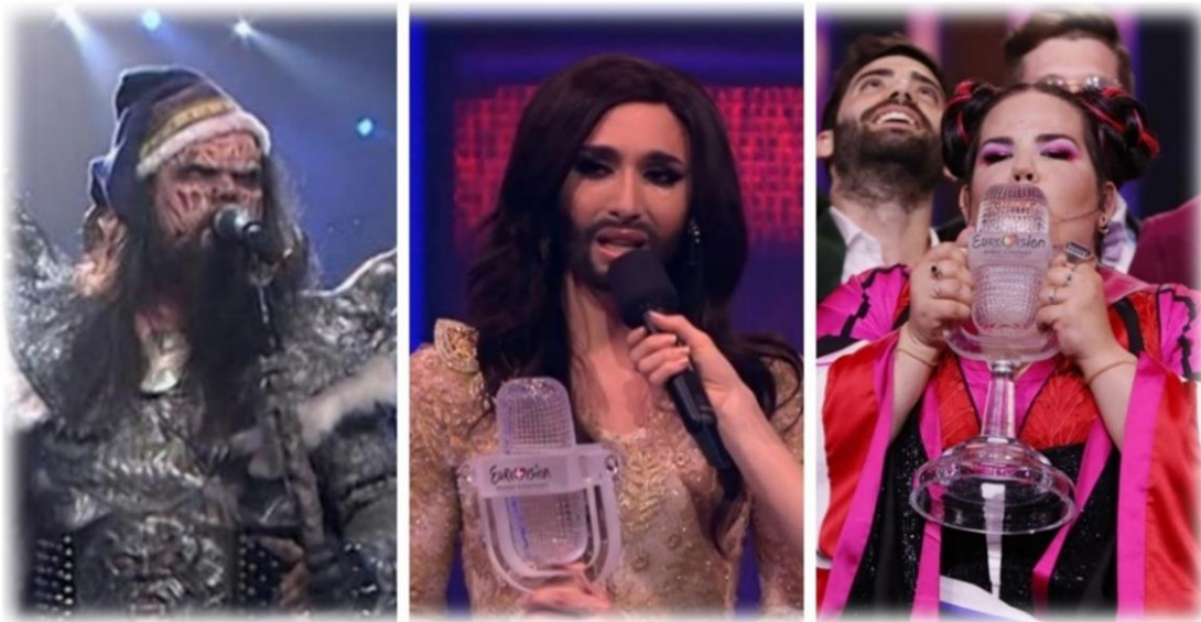
Slika 1: Pobjednici Eurosonga 2006., 2014. i 2018. godine

Hrvatska je na Eurosongu debitirala kao samostalna država 1993. godine, a do 2023., u periodu od točno 30 godina, natjecala se ukupno 28 puta. Osim 2020. godine kada je Eurosong otkazan zbog pandemije, Hrvatska također nije sudjelovala na Eurosongu 2014. i 2015. godine, kada se dobrovoljno povukla iz natjecanja. Hrvatska je najbolje rezultate na Eurosongu ostvarila u prvih nekoliko godina participacije, točnije 1996. i 1999., kada su pjesme Sveta ljubav Maje Blagdan i Marija Magdalena Doris Dragović uspjele zauzeti četvrta mjesta u poretku. Dolaskom novijih vremena, uspješnost Hrvatske na natjecanju opada. Posljednji top 10 rezultat u finalu za Hrvatsku ostvarila je Vanna 2001. godine s pjesmom Strings Of My Heart . Najrecentniji hrvatski predstavnici na Eurosongu, Let 3, uspjeli su se plasirati u finale s pjesmom Mama ŠČ! i tamo zauzeti 13. mjesto. Prije njih, posljednji plasman u finale ostvario je Jacques Houdek 2017. godine s pjesmom My Friend . U periodu od 2018. do 2022., izuzev pandemijske 2020. godine, Hrvatska nijednom nije uspjela ući u veliku završnicu natjecanja (eurovision.tv, 2023).