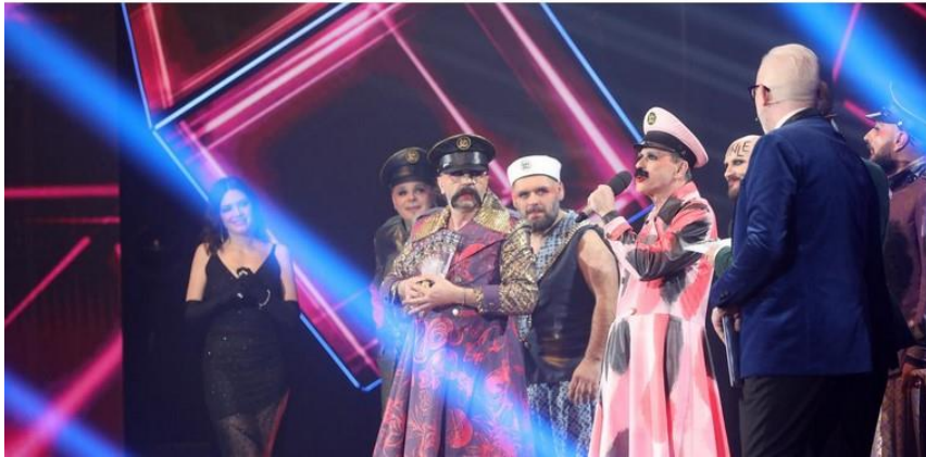
Slika 8: Primjer akronima