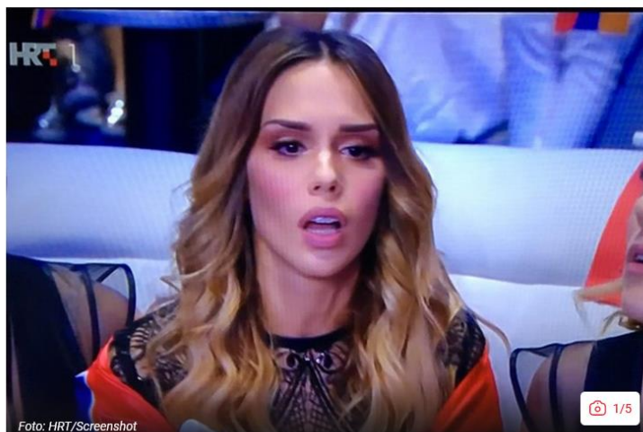
Slika 7: Primjer frazema (večernji.hr)

Poslovicom „važno je sudjelovati“ u ovom se konkretnom primjeru željelo naglasiti da Hrvatska radiotelevizija, koja je zadužena za izbor hrvatskog predstavnika na Eurosongu, ne vidi problem u ispadanju predstavnice Franke Batelić u polufinalu Eurosonga 2018. godine, prilikom čega je ostvarila najgori rezultat u povijesti natjecanja Hrvatske 3 . U primjeru ovog naslova vidimo i upotrebu frazema „oprali ruke“, koji je iskorišten kako bi se naglasilo da HRT ne želi preuzeti odgovornost za neuspjeh hrvatske predstavnice. Prema Ponu i suradnicima, frazemi su lingvističke jedinice „koje se ne stvaraju u govornome procesu nego se reproduciraju u gotovu obliku, a značenje im se obično ne izvodi iz značenja njihovih dijelova“ (Pon i dr, 2006: 154). Odnosno, radi se o skupini riječi koje zajedno daju novo značenje i upućuju na misao nevezanu uz njihovu jezičnu formu. Gojević također u svom radu navodi da „publicistički stil često upućuje na frazem“ (Gojević, 2009: 27). Analizom je ovo potvrđeno, budući da je uočena višestruka upotreba frazema u hrvatskim medijima tijekom izvještavanja o Eurosongu.