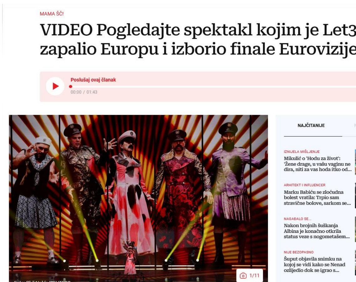
Slika 10: Primjer ratne metafore

Ovo su još neki od primjera ratnih metafora: