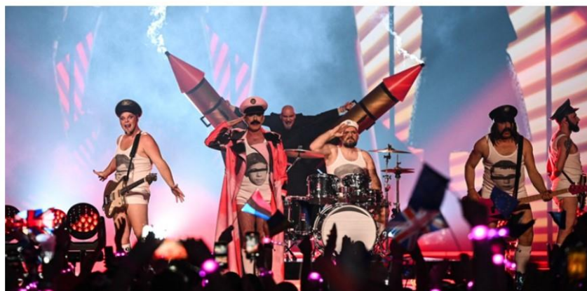
Slika 12: Primjer rodne ideologije