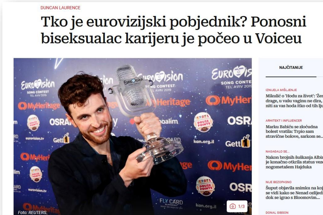
Slika 9: Primjer epiteta