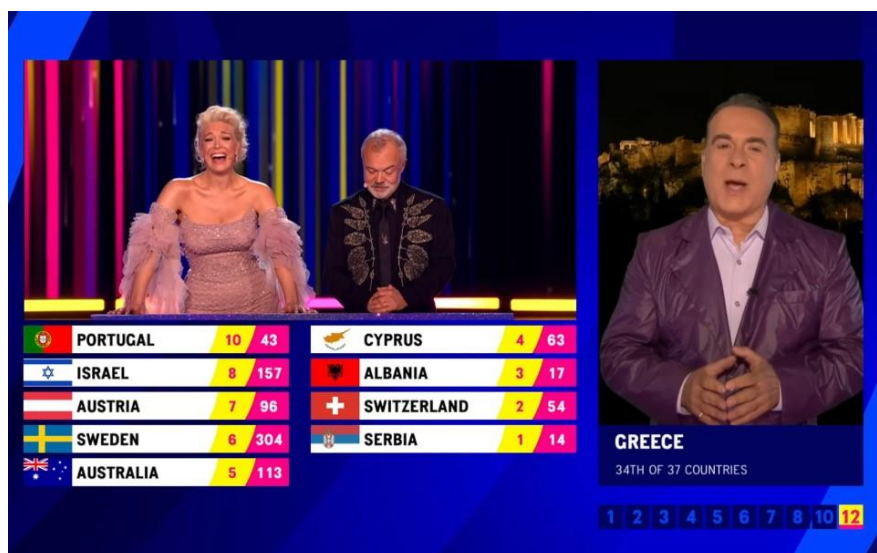
Slika 5: Glasanje na Eurosongu 2023. godine (EBU)

Sličan uzorak razmjene bodova vidljiv je i među državama bivše Jugoslavije. Primjerice, u 2022. godini i Hrvatska i Crna Gora Srbiji su u finalu dale maksimalna 24 boda. Sjeverna Makedonija također je 2021. godine dala Srbiji maksimalne moguće bodove.