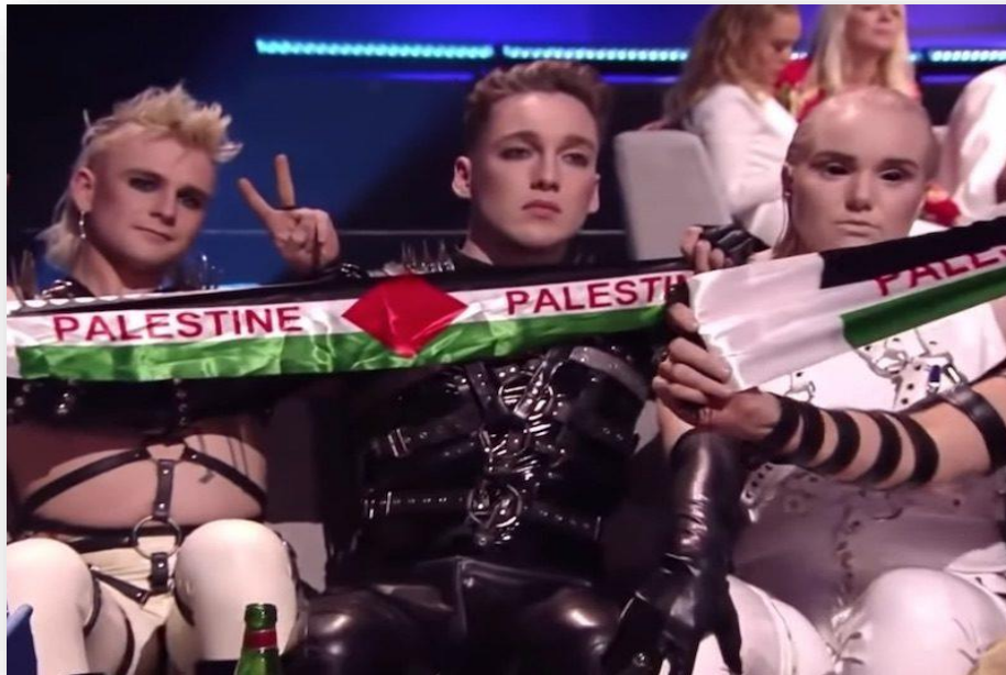
Slika 3: Hatari s palestinskom zastavom

Palestincima u ratu. EBU je islandsku nacionalnu televiziju te godine zbog poteza njihovih predstavnika novčano kaznio (eurosong.hr, 2019).