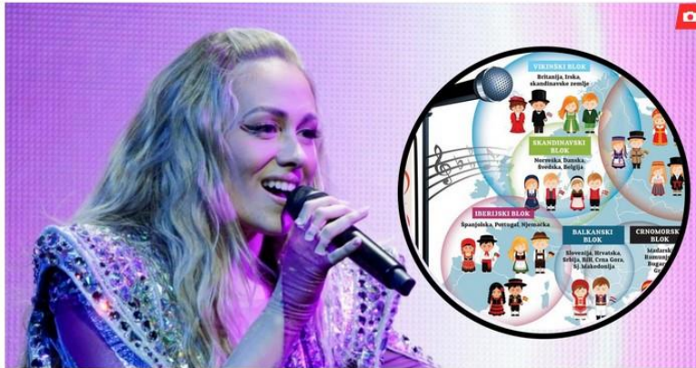
Albina, infografika matematike Eurosonga