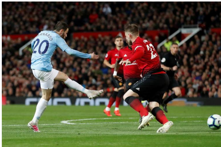
Slika 1: Večernji.hr

Prvi primjer (Večernji.hr, 21.3.2020.) ima afirmativan naslov kao uvod u članak pozitivnog tona. Riječ donirali ukazuje na filantropiju i humanitarnu akciju. Kao glavna poruka iščitava se zajedništvo, budući da se radi o rivalima na terenu koji postaju suradnici u teškim vremenima. Iako je u tekstu naglasak na klubovima kao organizacijama, odmah ispod naslova smještena je velika fotografija igrača kao zaštitnih lica klubova. Slika koja se može vidjeti iznad ovog teksta portretira igrače Cityja i Uniteda za vrijeme nogometne utakmice, iz čega proizlazi kako je riječ o aktivnoj fotografiji. Sama fotografija čini članak upečatljivijim za prosječnog čitatelja, a korištenje igrača kao njihovih uzora dodatno pojačava taj osjećaj.