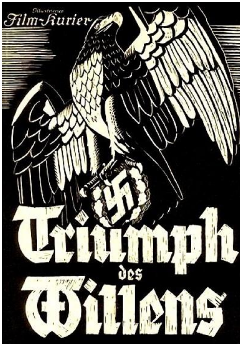
Slika 2. Plakat "Trijumfa volje"

Mjesto radnje su tri lokacije: ulica, dvorana i otvoren prostor (tabor, livada, stadion), a glavnu ulogu imaju tri aktera: narod, stranka i vođa. Hitler je bio glavnu glumac u filmu. Onaj kojemu se dive, koji predvodi mase, onaj kojeg slušaju s ushitom i predanošću.