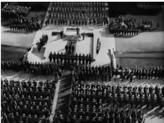
Slika 11. Scena u kojoj je naglašena geometrijski, pravilan raspored vojnika, nalik na mravinjak.

U filmu je naznačena uloga njemačkog naroda u cijelom sustavu, a to je da uvijek bude pratitelj. To se ostvaruje agresivnim kadriranjem na sudionike parade (a i istovremeno svojevrsnog rituala) koji hodaju ravno prema kameri zajedno s pogledom iz ptičje perspektive koji gleda prema dolje na organizirane mase. Na kraju krajeva, u „Trijumfu volje“ ne radi se o volji, kako Sontag primjećuje, već o „trijumfu moći“ (Tomasulo, 2014). Dugi, pravilno raspoređeni, marširajući redovi vojnika podsjećaju na koloniju mrava. To može upućivati na rigidnu geometrijsku konfiguraciju i usklađenost ljudskih umova i tijela, čineći tako kolektivno tijelo.