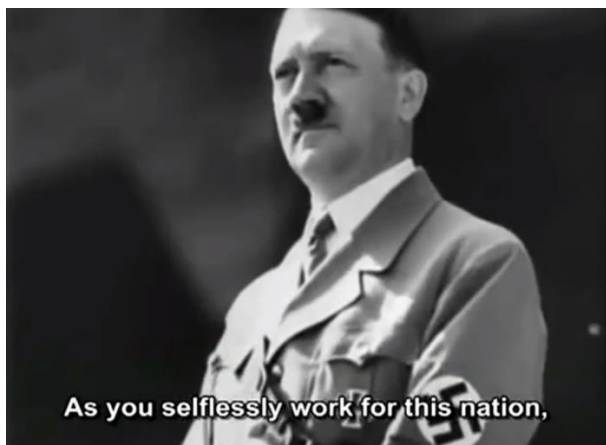
Slika 6. Prikaz Hitlera iz niskog kuta čime se iskazuje njegova nadmoćnost i nadređenost

Ponovno, time se pokazuje nadređenost Hitlera, a podređenost mase. Osim toga, Hitler je ovdje primatelj podrške koja dolazi iz ozarene publike. Poruka je jasna, Hitlerova podrška dolazi iz naroda. Hitlerovo putovanje u hotel ispratila je lančana reakcija ovacije publike. Uz to što je prikazan središnji, glavni lik u filmu, pažljivi izbor rasvjete i svjetla pridodaju gotovo religioznu auru Hitlerovom liku. Scene u kojima se pojavljuju odredi SA kojem je Hitler oduzeo moć samo dva mjesecima ranije, oduševljeno pozdravljajući svog novog vođu, Viktora Lutze - nasljednika ubijenog Röhma. Istinski spontani entuzijazam koji je ovdje vidljiv prilično je različit od većine ostalih scena u filmu. To nije bio trijumf volje, već trijumf preživljavanja (Rother, 2003).