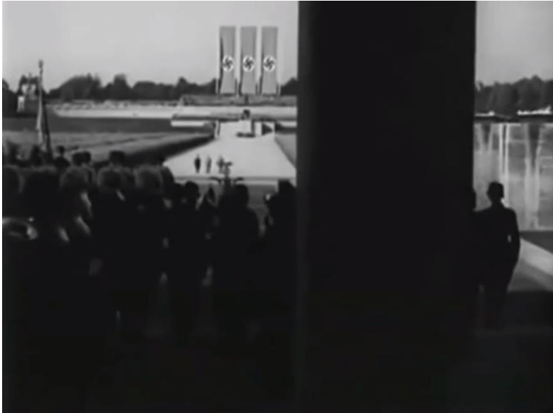
Slika 10. Kamera, sakriveni promatrač - gledatelj je iza stuba razmatrajući scenu.

U filmu je naznačena uloga njemačkog naroda u cijelom sustavu, a to je da uvijek bude pratitelj. To se ostvaruje agresivnim kadriranjem na sudionike parade (a i istovremeno svojevrsnog rituala) koji hodaju ravno prema kameri zajedno s pogledom iz ptičje perspektive koji gleda prema dolje na organizirane mase. Na kraju krajeva, u „Trijumfu volje“ ne radi se o volji, kako Sontag primjećuje, već o „trijumfu moći“ (Tomasulo, 2014). Dugi, pravilno raspoređeni, marširajući redovi vojnika podsjećaju na koloniju mrava. To može upućivati na rigidnu geometrijsku konfiguraciju i usklađenost ljudskih umova i tijela, čineći tako kolektivno tijelo.