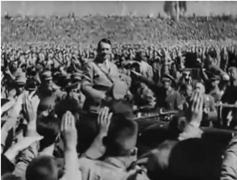
Slika 8. Hitler je fokusiran, masa zamućena.

Isto tako, može se jasno vidjeti hijerarhija društvenog poretka koju proklamira i očekuje nacionalsocijalistička ideologija. To možemo vidjeti i na primjeru kada se Hitler obraća radnom korpusu, masi ljudi. On je fokusiran dok je masa zamućena.