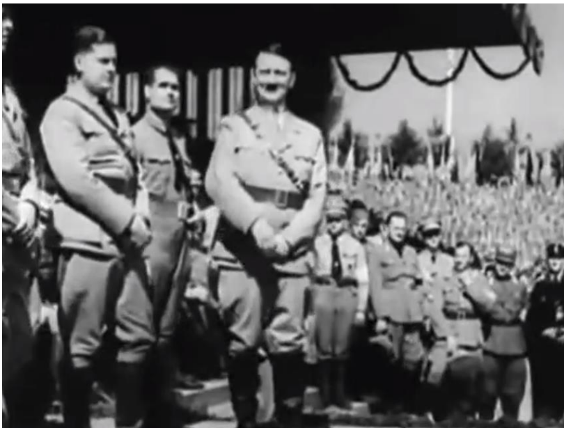
Slika 9. Hitler u srednjem planu.

Ovdje bi se moglo nadodati kako se u izvanjskome svijetu pravilan geometrijski red rijetko viđa, gotovo je stvar slučajnosti stoga je kadar u kojem vidimo pažljivo odabranu statičnu kompoziciju uvijek djeluje kao komentar, kao skretanje pozornosti na nešto značajno, na otkrivanje simboličke vrijednosti u prizoru (Peterlić, 2018). U prizorima gdje se prikazuje sam Hitler, često se vidi vertikalna kompozicija (to bi značilo visok izdvojen čovjek u srednjem planu) što na gledatelja ostavlja osjećaj nadmoćnosti, dostojanstvenosti, veličanstvenosti (Peterlić, 2018).