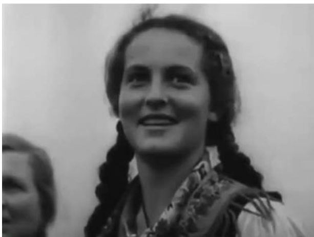
Slika 3. Krupni plan

Na slici 3. nalazi se prikaz djevojke u krupnom planu. Scena se pojavljuje u početku filma dok se prikazuje Hitlerov dolazak popraćen ovacijama mnogobrojne publike. Iz mase je izdvojena ova djevojka. Zahvaljujući krupnom planu, na djevojčinom licu se može primijetiti niz doživljaja i skrivenih emocija. Ako se malo bolje zagledamo u ovo lice, može se uočiti: uzbuđenost koja se odražava na crvenilu njenih obraza, prikrivena simpatija prema objektu na kojeg baca pogled (na Hitlera), radost, ozarenost... U krupnom planu je sve uvećano stoga se otkrivaju i raspoznaju najsitniji detalji. Povećavanjem i približavanjem stvara se dojam blizine lica, a u takvoj se blizini gledatelj može rijetko naći u stvarnom životu. Jedino krupni plan omogućuje dočarati širok spektar detalja u prikazanom objektu, a u sklopu montaže omogućiti gledatelju poistovjećivanje s kamerom o čemu će biti riječi kasnije.