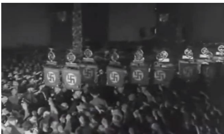
Slika 7. Procesija nacističkih zastava s kukastim križevima

Završne scene ostavljaju dojam mističnog rituala. Na samom kraju, kolone su krenule kući. Slavljenje smrti je bilo na svom vrhuncu. Poruka je bila ta da samo smrt jamči rađanje nove njemačke narodne zajednice – „Jedan vođa, jedan narod, jedno carstvo“. Premda je uspostavljanje nacističke diktature najprije proizlazilo iz strukture onovremenog njemačkog društva i politike, propaganda sa svojim jakim oružjem propagandnim filmom značajno je pomogla u legitimiranju nacističke ideologije kao nove političke religije. Nakon uspostave diktature, zahvaljujući snažnoj propagandi, cjelokupni javni život je postao propaganda (Cipek, 2009).