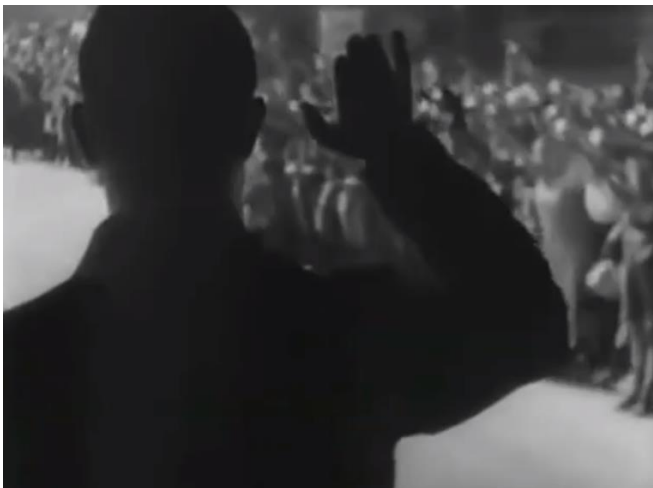
Slika 13. Neobičan kut snimanja primjer 2