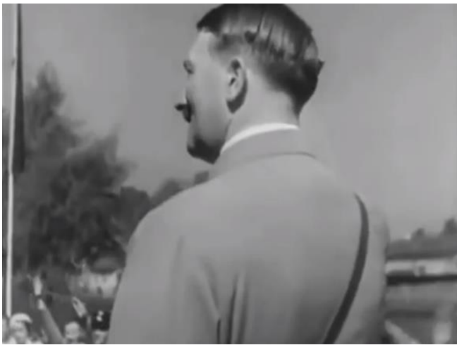
Slika 12. Neobičan kut snimanja primjer 1

Filmovi nam omogućuju da slična iskustva prolazimo tisuću puta. Oni otuđuju našu okolinu razotkrivajući je (Kracauer, 1997). Redatelj može jednim nagibom kamere pobuditi jaku znatiželju u gledatelju. Upravo zbog svoje metamorfozne moći se snimke iz neobičnih kutova često koriste u propagandne svrhe kao što su npr. neki kadrovi u filmu u kojima se pojavljuje Hitler (Kracauer, 1997). Najreprezentativniji primjer toga su slike broj 12 i 13 sa primjerim 1 i 2.