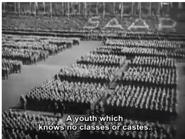
Slika 5. Prikaz naroda iz visokog kuta kao iskaz podređenosti mase u nacističkom režimu

Montaža je u većini ponavljajuća. Općenito se sastoji od izmjene snimaka scena a zatim snimaka reakcija publike na scenu. Činjenica da su takve snimke snimljene pokretne pošto su snimljene uglavnom iz automobila, čini prizore još dinamičnijima. Da bi dodala raznolikost prezentaciji tom virtualnom kontaktu pogledom između Hitlera i razdragane publike, Riefenstahl se koristila sa što više različitih raspona i kutova kamere. Međutim, hijerarhija je vrlo jasna – ljudi su uvijek prikazani u visokokutnim kadrovima dok je Hitler prikazivan iz niskog kuta ili kuta u razini očiju. O prikazu hijerarhije između Hitlera i mase u filmu govore slike 5 i 6.