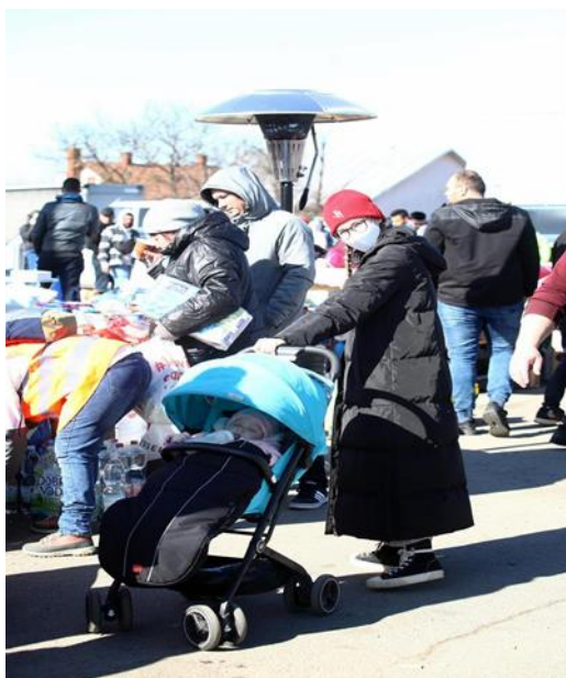
Slika 2. Mučne scene na granici