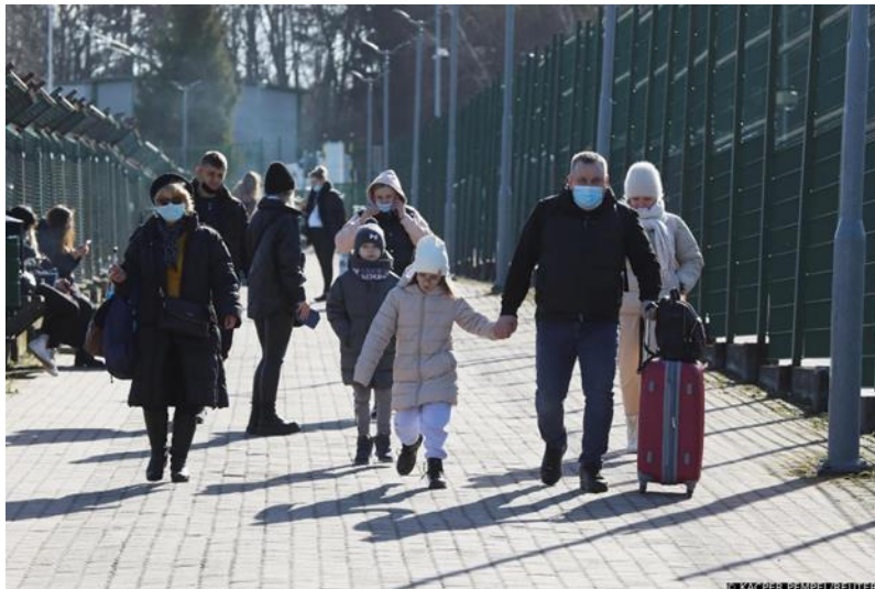
Slika 1. Izbjeglice iz Ukrajine