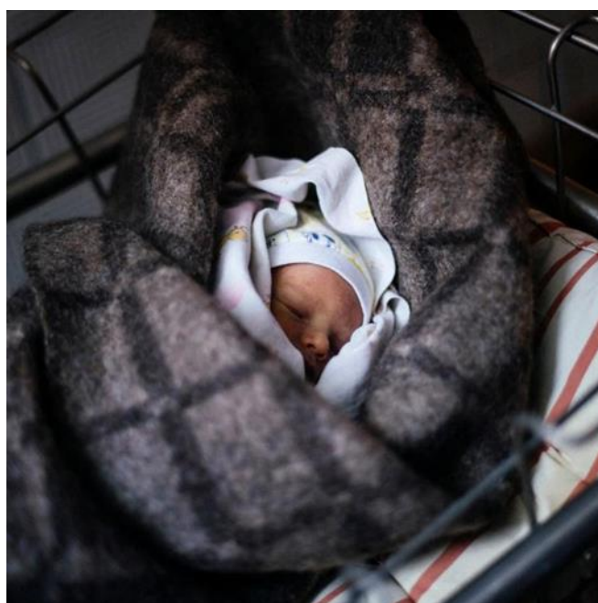
Slika 8. Novi životi u ratnoj Ukrajini