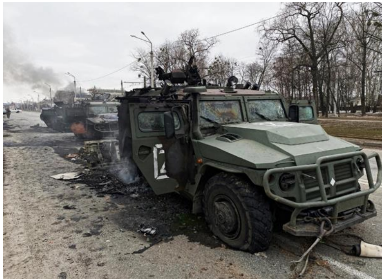
Slika 5. Ukrajinski trofeji