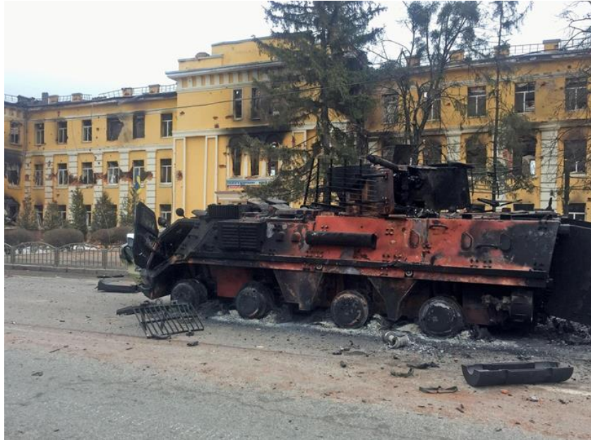
Slika 4. Ukrajinski trofeji

u sigurnije dijelove Europe, u potrazi za novim domovima. Ljudi koji nose život u jednom kuferu, djeca u naručjima majki, šatori puni ljudi prizori su koji u nama izazivaju sućut, potrebu za pomoći jedni drugima, tugu i nemoć.