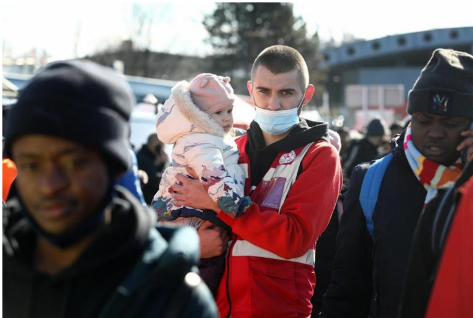
Slika 6. Slika djevojčice iz Ukrajine

U članku Večernjeg lista iz ožujka 2022. godine, pod naslovom „Ima li tko hrabrosti da zaustavi Putina“, nailazimo i na ove dvije fotografije ruskih tenkova koji su razorili ukrajinske gradove (www.večernji.hr, 01.03.2022). Fotografije se mogu interpretirati kao ruski trofeji kojima su osvojeni dijelovi ukrajinskih gradova.