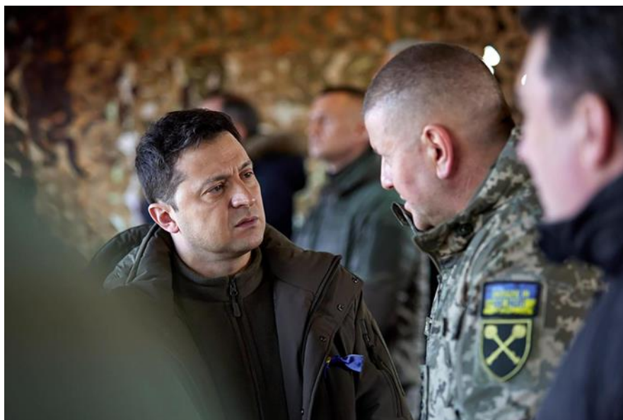
Slika 11. Predsjednik Ukrajine Volodimir Zelenski

Predsjednik Rusije, Vladimir Putin u svim člancima, gotovo je uvijek u istom izdanju. Hladnog, ozbiljnog pogleda, obučen u tamnoplavo odijelo, s rukama položenim na veliki stol u njegovom uredu, odaje dojam moćnog i odlučnog vladara.