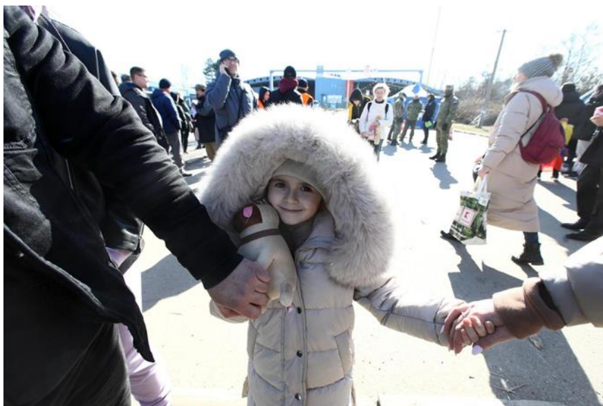
Slika 7. Slika djevojčice s granice