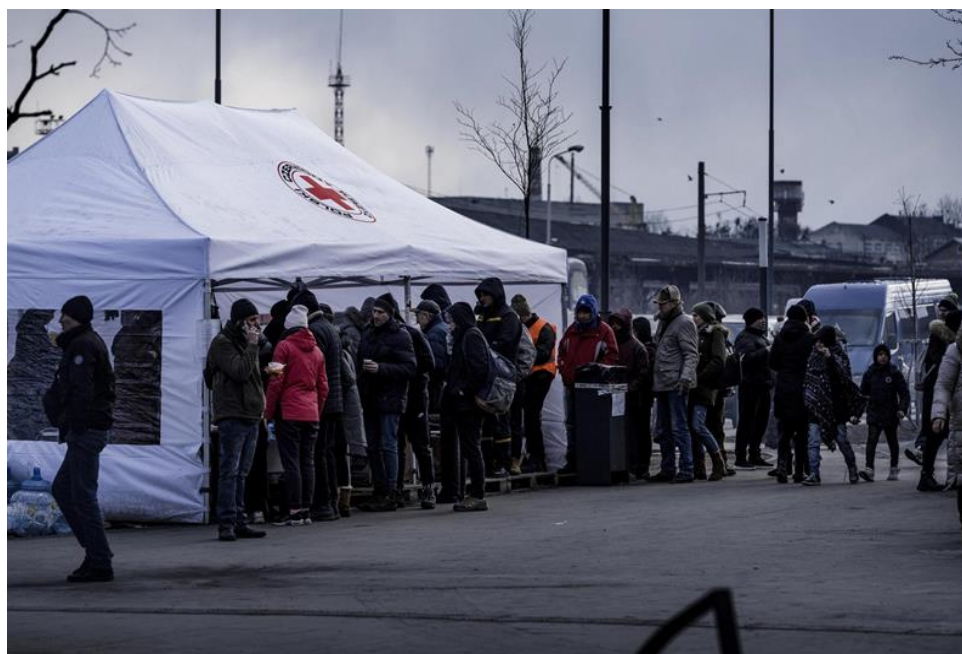
Slika 3. Gužva na graničnim prijelazima