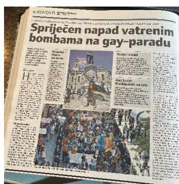
Slika 12. Slobodna Dalmacija, 8. srpnja 2007. godine