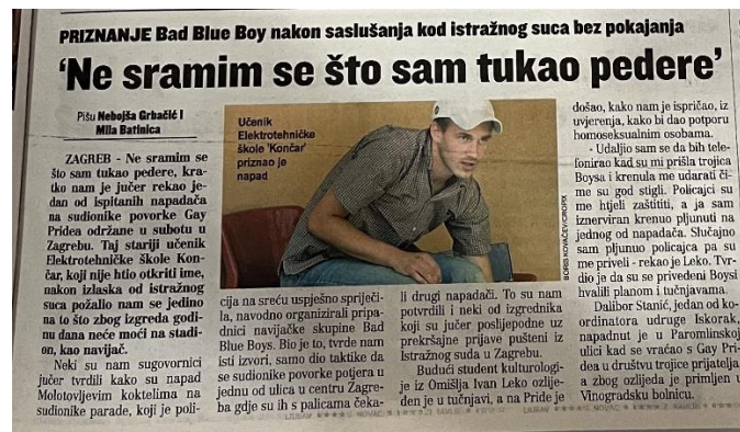
Slika 19. Jutarnji list, 9. srpnja 2007. godine

Godine 2007. ponovno je zabilježena upotreba riječi peder u Jutarnjem listu. Naime, nakon najnasilnije povorke ponosa u Zagrebu, privedeno je nekoliko osoba, a Jutarnji list prenio je komentar učenika srednje škole koji je izjavio kako se ne srami što je tukao „pedere“. U političkom tjedniku Globus koji je objavio članak na pune dvije stranice s naslovom „Marš homoseksualaca: Idemo na Zagreb!“, homoseksualci su imenovani „pederima i tetkicama“ (Globus, 28.6.2007.). Na portalu Jutarnji.hr nakon prve povorke ponosa u Splitu objavljen je članak iz kojeg doznajemo kako su protivnici povorke LGBT zajednicu nazivali „nakazama i pederima“ (jutarnji.hr 11.06.2011.)