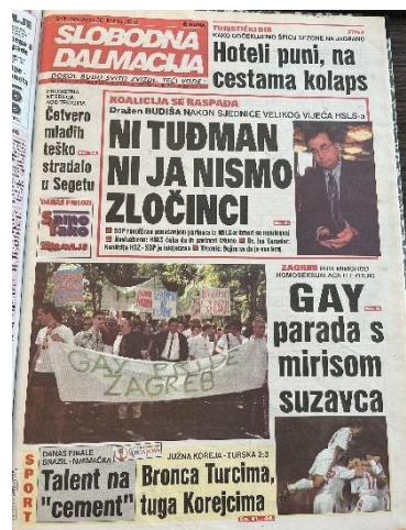
Slika 9. Slobodna Dalmacija, 30. lipnja 2002. godine

paradu“ (Jutarnji list, 30.6.2002.). Novinari su izvijestili kako je prva povorka ponosa održana „na rubu incidenta zbog uvreda, pljuvanja te bacanja jaja protivnika skupa na tristotinjak sudionika parade“ (Jutarnji list, 30.6.2002.). Slični naslovi objavljeni su i u dnevnom listu Slobodna Dalmacija. Naslov iz 2002. godine glasi „Gay parada s mirisom suzavca“ (Slobodna Dalmacija, 30.6.2002.), dok je 2007. objavljena naslovnica „Spriječen napad na gay-paradu“ i tekst s naslovom „Spriječen napad vatrenim bombama na gay-paradu“ (Slobodna Dalmacija, 8.7.2007.).