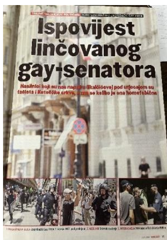
Slika 16. Globus, 13. srpnja 2007. godine