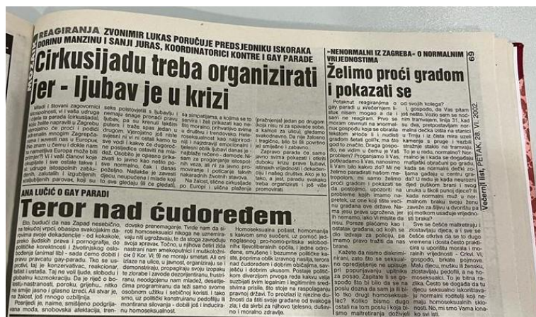
Slika 3. Večernji list 28. lipnja 2002.

Diskurs MI - normalni / ONI – nakazni pronađen je u tri članka, od toga 2 u Večernjem listu i 1 u Jutarnjem listu. Ovaj diskurs prisutan je u izjavama komentatora rubrike Mozaik (Večernji list), političke aktivistkinje te šefa Sindikata policije, koji su javno iznijeli negativne komentare i osudili LGBT zajednicu.