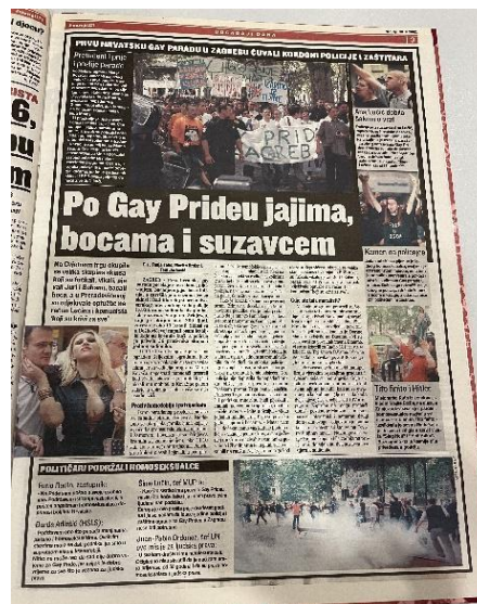
Slika 8. Jutarnji list 30. lipnja 2002. godine