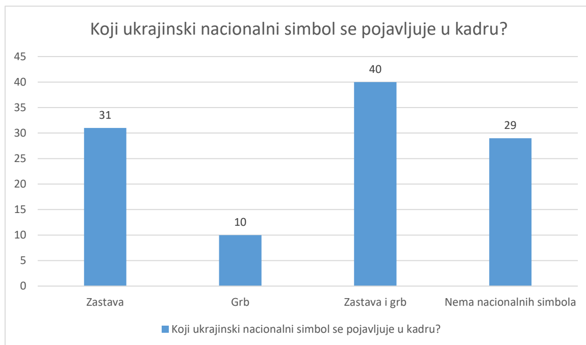
4. Graf 3: NACIONALNI SIMBOLI

Od 81 videozapisa u kojem su uočeni ukrajinski nacionalni simboli, u njih 31 riječ je o ukrajinskoj zastavi. U deset videa istaknut nacionalni simbol je ukrajinski grb, dok se u čak 40 videozapisa istovremeno u kadru pojavljuju i ukrajinska zastava i ukrajinski grb.