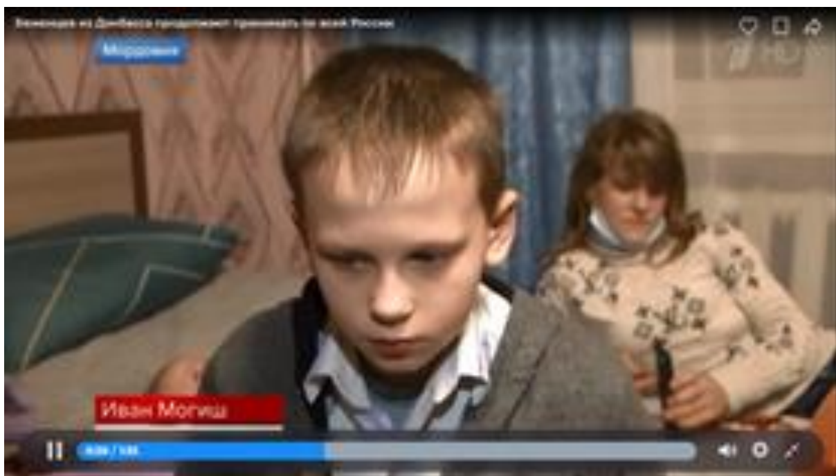
Slika 1: „Prihvaćanje izbjeglica iz Donbasa u tijeku je diljem Rusije“, Izvor: Perviy kanal, 24. veljače 2022.

Kroz priloge se ponavlja kako se „kijevski režim već osam godina izivljava nad stanovništvom Donbasa, Donjecka i Luhanska“. Kao dio tog izivljavanja navode se ubojstva djece, žena, staraca, mučenje stanovništva u podrumima. Prema izvještavanju „Pervog kanala“ ukrajinska vojska puca po školama, vrtićima i bolnicama i koristi zabranjeno oružje. Vojnici se skrivaju u zgradama, „iza leđa civila“ poput kukavica.