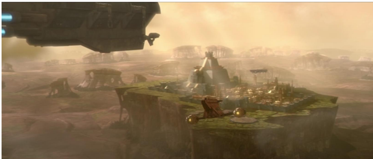
Slika 1: Planet Zygerria