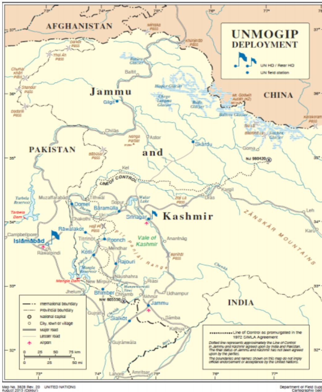
Slika 3. Razmještaj terenskih postaja UN-a u kašmirskoj regiji (Timetoast, 2023)

preporuku UNCIP-a, glavni tajnik uspostavio je misiju UNMOGIP (United Nations Military Observer group in India and Pakistan) te imenovao zapovjednika vojnih promatrača (u daljnjem tekstu CMO) koji je ujedno i voditelj misije (HOM), te osigurao skupinu vojnih promatrača koji će mu pomagati.