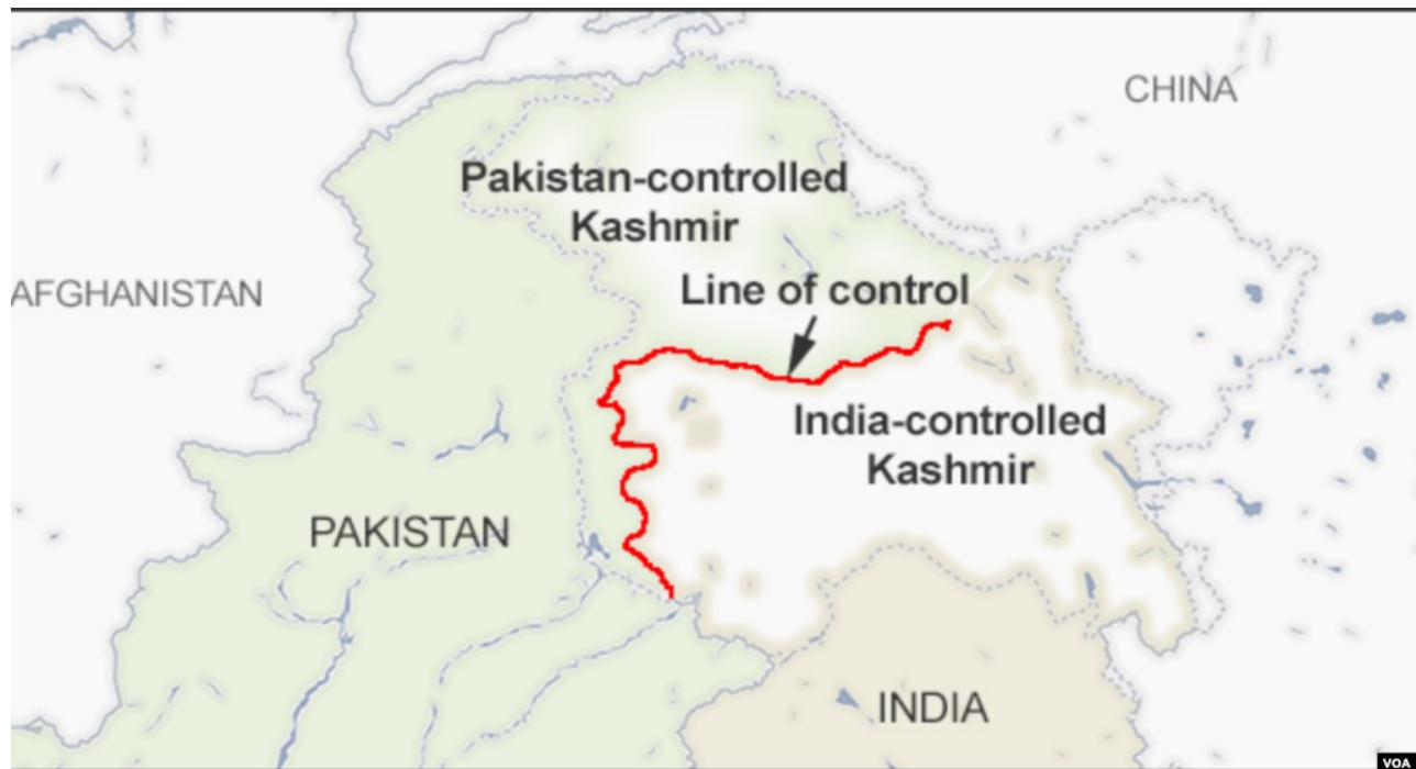
Slika 2. Uspostavljena linija razgraničenja između Indije i Pakistana (Gul, 2023)

maharadža Singh popušta i dopušta ograničenu demokraciju u obliku zakonodavne skupštine. Međutim, nemiri u regiji su se i dalje nastavili. Odlaskom Britanaca s indijskog potkontinenta, vladari kneževina dobili su mogućnost pridruživanja Indiji ili Pakistanu ili opciju da ostanu neovisni. Uzimajući u obzir geografska i etnička obilježja, većina kneževina vrlo brzo se priključilo Indiji, odnosno Pakistanu. Međutim, u Kašmiru je Hari Singh oklijevao. Ubrzo je uslijedila pobuna većinski muslimanskog stanovništva pod pokroviteljstvom Pakistana. Nakon dolaska pakistanskih vojnih snaga u Kašmir, stvari su vrlo brzo izmakle kontroli, a maharadža Singh je u potpunosti izgubio nadzor u Kašmiru. Stanovništvo je tražilo pridruživanje Pakistanu. Singh je tada, bojeći se totalne eskalacije i rata, popustio te pod indijskim pritiskom 26. listopada 1947. potpisao Ugovor o pridruživanju kneževine Indiji nakon održavanja plebiscita 5 . Dan kasnije, u pismu generalnog guvernera Indije, Lorda Mountbattena maharadži Singhu, jasno se navodi da će Kašmir biti pripojen Indiji nakon izglasavanja stanovništva Kašmira. Međutim, svjesna ishoda, Indija nikad nije provela plebiscit. Dakako, navedena situacija je toliko kulminirala da su Indija i Pakistan međusobno zaratili zbog Kašmira. Tijekom rata, Indija je prva iznijela kašmirski spor pred UN 1. siječnja 1948. Već sljedeće godine, 1949., UN je uspostavio liniju razgraničenja (Britannica, 2023).