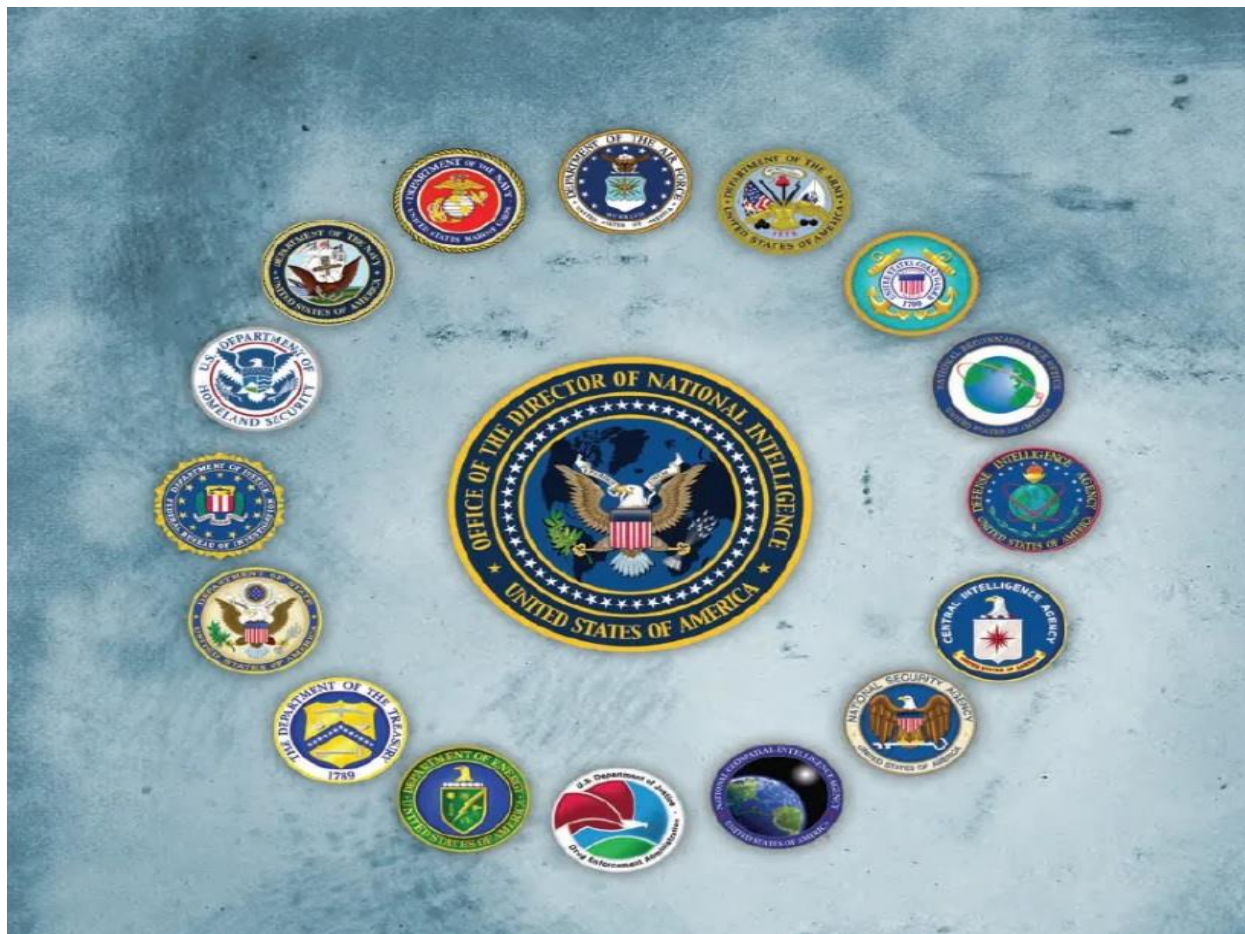
Slika 1: Članice IC-a