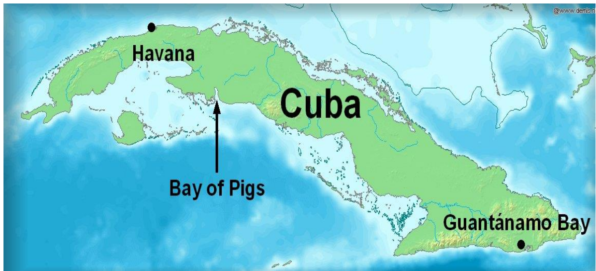
Slika 5: Karta Kube, prikazuje Zaljev svinja

Poraz u Zaljevu svinja bio je za predsjednika Johnu F. Kennedyj-a važno iskustvo, te će u budućnosti biti itekako oprezan pri primanju savjeta od svojih generala i CIA-e. To iskustvo pokazalo se korisnim u kasnijem Kennedyjevom uspješnom rješavanju Kubanske raketne krize