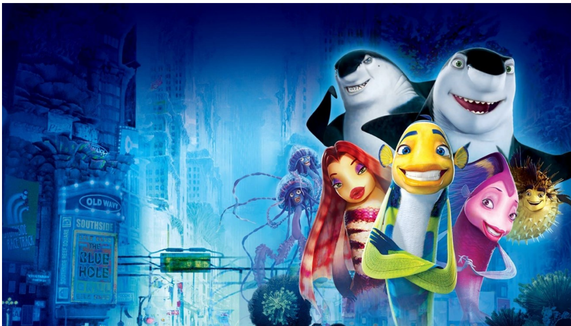
Slika 2.: Glavni likovi u filmu Riba ribi grize rep

Radnja filma odvija se u podmorju. Na samom početku radnje upoznajemo Oskara, ribu “frajera” koji žudi za slavom i novcem jer smatra da, ako će imati materijalno, da će ga ostale ribe u podmorju više cijeniti. Upoznajemo i ribu Angie koja simpatizira Oskara, morskog psa Lenija koji je vegetarijanac i njegovu obitelj koja ga u tome ne podržava. Spletom okolnosti, upoznaju se Leni i Oskar i shvate da jedan od drugoga mogu imati koristi. Oskar postaje popularan, počinje se sviđati ribi “ljepotici” Loli, a Leni ostaje skriven u Oskarovoj garaži. Radnja se raspliće tako da Leni i Oskar shvaćaju svoje greške, Don Lino (Lenijev otac) ga počinje prihvaćati, a Oskar ulazi u ljubavnu vezu s Angie.