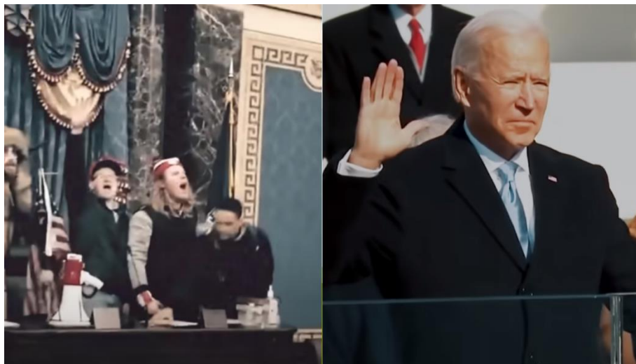
Slika 10. Promjena osvjetljenja

se stvara osjećaj tmurnosti i sivila. Primjer koji dobro prikazuje moć osvjetljenja je Long Way . U narativnoj ekspoziciji, koja govori o stanju SAD-a prije izbora 2020., javljaju se kadrovi sa slabim osvjetljenjem. Kada dolazi do narativnog poremećaja, odnosno trenutka u kojem se remeti početno stanje, kadar, koji prikazuje Bidenu prisegu, postaje svjetliji.