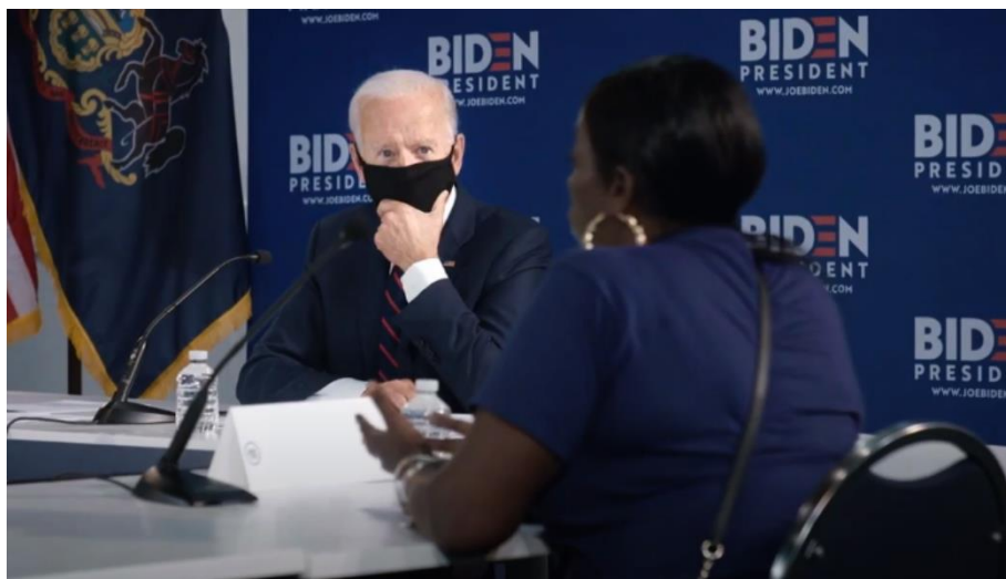
Slika 1. Biden u odijelu s maskom

Često se nalazi za govornicom gdje je sniman u bližem planu, a također je puno puta prikazan u interakciji s ljudima koji simboliziraju njegove birače. Rukuje se s njima ili ih jednostavno sluša. U nekim videozapisima Biden nije junak po Proppovoj sistematizaciji, već ima ulogu darovatelja. Primjeri za to su A Healthy Life i Crossroads . Otac bolesnog dječaka i bivši Trumpov glasač su junaci tih videa, no Biden, iako ima drugačiju ulogu, ipak sebe prikazuje u okviru mita heroja-spasitelja, odnosno kao osobu koja će riješiti njihove probleme.