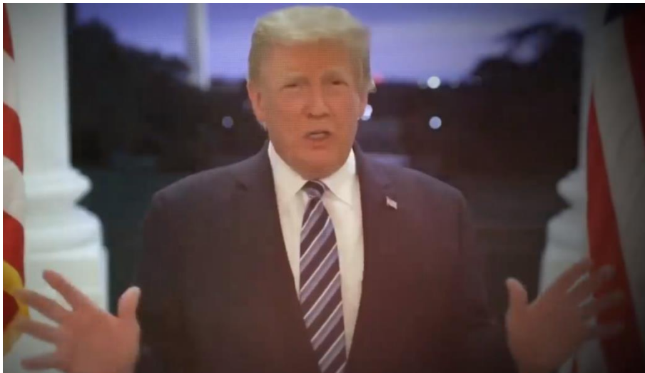
Slika 6. Trump maše rukama

My Mom je video koji je u potpunosti fokusiran na napade. Pripovjedačica je Marygrace iz Pensilvanije koja se na početku prisjeća da joj je majka rekla da ima problema s COVID-om i da teško diše, a potom je stavljena na respirator. Žena je snimana u bližem planu, a gledatelj također vidi fotografije nje i majke. Marygrace je u jednom trenutku prikazana u krupnom planu gdje se mogu iščitati njene emocije; tužna je i na rubu plača. Središnji dio videa, odnosno komplikacija po narativnoj strukturi vezan je uz Trumpa. U tom trenutku se brzo mijenjaju kadrovi - jedni pokazuju Trumpa koji radi grimase i negativno govori o virusu („Nemojte dopustiti da vas kontrolira“), dok drugi prikazuju Marygrace koja izjavljuje da je njegovo ponašanje nedopustivo. Najupečatljiviji je kadar u kojem Trump skida masku (prikazan pod Slikom 3.).