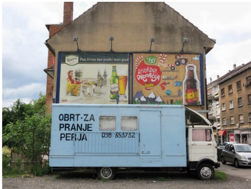
Slika 1. „Rurbane nezgrapnosti“, str. 65

Kao što sama riječ upućuje, termin rurbano doslovno označava spoj ruralnog i urbanog. Moja je želja bila pristupiti ovome istraživanju s idejom da bolje shvatim što taj termin označava u praksi, sagledavši prostore grada Zagreba. Nabasala sam na zbirku umjetničke fotografije intrigantnog naslova „Rurbane nezgrapnosti“. Autor Antun Maračić u njoj nudi pregled fotografija grada Zagreba snimljenih od 2010. do 2013. godine, a u uvodu objašnjava sljedeće: „U gradskim prizorima prisutni su ponekad elementi 'involucije' prema ruralnom, odnosno znaci entropije urbaniteta (Maračić, 2013:3). Izdvojila bih dvije fotografije koje su me nagnale na razmišljanje, od kojih obje po mome mišljenju sugeriraju kako urbana sredina sa sobom nosi priliku za boljim životom. Takvo moje opažanje se može objasniti takozvanim mitom promicanja urbanog prostora, koji je postojan s obzirom na mnogobrojne mogućnosti koje se u takvom prostoru nude, od posla do zadovoljstva (Hubbard, 2006:63). Naime, još od doba starih Grka i Rimljana grad predstavlja sjedište kulture, učenja, vlasti i građanskog poretka, te se od tada nadalje gleda na nj kao ikonu napretka, prosvjetljenja i mogućnosti (ibid. 65, cit. prema Sennett, 1994). Isto kao što postoji pro-urbani mit, tako postoji i onaj anti-urbani koji zamišlja ruralnu sredinu kao ugodnije i idiličnije mjesto za život od grada (ibid. 63). Mišljenja sam da priložene fotografije prikazuju prisutnost oba mita u Zagrebu.