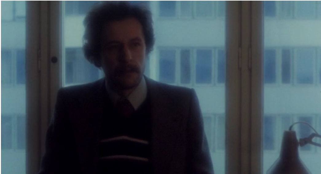
Slika 13. Drago, scena suočavanja supružnika u filmu „Ljubica“

ja tebi govorio da je materi mjesto uz dijete. Nisam to ja izmislio. Kakvi je mali imao potrebe da ti studiraš te tvoje fonetike? Ti Boga, tebi i fonetika! Imala je moja mati pravo. Do kud je to došlo, bogami! Do kud je to došlo!“. Dok izgovara te riječi, u njegovoj je pozadini prikazana susjedna zgrada s mnogobrojnim prozorima, dakle, urbana sredina se prikazuje u kontrastu njegovih ruralnih riječi.