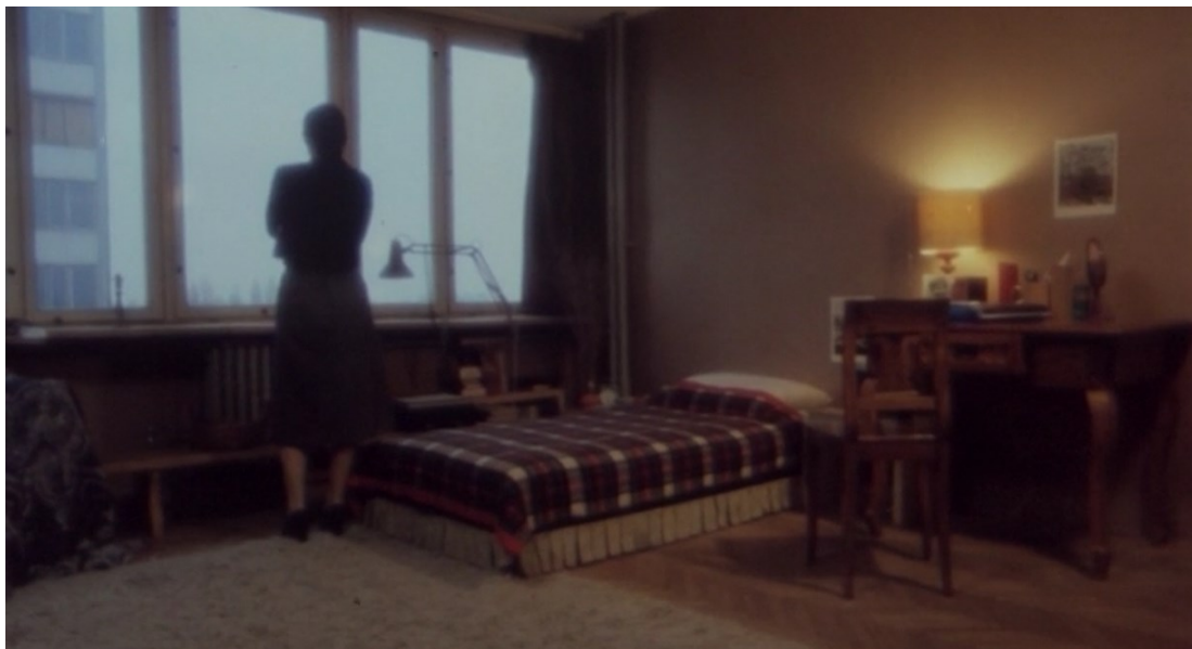
Slika 15. Ljubičin stan, scena suočavanja supružnika u filmu „Ljubica“

Ljubica ostaje sama u svome stanu gledajući kroz prozor, možda da si skrene misli, možda da ugleda Dragu ili Zlatka, ili možda da pogleda u „bolje sutra“. Također, gledatelju se pruža pogled na cijelu prostoriju u kojoj Ljubica obitava u svome jednosobnome stanu, naglašavajući još jednom u kakvim uvjetima stanuje. Ako se promatra cijela scena koja se odvija u vrhuncu filma, ona traje gotovo 7 i pol minuta, što je poprilično dugo. Kadrovi su većinski dugi, kao i u ostatku filma.