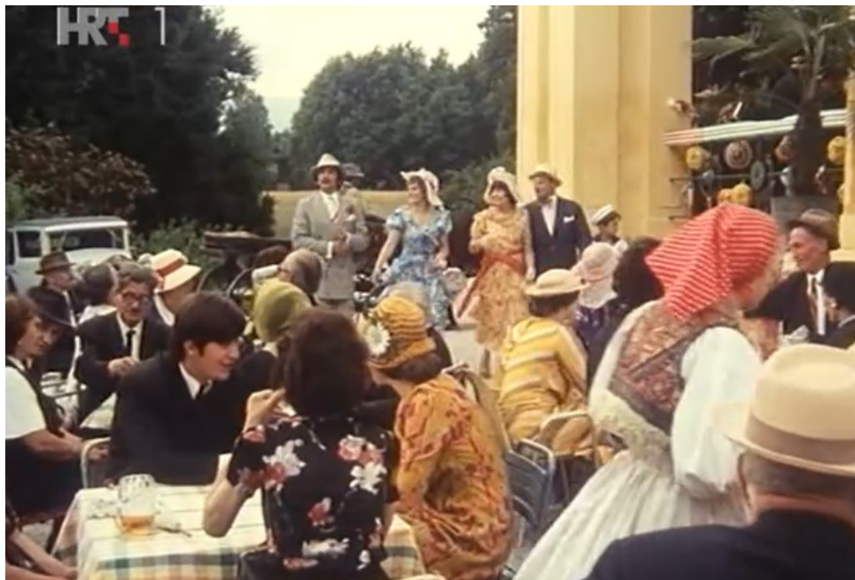
Slika 8. scena zabave u Maksimiru u filmu „Tko pjeva zlo ne misli“

Scena koja će se analizirati kao narativ se odvija u nedjelju po Peričinom dnevniku, a riječ je o odlasku spomenutih likova na zabavu u perivoj Maksimir. Oni stižu kočijom do vidikovca gdje se, uoči zabave, može popiti piće ili nešto prezalogajiti. Gospođe su odjevene u raznobojne haljine i nose fine šešire, a gospoda su odjeveni u crna odijela s bijelom košuljom i s crnom kravatom, neki od njih također nose šešire. Obitelj Šafranek, Mina i Fulir ne odskaču svojim stilom odijevanja od drugih. Međutim, konobarice su obučene u narodnu nošnju, iako riječ je o zabavi. Odmah upada u oko odjevna reprezentacija rurbanog identiteta grada Zagreba prikazana u tome kadru snimljenom u total planu. Točnije, kamera se kreće u švenku, pruživši time panoramu na cijeli prostor zbivanja. Ovaj je kadar bitan i po tome što su likovi u njemu smješteni na specifičan način. Fulir se nalazi uz Anu, a Franjo uz Minu, takav redateljev odabir leži u sličnosti likova u karakteru te s obzirom na interese i uvjerenja.