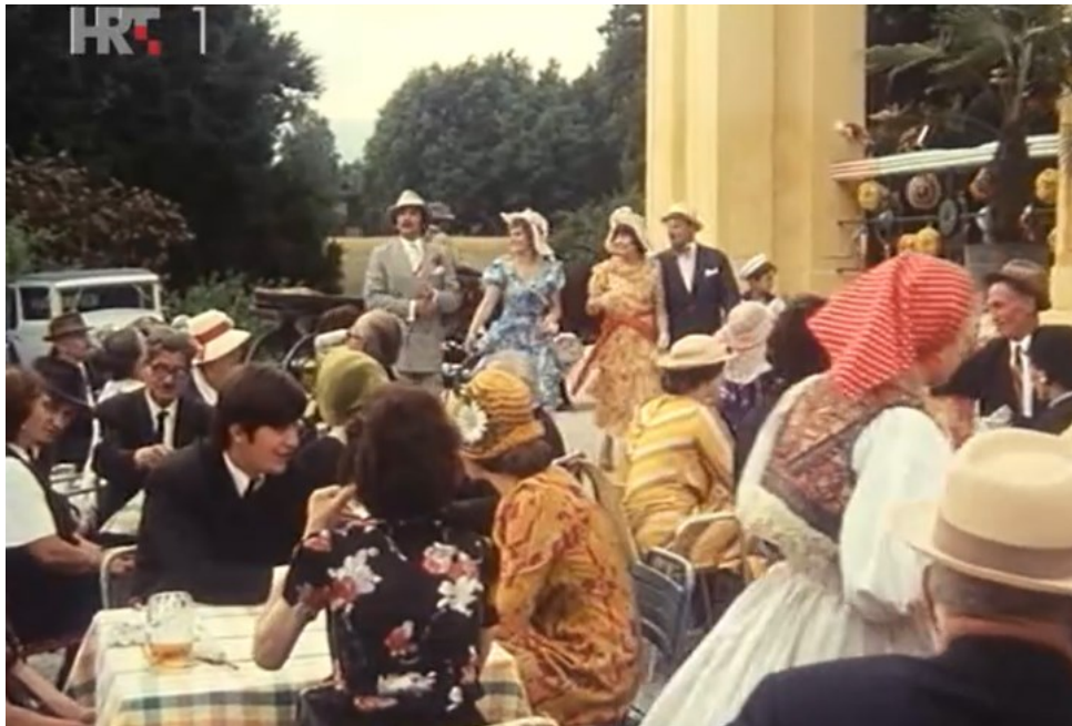
Slika 8. scena zabave u Maksimiru u filmu „Tko pjeva zlo ne misli“

Scena koja će se analizirati kao narativ se odvija u nedjelju po Peričinom dnevniku, a riječ je o odlasku spomenutih likova na zabavu u perivoj Maksimir. Oni stižu kočijom do vidikovca gdje se, uoči zabave, može popiti piće ili nešto prezalogajiti. Gospođe su odjevene u raznobojne haljine i nose fine šešire, a gospoda su odjeveni u crna odijela s bijelom košuljom i s crnom kravatom, neki od njih također nose šešire. Obitelj Šafranek, Mina i Fulir ne odskaču svojim stilom odijevanja od drugih. Međutim, konobarice su obučene u narodnu nošnju, iako riječ je o zabavi. Odmah upada u oko odjevna reprezentacija rurbanog identiteta grada Zagreba prikazana u tome kadru snimljenom u total planu. Točnije, kamera se kreće u švenku, pruživši time panoramu na cijeli prostor zbivanja. Ovaj je kadar bitan i po tome što su likovi u njemu smješteni na specifičan način. Fulir se nalazi uz Anu, a Franjo uz Minu, takav redateljev odabir leži u sličnosti likova u karakteru te s obzirom na interese i uvjerenja.