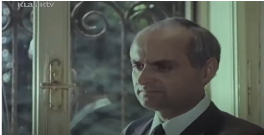
Slika 4. Drugi tata, scena ručka u filmu „Imam 2 mame i 2 tate“

„Nemamo ga mi nego moj tata u Proleterskoj.“, tvrdi Đuro. Auto je, naravno, status simbol jer si ga tada ne može priuštiti svatko. Stan Drugog tate i Mame nije moderno uređen, već staromodno, uz puno knjiga i statua. Doima se bogatim malograđanskim stanom iz prošlog doba. Drugi tata promatra u svoj starinski džepni sat koliko je sati te, s obzirom da Zoran nikako da se pojavi, on odlučuje: „Idemo jesti.“, što je filmskim jezikom izrečeno kadrom u krupnome planu kako bi gledatelj mogao razabrati nezadovoljstvo na njegovom licu.