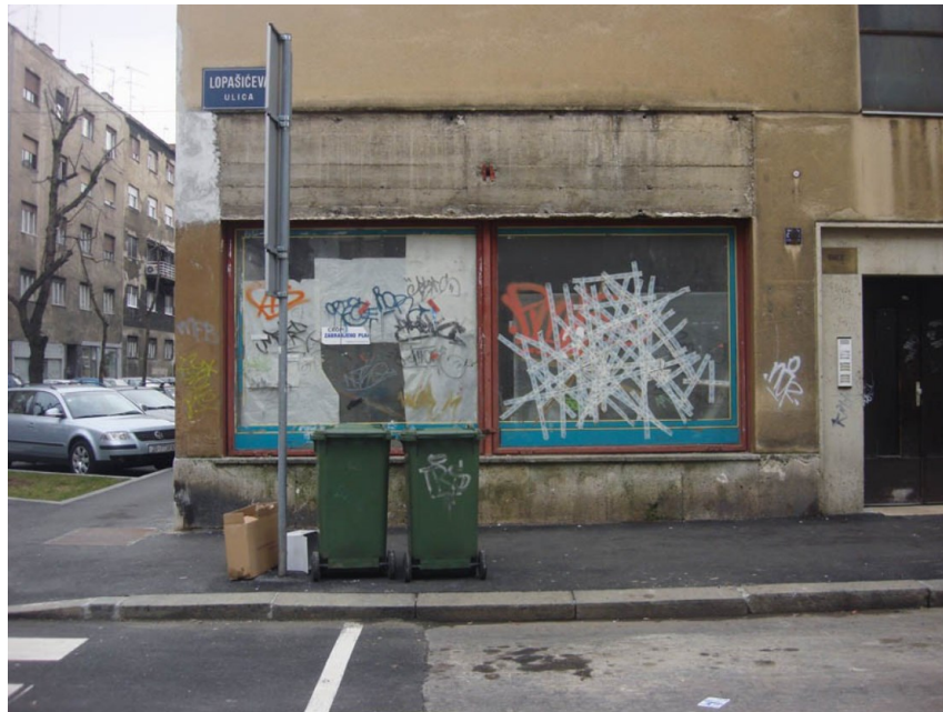
Slika 2. „Rurbane nezgrapnosti“, str. 54

Druga slika prikazuje zapušteni izlog nekadašnje trgovine čime se potencira anti-urbani mit, točnije treba se zapitati što kada netko ne uspije u nastojanju da stekne bolji život u gradskoj sredini? Život u gradu, s obzirom na svoju nepredvidivu prirodu, sa sobom povlači prisutnost stalne borbe, koja je za neke izazovna te time i svojevrsna atrakcija (ibid. 64, cit. prema N. Smith 1996). Ipak, ruralno i urbano funkcioniraju zajedno u gradu Zagrebu, baš kao i pro-urbani i anti-urbani mit.