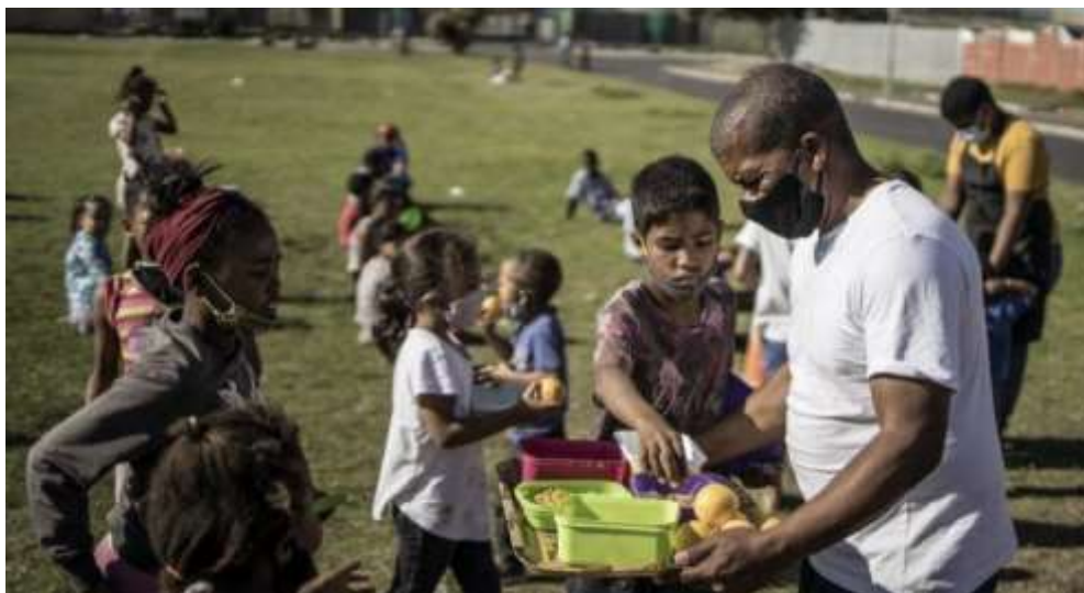
Slika 4: Ilustracija – glad djece uzrokovana klimatskim promjenama ( https://www.jutarnji.hr/vijesti/svijet/covid-klimatske-promjene-gospodarski-sokovi-vise-od-300-milijuna-djece-zivi-u-ekstremnom-siromastvu-15374154 )

Ovaj je okvir najmanje zastupljen u analiziranim člancima s portala Jutarnji.hr – pojavljuje se u 2 od 12 članaka. Ondje gdje se navedeni okvir pojavljuje, u kombinaciji je s okolišnim ili ekonomskim okvirom (jer klimatske promjene za krajnju posljedicu imaju utjecaj na zdravlje, što kroz njihov loš utjecaj na okoliš i posljedično na proizvodnju hrane, što kroz njihov utjecaj na ekonomiju i resurse koje pojedina zemlja posjeduje, što se posebno negativno održava na manje razvijene zemlje).