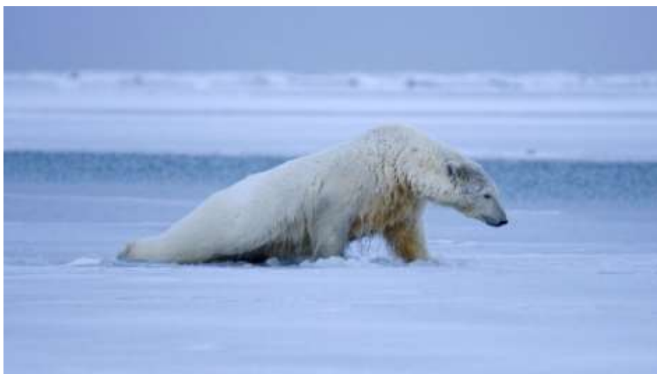
Slika 3: Polarni medvjed kao simbol utjecaja klimatskih promjena na životinje ( https://www.jutarnji.hr/vaumijau/aktualno/klimatske-promjene-poticu-toplinske-valove-koji-ugrozavaju-ljude-ali-i-zivotinje-15372477 )