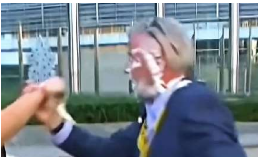
Slika 6: Šef Ryanaira pogođen tortom (od strane klimatskih prosvjednika) ( https://www.index.hr/vijesti/clanak/video-sefu-ryanaira-dvije-klimatske-prosvjednice-nabile-tortu-u-glavu/2493573.aspx )

Osim prosvjednika, odnosno ekoloških aktivista, često su prikazani primjeri (masovnog) turizma jer je to jedan od sektora najpogođenijih klimatskim promjenama. Uz fotografije turista često se kombinira i znanstveni prikaz globalnog zatopljenja kako bi se ukazalo na nužnost djelovanja i promjena.