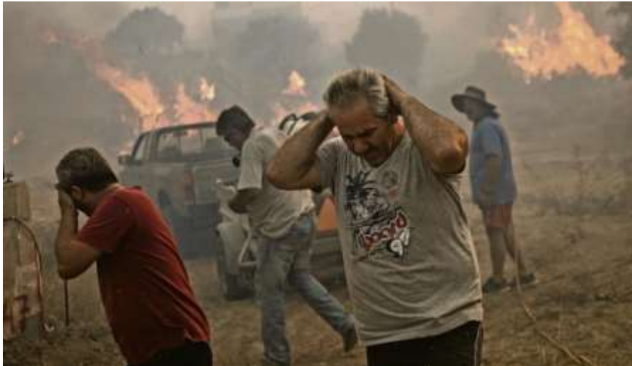
Slika 2: Požar u šumskim područjima Grčke ( https://www.jutarnji.hr/vijesti/svijet/strasni-ekstremi-i-na-drugim-kontinentima-pogledajte-sto-se-dogada-na-floridi-a-tek-cile-15359349 )

Okolišni/ekološki okvir je vidljiv ne samo u sadržaju članka, već i u vizualnoj reprezentaciji (ono što zapravo prvo i vidimo kad otvorimo članak). Najčešće su to prikazi ljudi pogođenih vremenskim nepogodama (npr. požari). Cilj je i slikom prikazati prijetnju koju donose klimatske promjene (slika često ima i veći utjecaj jer je odmah vidljivo o čemu se radi i na neki je način izravno prikazano ono što je u članku, često i na prilično znanstveni način, objašnjeno).