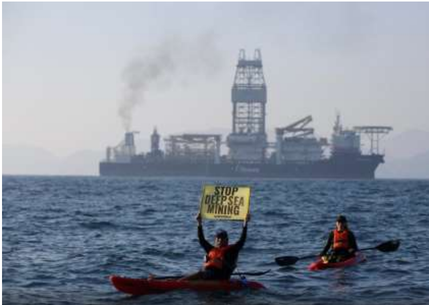
Slika 10: Prosvjed protiv rudarenja morskog dna ( https://www.vecernji.hr/vijesti/uz-klimatske-promjene-veliku-opasnost-za-tune-predstavlja-rudarenje-u-dubokom-moru-1694328 )

Vizualno je ovaj okvir najčešće praćen fotografijama prosvjeda protiv klimatskih promjena (primarno onih koje izaziva čovjek svojim negativnim djelovanjem, npr. pretjeranim rudarenjem morskog dna što za posljedicu ima ometanje migracija tuna i mnoge druge negativne učinke).