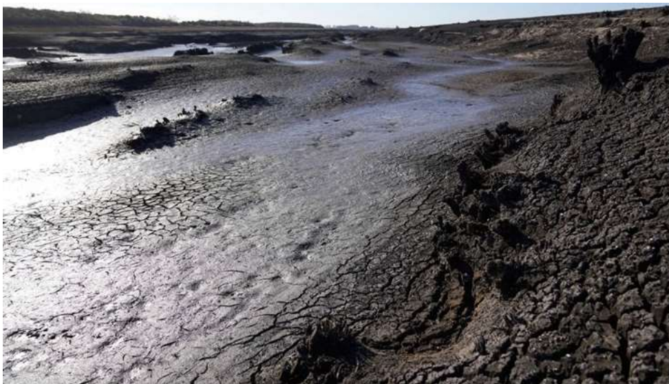
Slika 5: Suša uzrokovana fenomenom El Niño ( https://www.index.hr/vijesti/clanak/vratio-se-el-nino/2476929.aspx )

Ono što je vidljivo jest da se unutar okolišnog/ekološkog okvira koriste izrazi koji ukazuju na ozbiljnost situacije u kojoj se nalazi planet Zemlja, ali i izrazi koji potiču na djelovanje (ukazujući na to da je čovjek najodgovorniji za klimatske promjene koje se događaju i da bi svatko od nas trebao promijeniti svoje ponašanje u cilju smanjenja našeg štetnog utjecaja na okoliš). Opasnost situacije u kojoj se nalazimo ilustrirana je i slikama koje se pojavljuju uz članke. Najčešće su to slike prirodnih katastrofa izazvanih klimatskim promjenama (kao i slike ljudi pogođenih tim katastrofama).