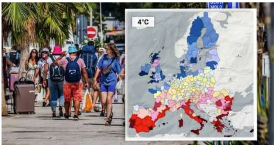
Slika 7: Prikaz turista uz kartu koja pokazuje globalno zatopljenje ( https://www.index.hr/vijesti/clanak/studija-otkrila-koje-ce-zemlje-zbog-klime-biti-turisticke-gubitnice-a-koje-dobitnice/2491165.aspx )

Osim prosvjednika, odnosno ekoloških aktivista, često su prikazani primjeri (masovnog) turizma jer je to jedan od sektora najpogođenijih klimatskim promjenama. Uz fotografije turista često se kombinira i znanstveni prikaz globalnog zatopljenja kako bi se ukazalo na nužnost djelovanja i promjena.