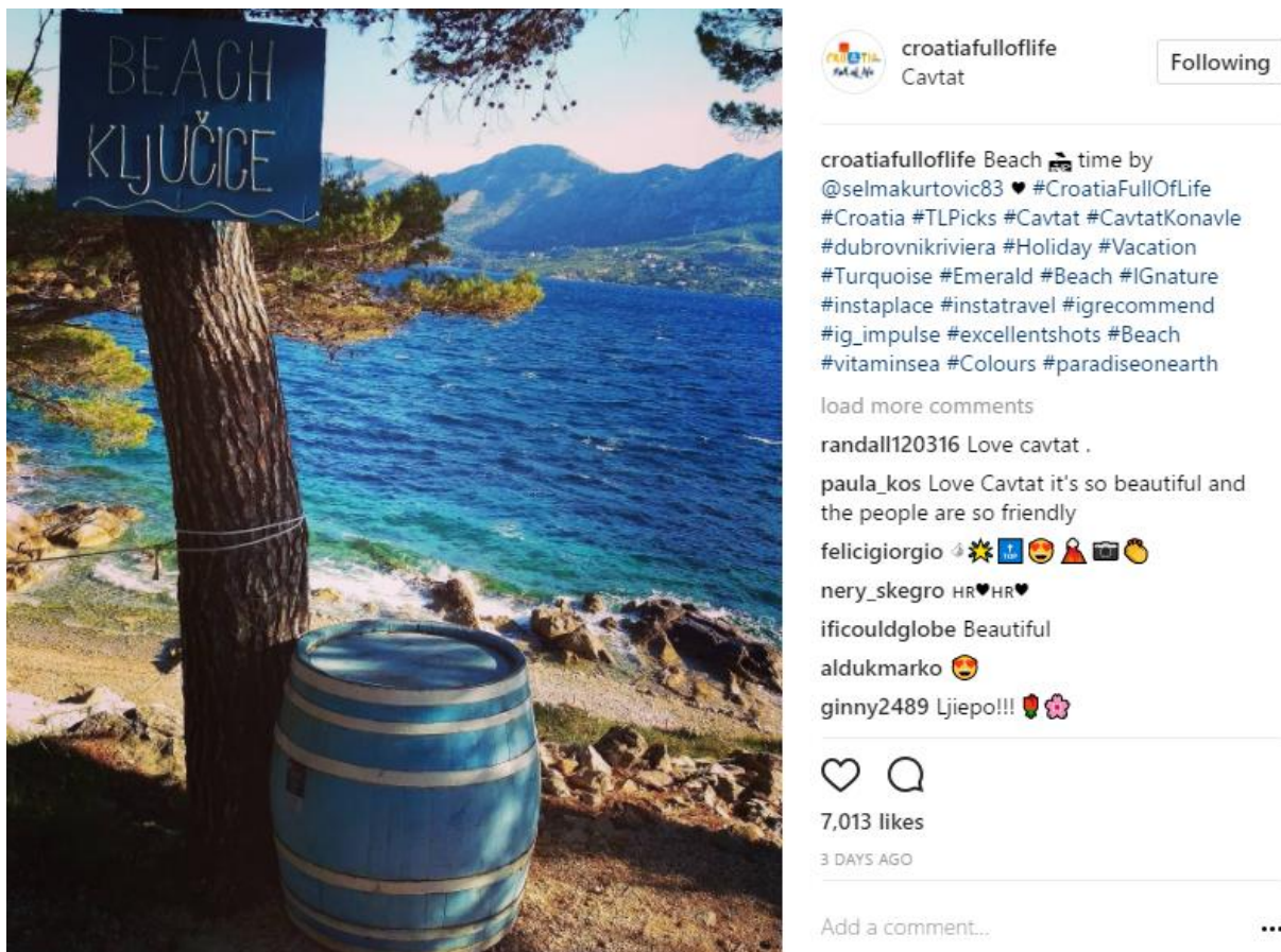
Slika 6: Korištenje oznake lokacije, Instagram 6

CTA koriste za neobaveznu komunikaciju s korisnicima i postavljaju jednostavna pitanja na koje korisnici mogu jednostavno i kratko odgovoriti kao što su: „Jeste li spremni za put?“, „Jeste li spremni za plažu?“ ili koriste mogućnost označavanja prijatelja u komentarima ispod slike kako vi što veći broj ljudi vidio sliku i kako bi doseg fotografije, ali i samog profila bio veći kao naprimjer: „Označi prijatelja kako bi mu poželio sretan ponedjeljak!“ Također, za veći broj komentara i bolji interakciju koriste „Pogodite gdje se nalazi!“ gdje namjerno izostave bilo kakvu lokacijsku oznaku nekog mjesta u Hrvatskoj, a korisnici moraju pogoditi i napisati u komentar gdje se to mjesto u Hrvatskoj nalazi.