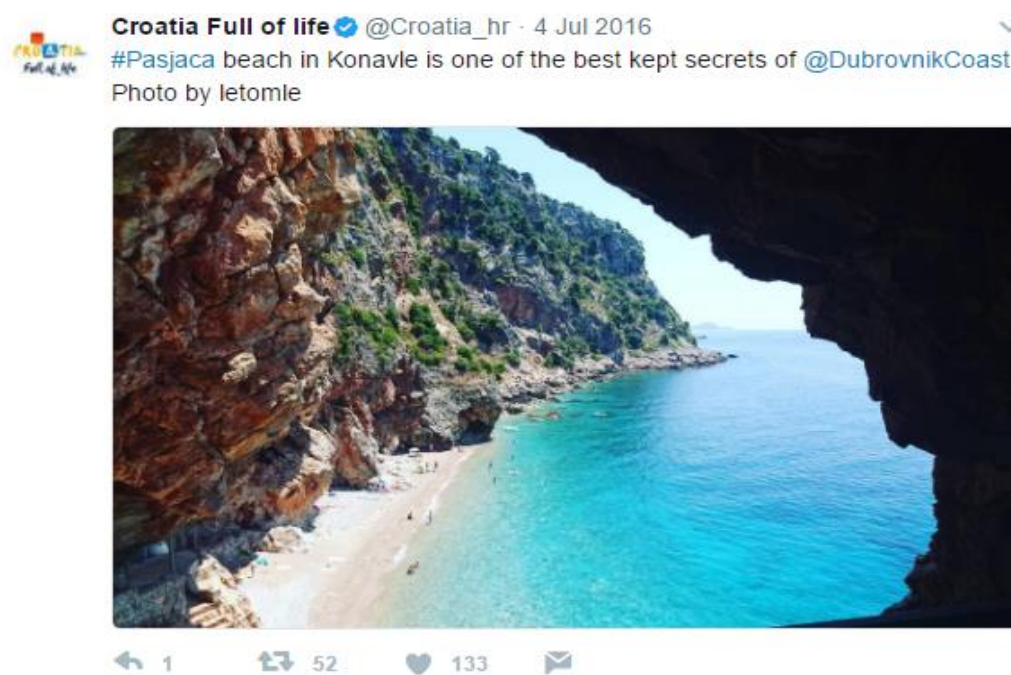
Slika7: Korištenje mentiona i hashtaga, Twitter 7

Za razliku od Instagrama koji također funkcionira na principu pretraživanja i sortiranja sadržaja pomoću hashtagova, na Twitteru službeni hashtagovi #CroatiaFullOfLife i #Croatia nisu konstantni u svakoj objavi. Za fotografije različitih mjesta diljem Hrvatske koriste hashtag mjesta koji je prikazan na slici naprimjer: #Brač, #Hvar ili #Trogir. Osim hashtaga, za Twitter je karakterističan i takozvani „Mention“ koji započinje oznakom @ i korisničkim imenom na Twitter profilu tako uz sadržaj koriste (osim hashtagova) i mogućnost „spominjanja“ pa često tagiraju turističke zajednice pojedinih mjesta naprimjer @LikeZadar ili @NPKrka. Svi postovi su pisani isključivo na engleskom jeziku.