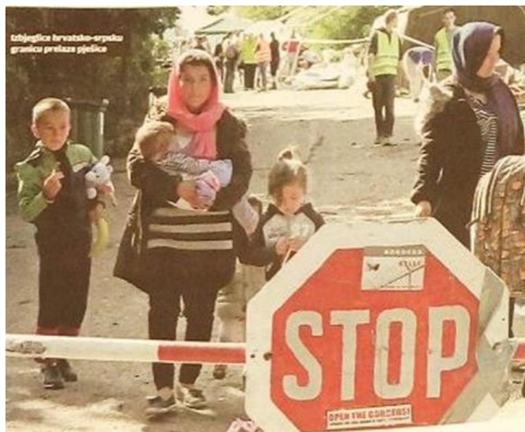
Slika 2. Večernji list, 2.10.2015., 10. str

sličnim prizorima posebno je potresno, no postoji svjesnost da je njihov najveći blagoslov u ovakvoj situaciji, barem kod onih mlađih, njihovo nerazumijevanje situacije. Posebno je to vidljivo na Slici 1 gdje se dječak bezbrižno igra na plastičnim štitovima policije, a na njegovom licu nazire se čak i osmijeh. Ta je fotografija i primjer da ograda može biti i ljudska u obliku policije koja ne propušta dalje. Vidljiv je i očiti kontrast – nevinost i, moglo bi se čak reći, blaženstvo dječaka, nasuprot reda policije s plastičnim štitovima koji u ovom slučaju predstavljaju nekakvu negativnost, protutežu dječjoj pozitivnosti. U pozadini se vide i snažne ruke koje dječaka drže, kao da simboliziraju snagu njegovih roditelja koji će ga po svaku cijenu dovesti u bolji svijet, a igra dječaka, unatoč uvjetima, simbolizira roditeljsku odlučnost da njihovo dijete što bezbolnije prođe kroz taj proces tranzicije. To je prikazano i na Slici 2, gdje djeca imaju igračke koje simboliziraju njihovo djetinjstvo na putu. U to su vrijeme, novine bile pune fotografija koje prikazuju djecu s igračkama koji gledaju u daljinu kroz kordone policije, kroz ograde, kroz plastične štitove policajaca i druge raznorazne barijere.