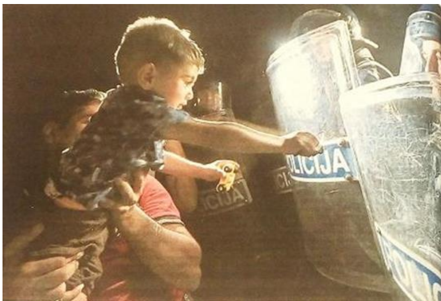
Slika 1. Večernji list, 20.9.2015., Specijal, 30 str.

Glavna karakteristika prvog izbjegličkog vala koji se dogodio u 2015. godini, činjenica je da Europska unija i njezini čelnici očigledno nisu znali kako se prema pridošlicama odnositi. Pokušavali su ih spriječiti pri ulasku u Europsku uniju ili ih od toga nekako odvratiti. Razdoblje su svakako obilježile raznorazne žice i ograde, napravljene od različitih metalnih materijala ili u formi ljudske barijere, kao što su to primjerice policajci i policijski kordoni, vojska. Uzevši u obzir takvo stanje, jasno je da se i kroz brojne fotografije u analiziranim listovima provlačila slična tema. Izbjeglice uvijek gledaju kroz nekakvu ogradu ili žicu, ona im stoji na putu prolaska, pokušavaju je srušiti ili ukloniti na neki drugi način.