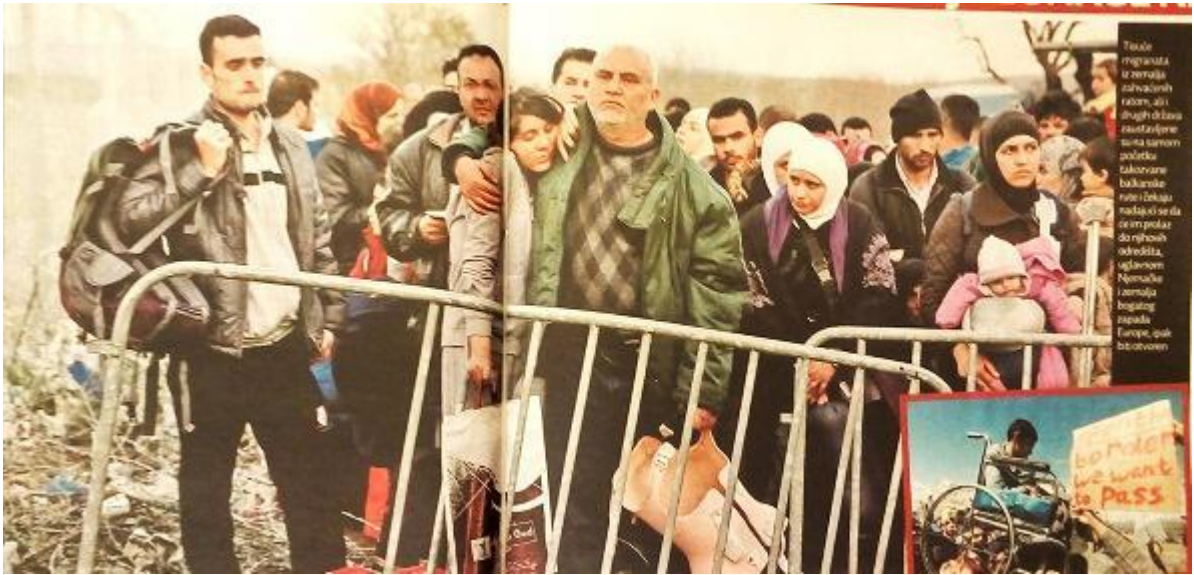
Slika 3. Jutarnji list, 29.02.2016., 8.-9. str.