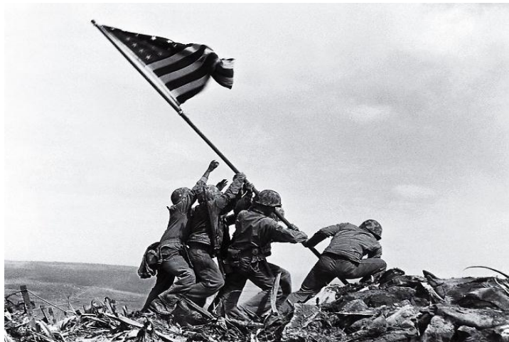
Slika 18. Flag raising on Iwo Jima, 1945.