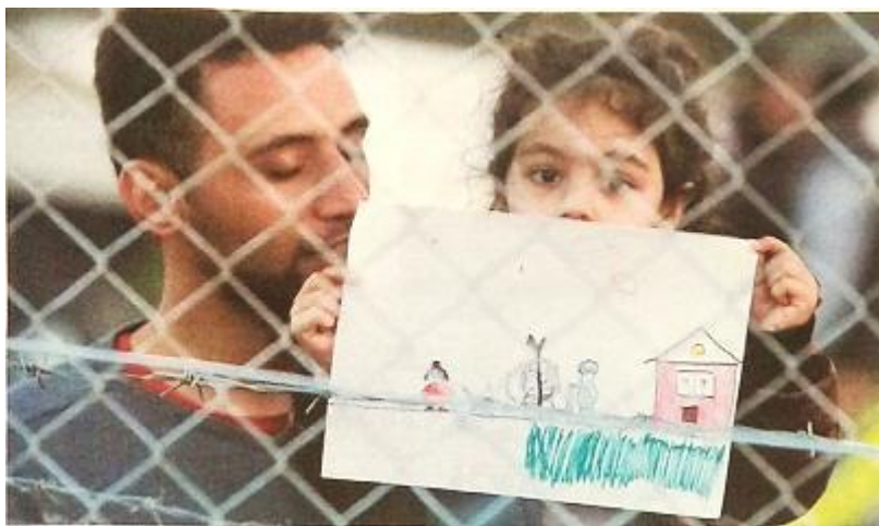
Slika 16. Večernji list, 02.12.2015., 9. str.

Neke od manjih fotografija izdvajaju jednu ili dvije osobe, dok neke donose fotografije više ljudi, međutim ako se uzme u obzir da su to djeca, iz takvog se prikaza ne može iščitati nikakva prijetnja.