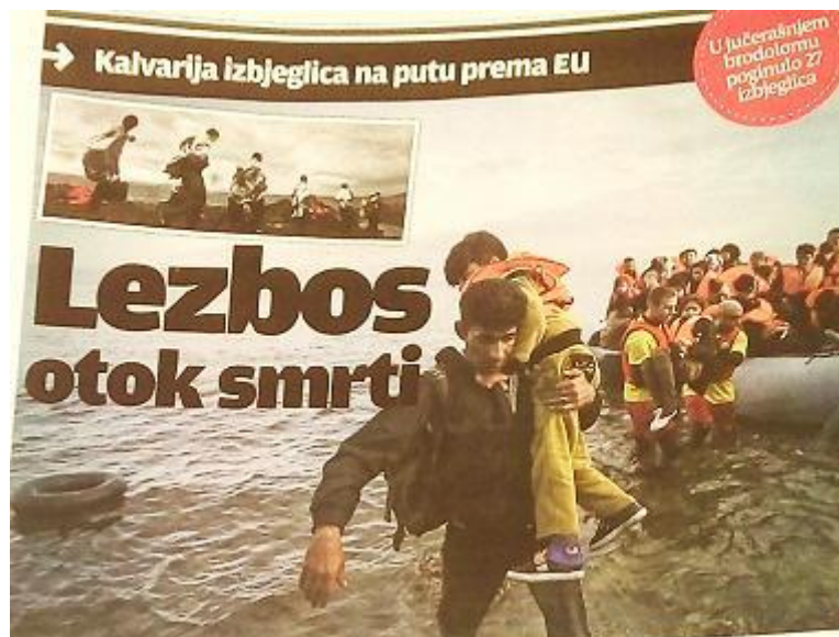
Slika 10. Večernji list, 12.11.2015, 12. str.

Slika 9 ide i dalje od toga zato što daje usporedni prikaz kako granica izgleda u Mađarskoj, a kako u Hrvatskoj. Na mađarskoj strani vidi se žilet žica kroz koju se provlače izbjeglice i migranti, dok, iako čuvani od strane policajaca, na hrvatskoj strani oni stoje slobodno. Tek iščitavanjem teksta koji prati sliku, saznaje se da se fotografijama želi dočarati stanje na granicama, no ostaje pitanje konotativnog značenja i onoga svega što se na slikama ne može vidjeti, a što se događalo i s hrvatske strane.