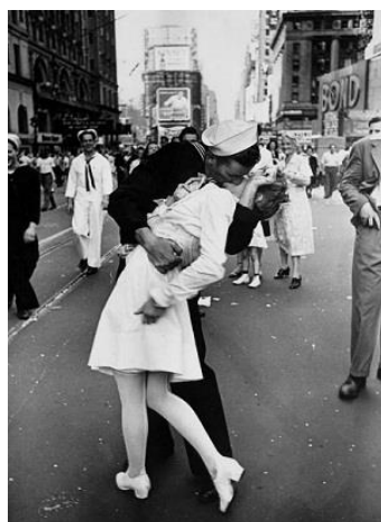
Slika 19. V-J Day in Times Square, 1945.