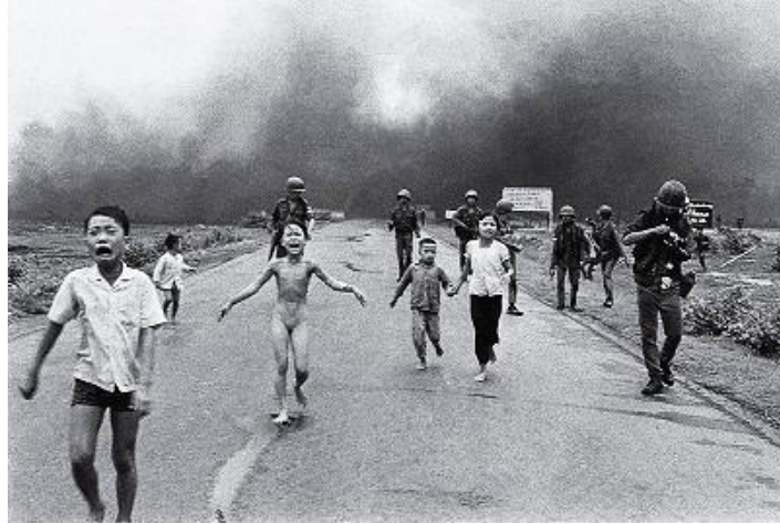
Slika 17. The Terror of War, 1972.