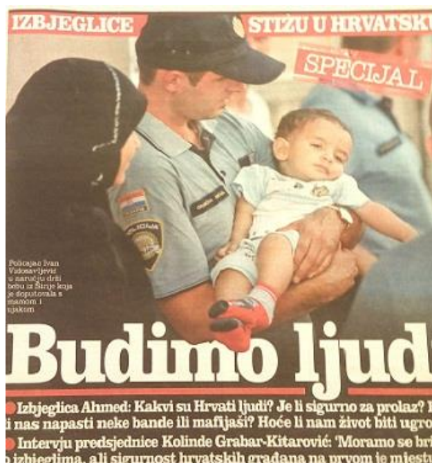
Slika 22. Jutarnji list, 17.09.2015., naslovnica

Ovo je fotografija sa srpsko-hrvatske granice, a prikazuje hrvatskog policajca koji u rukama drži dijete izbjeglicu nakon što je djetetova majka zbog zdravstvenih problema morala u bolnicu. Fotografija se nalazila na naslovnici, a više manjih fotografija istih subjekata nalazila se unutar novina. Također, objavljena je i u Jutarnjem listu i u Večernjem listu . S natpisom „Budimo ljudi“, jasno je da fotografija i urednik koji ju je tako postavio, s tim naslovom, želi pobuditi osjećaje sažaljenja i sućuti nad ovim djetetom, odnosno, izbjeglicama i migrantima u cjelini. Zanimljivo je da dijete u rukama drži policajac, pripadnik snaga koji bi izbjeglicama i migrantima trebao biti na dijametralno suprotnoj poziciji, on bi trebao biti taj koji im predstavlja problem, barijeru pri ulasku u državu. Ovom fotografijom je jasno da se ne pokušava propagirati takva politika i da se izbjeglice i migranti žele predstaviti kao žrtve, a ne kao potencijalna prijetnja. Fotografija se uklapa i u diskurs „Mi i Oni“ u kojem su Hrvati prikazani kao humani, spremni na pomoć unatoč svemu, općenito bolji nego pripadnici policijskih snaga u okolnim državama. Bilo kako bilo, fotografija je ostala zapamćena i već je sada, s relativno malim vremenskim odmakom od tih događanja, poprimila ikonički status.