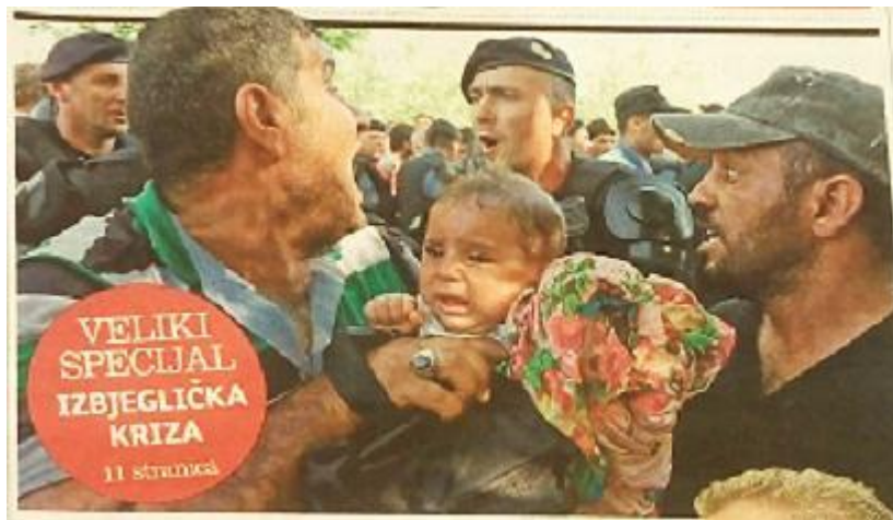
Slika 12. Jutarnji list, 18.09.2015., naslovnica

Fotografijama u ovoj kategoriji dominiraju emocije vidljive na njihovim licima. Tako od pet priloženih sličica na Slici 11 tri prikazuju izraze lica subjekata fotografije. Najveći dojam svakako ostavlja posljednja, najdonja sličica koja prikazuje dijete u nekakvoj kabanici, s velikim podočnjacima, vidno iscrpljeno. Iz njegovog se pogleda može iščitati sumornost situacije, ali nazire se i natruha nekakve prijetnje, upozorenja ili bi to možda moglo biti dostojanstvo kojim poručuje da je preponosan da bi ga se fotografiralo u ovakvim situacijama. Na slici iznad njega vidi se uplakano manje dijete i muškarac koji ga čuva, vjerojatno djetetov otac, dok čovjek na slici iznad (u sredini) na ramenima nosi čak dvoje uplakane djece, dvije djevojčice. Preostale dvije fotografije, one najgornje, donose prikaz situacije, a upečatljiva je fotografija bosih i blatnjavih nogu zato što se može staviti u kontekst kada se zna da su brojne izbjeglice i migranti na dugom i teškom putovanju izgubile svoju obuću i nisu imale izbora nego hodati bos. Svaka od ovih fotografija izaziva sažaljenje pa se može doći do zaključka da su izbjeglice i migranti prikazivani kao žrtve zato što je sažaljenje prva emocija koja se povezuje sa statusom žrtve.