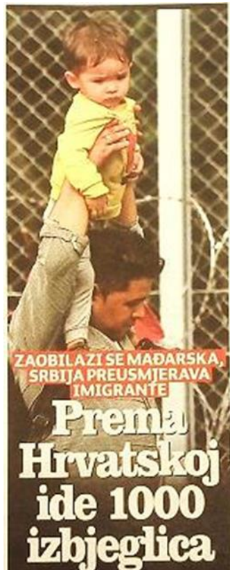
Slika 14. Jutarnji list, 16.09.2015., naslovnica

Primjer je i Slika 14 koja prikazuje muškarca koji na ramena stavlja dijete. Iako muškarčev izraz lica ne možemo vidjeti, brižnost i sigurnost kojom drži dijete i pažljivost u pokretu kojim ga smješta na ramena indicira da se radi o djetetovu ocu. Djetetov izraz lica govori da mu je nešto drugo privuklo pažnju, ali ne pokazuje nikakvu zabrinutost ili sumnju u ruke koje ga drže. I u ovom se slučaju u pozadini, neizostretno vidi ograda koja je već spominjana u prethodnim poglavljima. Osim djeteta, muškarac već na leđima ima i ruksak, pa se može pretpostaviti da taj zajednički teret nije lagan. Fotografija se nalazi na naslovnici novine, kao i na unutarnjim stranicama, a preko nje stoji natpis koji govori „Prema Hrvatskoj ide 1000 izbjeglica.“ Diskurzivnom analizom može se zaključiti da odabir ovakvih riječi pomalo budi nekakve osjećaje strepnje i straha, kao da to što prema Hrvatskoj ide 1000 izbjeglica može potencijalno predstavljati velik problem u svakom smislu te riječi. Ipak, to je čista informacija, a za izazivanje straha mogle su se upotrijebiti i puno teže riječi koje bi izazvale i jače konotacije. S druge strane, ako se u obzir uzme konotacija te rečenice i konotacija koje pruža fotografija, dolazi se do zaključka da su one jedna prema drugoj kontradiktorne. Odnosno, fotografija kao da želi ublažiti ono što bi se iz teksta moglo iščitati i osjećaje koje bi on mogao pobuditi. Moglo bi se reći da je fotografija u službi smirivanja tenzija jer