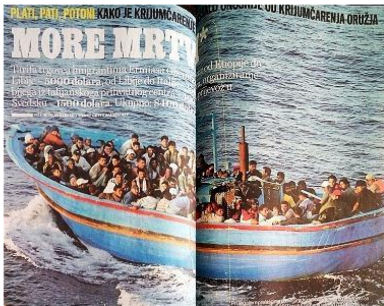
Slika 8. Globus, 18.12.2015., 64. str.