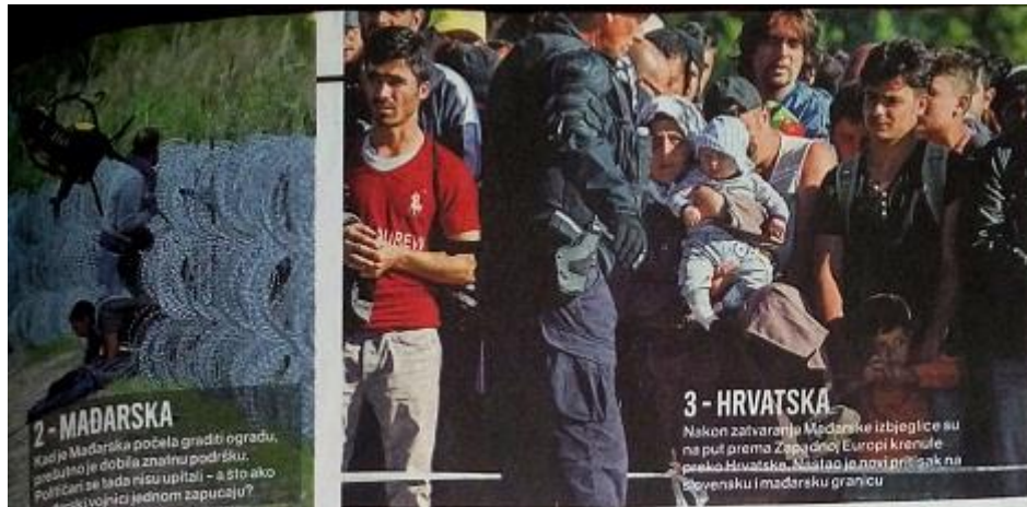
Slika 9. Globus, 09.10.2015., 11. str.

dok je stvarnost zapravo bitno drugačija o čemu svjedoče brojni zapisnici i izvještaji civilnih udruga za prava čovjeka koje su se u tom razdoblju našle na terenu.