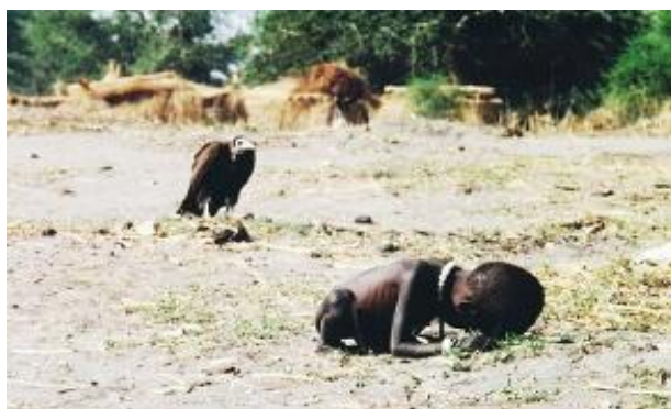
Slika 20. Starving Child and Vulture, 1993.