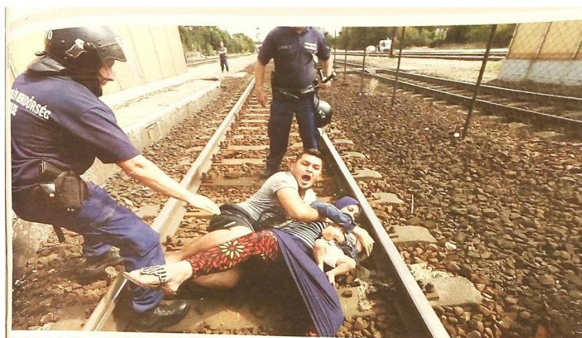
Slika 24.

Slično je i sa Slikom 23 objavljenom u Večernjem listu koja prikazuje djevojčicu koja izgleda kao da od policajaca traži vodu ili ju je neznancima jednostavno privukla dječja radoznalost. U kontrast je stavljena nevinost na njenom licu i pendrek kojeg možemo razaznati na policajčevoj odori, a koji, u ovom kontekstu, simbolizira prijetnju. Policajac ponovno predstavlja prepreku na putu, a kada u širi kontekst stavimo i manje fotografije koje se nalaze unutar novina, vidimo da u nizu stoje tri policajca koji onda i doslovno predstavljaju prepreku. Kada se uoči kontrast uzrasta djevojčice i policijskih snaga koje su tu postavljene, situacija izgleda i pomalo apsurdno (iako shvaćamo oni tu nisu samo radi nje).