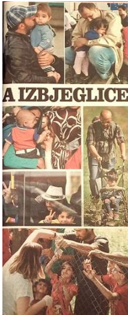
Slika 15. Jutarnji list, 18.09.2015., 9. str.

subjektima na slici (vidno izmučen muškarac koji nosi malo dijete) kao da poručuje: „Da, dolazi puno izbjeglica, ali to su uglavnom roditelji i djeca pa nema straha.“ – straha od nekakve prijetnje sigurnosti, straha od nereda, terorizma.