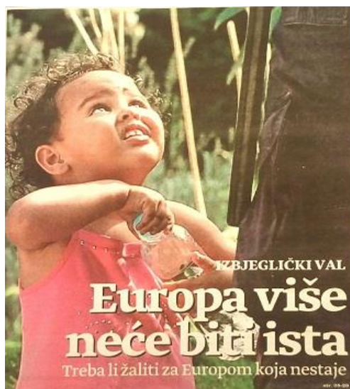
Slika 23. Jutarnji list, 19.09.2015., naslovnica

Slično je i sa Slikom 23 objavljenom u Večernjem listu koja prikazuje djevojčicu koja izgleda kao da od policajaca traži vodu ili ju je neznancima jednostavno privukla dječja radoznalost. U kontrast je stavljena nevinost na njenom licu i pendrek kojeg možemo razaznati na policajčevoj odori, a koji, u ovom kontekstu, simbolizira prijetnju. Policajac ponovno predstavlja prepreku na putu, a kada u širi kontekst stavimo i manje fotografije koje se nalaze unutar novina, vidimo da u nizu stoje tri policajca koji onda i doslovno predstavljaju prepreku. Kada se uoči kontrast uzrasta djevojčice i policijskih snaga koje su tu postavljene, situacija izgleda i pomalo apsurdno (iako shvaćamo oni tu nisu samo radi nje).