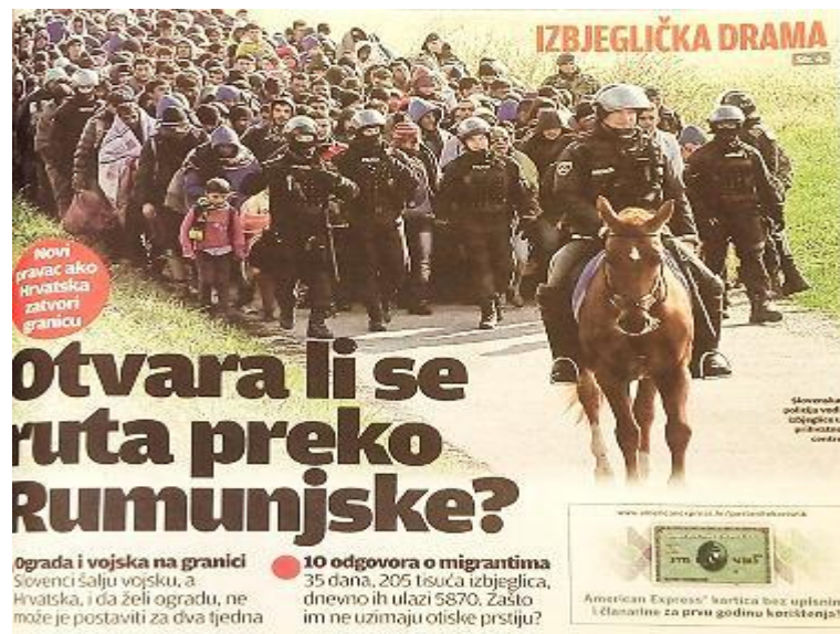
Slika 25. Večernji list, 21.10.2015., naslovnica

prikazuje muškarca, ženu i dijete koji leže na željezničkoj prugi u, onome što se čini, očajnički pokušaj bježanja od mađarske policije. Fotografija ujedinjuje nekoliko označivača spomenutih već prije – željezničku prugu kao simbol puta, policajce kao prepreku (što ovdje doslovno i jesu), izbjeglice ili migrante kao žrtve, a posebno je užasavajuće vidjeti tako malo dijete, bebu, u ovakvoj situaciji. Vidljivo je da žena, vjerojatno majka djeteta, pokušava rukama zaštititi glavu bebe od udara u metal tračnica ili u pod dok ženu muškarac drži ispod ruku. Ne može se točno razlučiti je li muškarac negativac u ovoj priči koji se od vlasti brani tako da je uzeo ženu za taoca ili pokušava ženu obraniti od policajaca koji je želi nekamo odvesti. Jedan od policajaca kreće se prema trojki na podu dok drugi policajac naizgled mirno promatra kako će se situacija dalje odvijati i pridržava pendrek za svaki slučaj. Nažalost, pozadina ove fotografije nepoznata je pa se ne može sa sigurnošću reći koje čitanje fotografije odgovara stvarnosti.