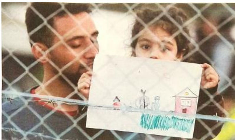
Slika 16. Večernji list, 02.12.2015., 9. str.

Neke od manjih fotografija izdvajaju jednu ili dvije osobe, dok neke donose fotografije više ljudi, međutim ako se uzme u obzir da su to djeca, iz takvog se prikaza ne može iščitati nikakva prijetnja.