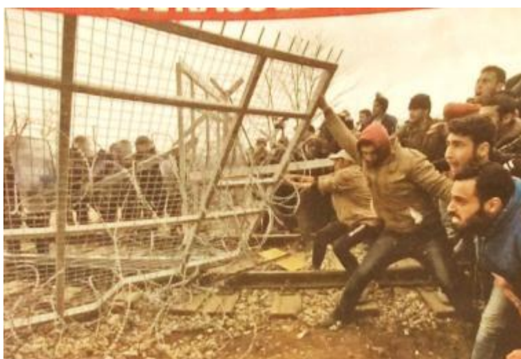
Slika 4. Jutarnji list, 01.03.2016., 10. str.

medijskom prikazu s obzirom na smjenu vlasti. Promjena se može primijetiti u količini fotografija koje prikazuju izbjeglice i migrante zato što se vidi pad objava fotografija te tematike kroz sve novine. Taj pad nešto je manje izražen u Jutarnjem listu , dok je najizraženiji u Globusu i Nacionalu . Iako kvantitativna analiza nije analiza koja se koristi u ovom radu, ove podatke treba imati na umu. S druge strane, ne postoji konkretan način dokazivanja da je taj pad u objavama povezan s promjenom na političkoj sceni. U obzir treba uzeti i da dolazi do zasićenja određenim sadržajem kod publike pa ti sadržaji više ne budu aktualni u medijima i to da su neke druge teme preuzele primat (analize tadašnje političke situacije i aktera, vanjskopolitička događanja i slično). Stoga se ne može povući konkretna uzročno-posljedična paralela.