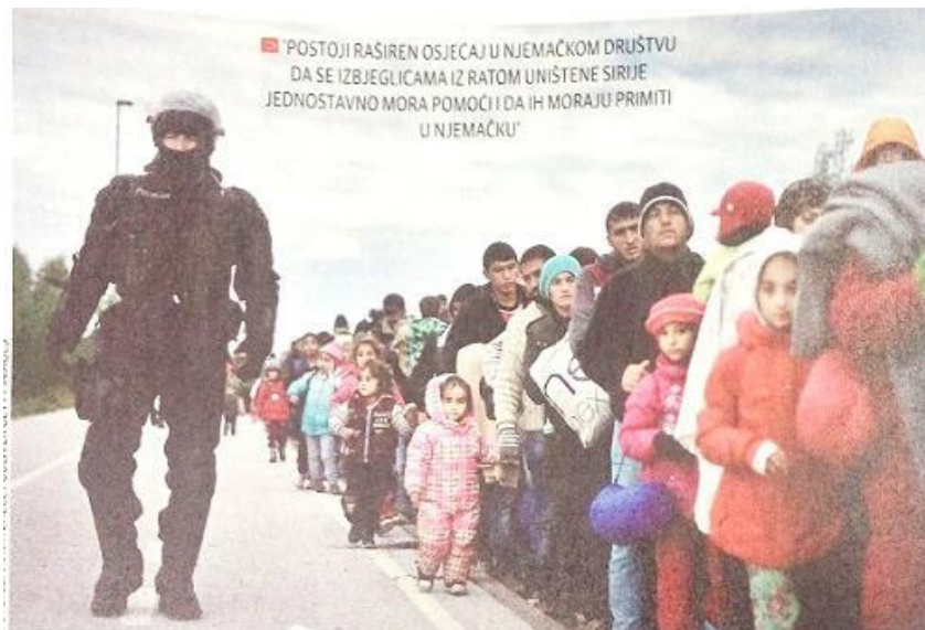
Slika 5. Nacional, 27.02.2016., 34. str.

Na fotografijama izbjeglica i migranata, osim ograde i bilo kakvih ogradnih sredstava, često se uočavaju i prometna sredstva koja na neki način simboliziraju put. Taj put može biti u doslovnom smislu, kretanje od točke A do točke B, ali on može označavati i simboličan put izbjeglica i migranata u bolji život, bježanje iz rata, pogibije i nesreće u neku svjetliju budućnost.