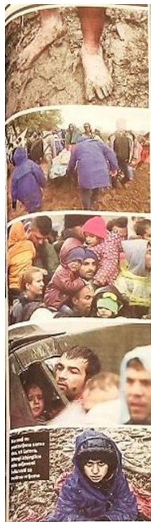
Slika 11. Večernji list, 20.10.2015, 5. str

Broj ljudi prikazanih na fotografijama također utječe na to kako će poruka koju nosi biti percipirana. Pojedinačne ili fotografije koje prikazuju manji broj ljudi (dvoje do četvero) primatelji poruke ne percipiraju kao prijetnju zato što su brojčano nadmoćni. Masovne fotografije bi mogle izazvati osjećaje ugroženosti, propitivanja motiva pa možda čak i straha.