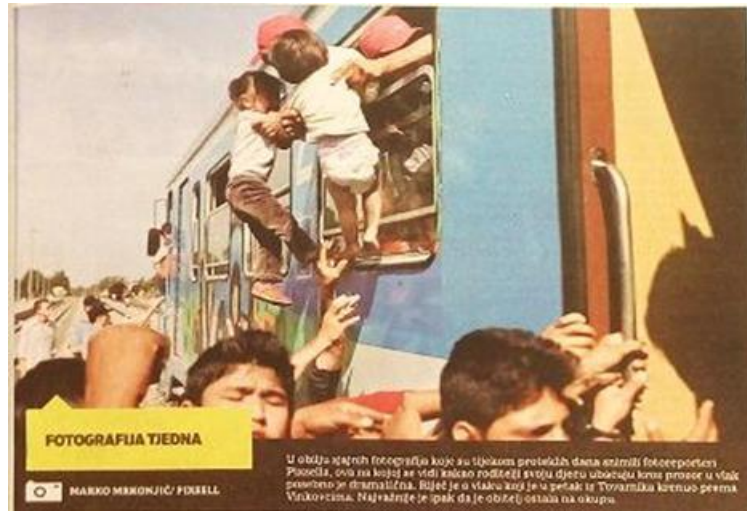
Slika 7. Večernji list, 20.09.2015., 7. str.

Potpuna suprotnost prethodnoj slici je Slika 7 koja itekako označava kretanje. Možda čak označava trenutke koji su obilježili cijelu jednu etapu priče o izbjeglicama i njihovom putovanju. Mediji su svako malo bili prepuni snimki i fotografija trenutaka ukrcavanja u vlak, trenutaka koji su (barem) dvostruko emocionalno obilježeni. S jedne strane tu je sreća onih koji su se uspjeli ukrcati zato što su uspješno prošli jedan dio svog puta i mogu prijeći na sljedeći, dok su s druge strane tuga i očaj onih koji to nisu uspjeli. Posebno su potresne sudbine onih koji su se uspjeli ukrcati i izboriti za svoje mjesto, ali su njihove obitelji ili djeca ostali za njima. Kaos pri ukrcavanju vidljiv je i na ovoj fotografiji. U dnu se vide ljudi, pretežno mladići, koji se bore za ulazak, može se pretpostaviti do kakvog je naguravanja došlo. Može se razaznati i da je ovo zadnji vagon, dakle posljednja prilika do sljedećeg puta koji je vremenski neizvjestan. Ono što promatrač odmah uoči, i ono što je subjekt ove fotografije, su djeca, bebe, koji se dodaju (vjerojatno roditeljima i obitelji) kroz prozor vagona. Nesvakidašnjost takvog događaja jasno dočarava bezizlaznost situacije.