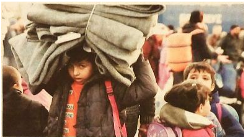
Slika 13. Večernji list, 02.02.2016., 5. str.

Natpis koji se nalazi u lijevom donjem kutu slike kaže da o izbjegličkoj krizi više možemo pronaći na 11. stranici novina gdje se nalazi cijelo specijalno izdanje posvećeno samo toj temi. Ovdje se može o upotrebi riječi raspravljati na razini diskurzivne analize jer i činjenica da je upotrijebljena riječ „izbjeglice“ umjesto riječi „migranti“ govori u prilog tezi da su izbjeglice i migranti više prikazivane kao žrtve nego kao prijetnja. Konotativno značenje koje se pridaje riječi „izbjeglica“ je bitno drugačije od onoga koje se pridaje riječi „migrant“ – prva se povezuje uz bespomoćnost, krhkost, primoranost na neki izbor (kao da nije bilo drugog izlaza), dok se uz riječ migrant vezuje nekakva mogućnost odluke i vlastita volja. Biti izbjeglicom uvjetovano je vanjskim faktorima, dok je biti migrantom vlastiti izbor.