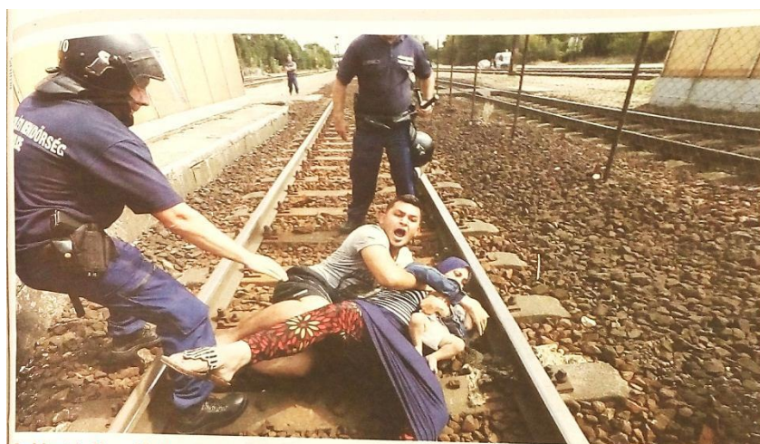
Slika 24. Večernji list, 09.12.2015., 5. str.

Slično je i sa Slikom 23 objavljenom u Večernjem listu koja prikazuje djevojčicu koja izgleda kao da od policajaca traži vodu ili ju je neznancima jednostavno privukla dječja radoznalost. U kontrast je stavljena nevinost na njenom licu i pendrek kojeg možemo razaznati na policajčevoj odori, a koji, u ovom kontekstu, simbolizira prijetnju. Policajac ponovno predstavlja prepreku na putu, a kada u širi kontekst stavimo i manje fotografije koje se nalaze unutar novina, vidimo da u nizu stoje tri policajca koji onda i doslovno predstavljaju prepreku. Kada se uoči kontrast uzrasta djevojčice i policijskih snaga koje su tu postavljene, situacija izgleda i pomalo apsurdno (iako shvaćamo oni tu nisu samo radi nje).