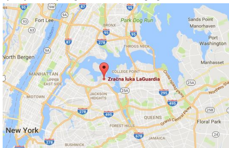
Slika 10 Karta New Yorka

Naime navedeni aerodrom se nalazi u Queensu i uopćen nije okrenut prema Manhattanu gdje se nalaze sve prepoznatljive zgrade s gornje slike. Aerodrom je zapravo okrenut prema četvrti Bronx. Daljnje lokacije koje se potom pojavljuju u filmu su most Queensboro i koncertna