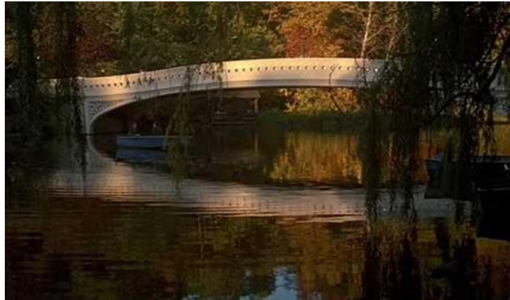
Slika 8. Scena iz filma Jesen u New Yorku

Jesen u New Yorku je ljubavna romantična drama u kojoj glavne uloge tumače Richard Gere i Wynona Ryder. Kao što i samo ime kaže, radnja se odvija na prijelazu iz jeseni u zimu, a film obiluje romantičnim i sjetnim scenama u New Yorku. Jedna od najpoznatijih lokacija koja se prikazuje u filmu je most Bow u