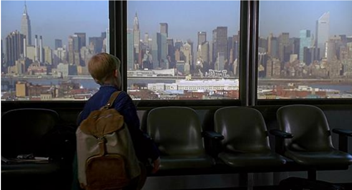
Slika 9 Scena iz filma Sam u kući 2, aerodrom La Guardia

Ovaj sada već kultni obiteljski film koji se već 2 desetljeća emitira u božićno vrijeme postao je svojevrsna razglednica zimskog New Yorka. Film obiluje scenama na svim najpoznatijim lokacijama u božićno vrijeme i što se tiče kadrova s lokacije, smjestio se u sam vrh u odnosu na sve ostale koji su ranije navedeni. Avantura dječaka Kevina zaista je pokrila mnogo gradskih znamenitosti pa tako sam dolazak počinje s dolaskom na aerodrom La Guardia.