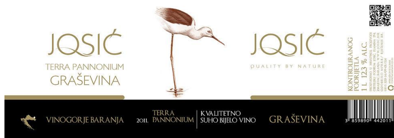
Slika 2: Etiketa Vinarije Josić

Vina Pinkert pokušavaju brend svojih vina kreirati naglašavanjem obiteljske atmosfere same vinarije. Ova vinarija svojim etiketama pokušava poslati razglednicu iz malog mjesta Suza u Baranji i na taj način prikazati bogatu vinsku raznolikost toga kraja. Također, ova vinarija uz svoja vina veže opis Iz Suze s ljubavlju što dodatno podupire njihova nastojanja da prikažu vinariju kao obiteljsku i da prezentiraju Baranju (Vina Pinkert, 2017).