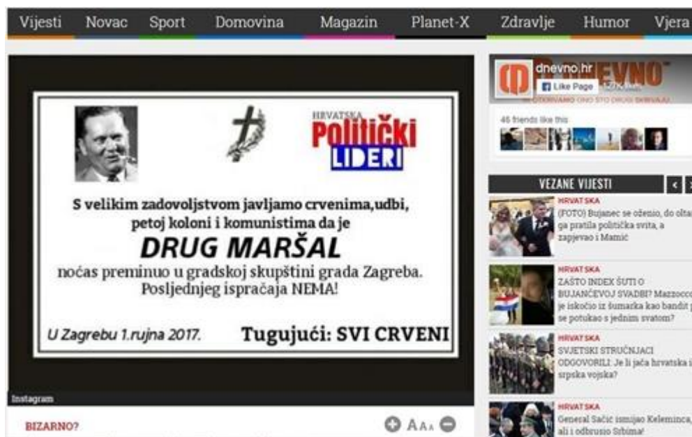
Slika 2: Osmrtnica Josipu brozu Titu

Ilustracija osmrtnice nakon odluke zagrebačke Gradske skupštine o promjeni imena Trga maršala Tita u Trg Republike Hrvatske. Iako je ilustraciju izvorno napravila mladež HDZ-a grada Zadra, portal Dnevno.hr stavio ju je na naslovnicu i prenio kao svoju i tek kasnije u tekstu naveo da ju je izradila mladež HDZ-a. Ovo je primjer vrlo očitog govora mržnje, davajući pritom svim lijevičarima etiketu „crvenih“, a Dnevno.hr u tekstu navodi da je ovo „zanimljiva“ reakcija na promjenu imena trga, pritom subliminalno potičajući korisnike na diskriminaciju. (v. Slika 2)