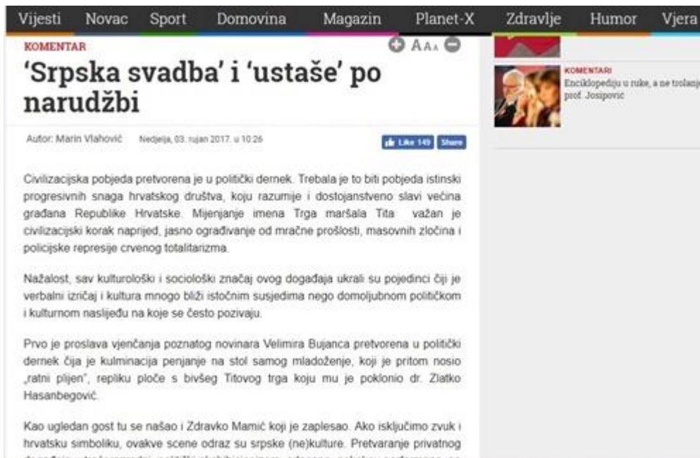
Slika 1: „Srpska svadba“ i „ustaše“ po narudžbi

Već sam naslov ovog komentara i kontekst u kojem je upotrebljen izraz „srpska svadba“ i „ustaše“ aludira na diskriminaciju. Trenutno aktualno mijenjanje ulične ploče Trga maršala Tita glavna je tema većine tekstova zadnjih nekoliko dana na portalu Dnevno.hr. Komentar da je taj potez „civilizacijski korak naprijed“ i „ograđivanje od policijske represije crvenog totalitarizma“ jasan je primjer netolerantnog govora davajući pritom aluziju da je društvo do sada bilo necivilizirano jer je imalo naziv trga po predsjedniku nekadašnje Jugoslavije. U nastavku teksta, autor navodi kako su scene slavlja i plesa svadbe, „ako isključimo zvuk i hrvatsku simboliku, odraz srpske (ne)kulture“, zapravo divljaštvo navodi kao karakteristiku srpske (ne)kulture. Iako bi u komentaru, kao novinarskom žanru, trebalo analitički objasniti tezu iza koje autor stoji, u ovom slučaju su samo nabrojane