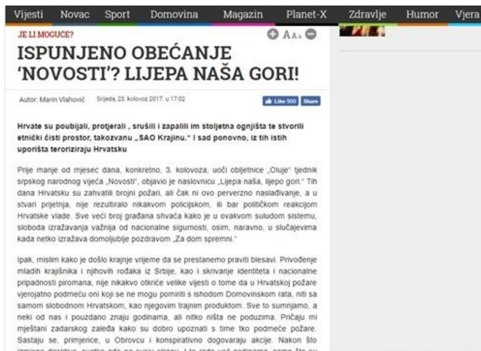
Slika 11: Lijepa naša gori!

Komentar autora na naslovnicu „Lijepa naša, lijepo gori“ tjednika srpskog narodnog vijeća „Novosti“, u najmanju je ruku diskriminatoran i netolerancijski. Ne umanjujući konotacije konkretnog tjednika i njegove naslovnice, autor proziva i krivi, bez konkretnih dokaza, „mlade krajišnike i njihove rođake iz Srbije“ za podmetanje požara. „Privođenje mladih krajišnika i njihovih rođaka iz Srbije, kao i skrivanje identiteta i nacionalne pripadnosti piromana, nije nikakvo otkriće velike vijesti o tome da u Hrvatskoj požare vjerojatno podmeću oni koji se ne mogu pomiriti s ishodom Domovinskog rata, niti sa samom slobodnom Hrvatskom, kao njegovim trajnim produktom.“, autor aludira da se podmetanje požara događa zbog ishoda Domovinskog rata. Zašto bi uostalom nacionalnos određenog piromana trebala biti poznata javnosti osim ako se ne želi potaknuti mržnja prema toj naciji? „Iza bešćutne satire i naslade nad tuđom tragedijom, krije se velikosrpska želja za osvetom.“, zaključio je autor. (v. Slika 11)